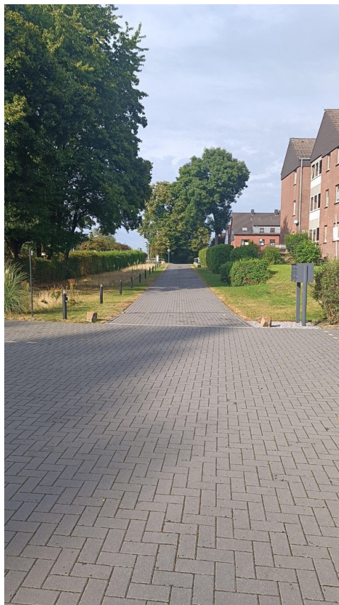
Zufahrt zu Hof