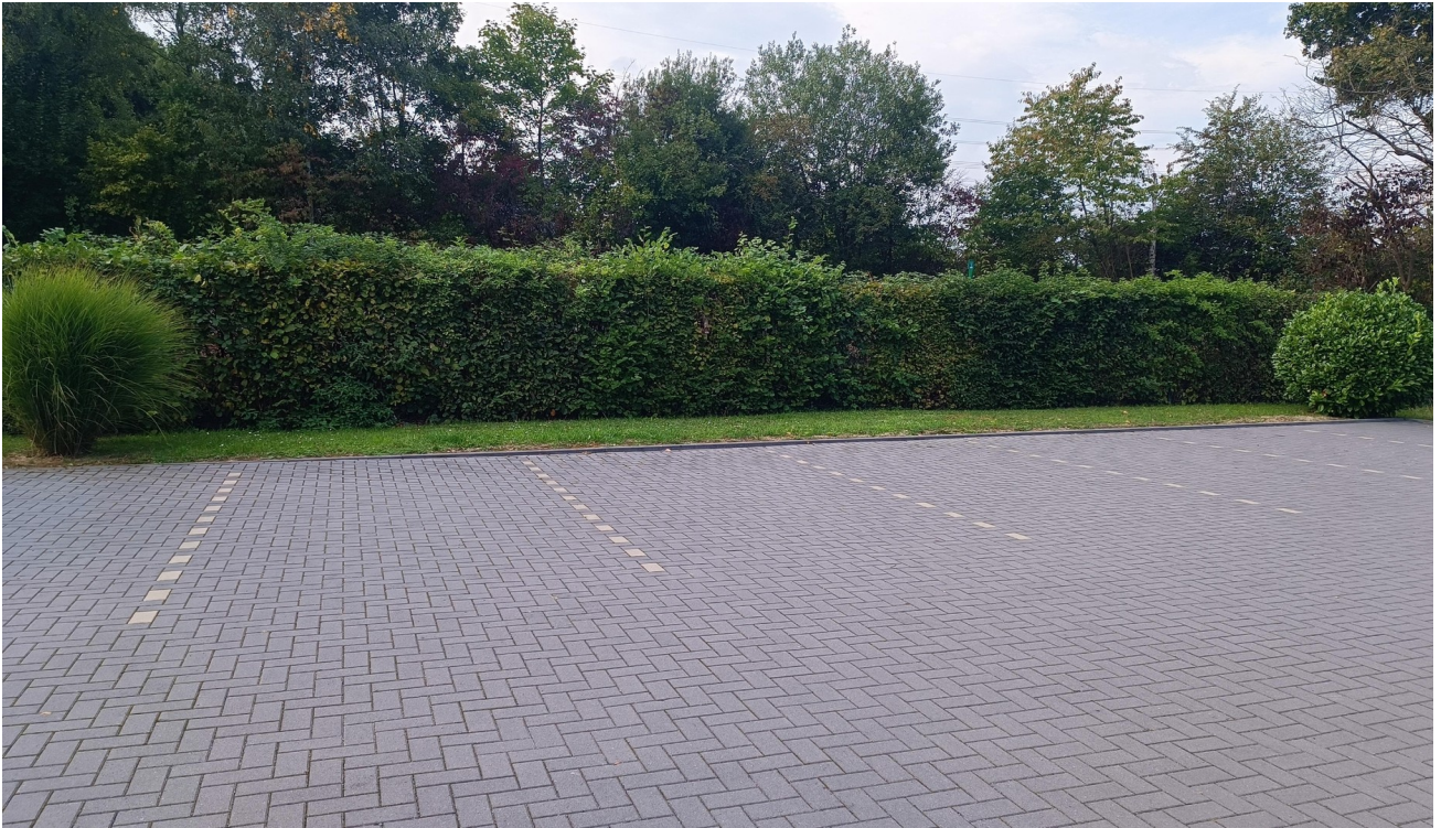
Hof mit Stellplatz