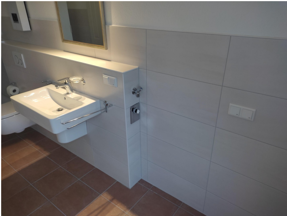
Stellplätze Wama + Trockner