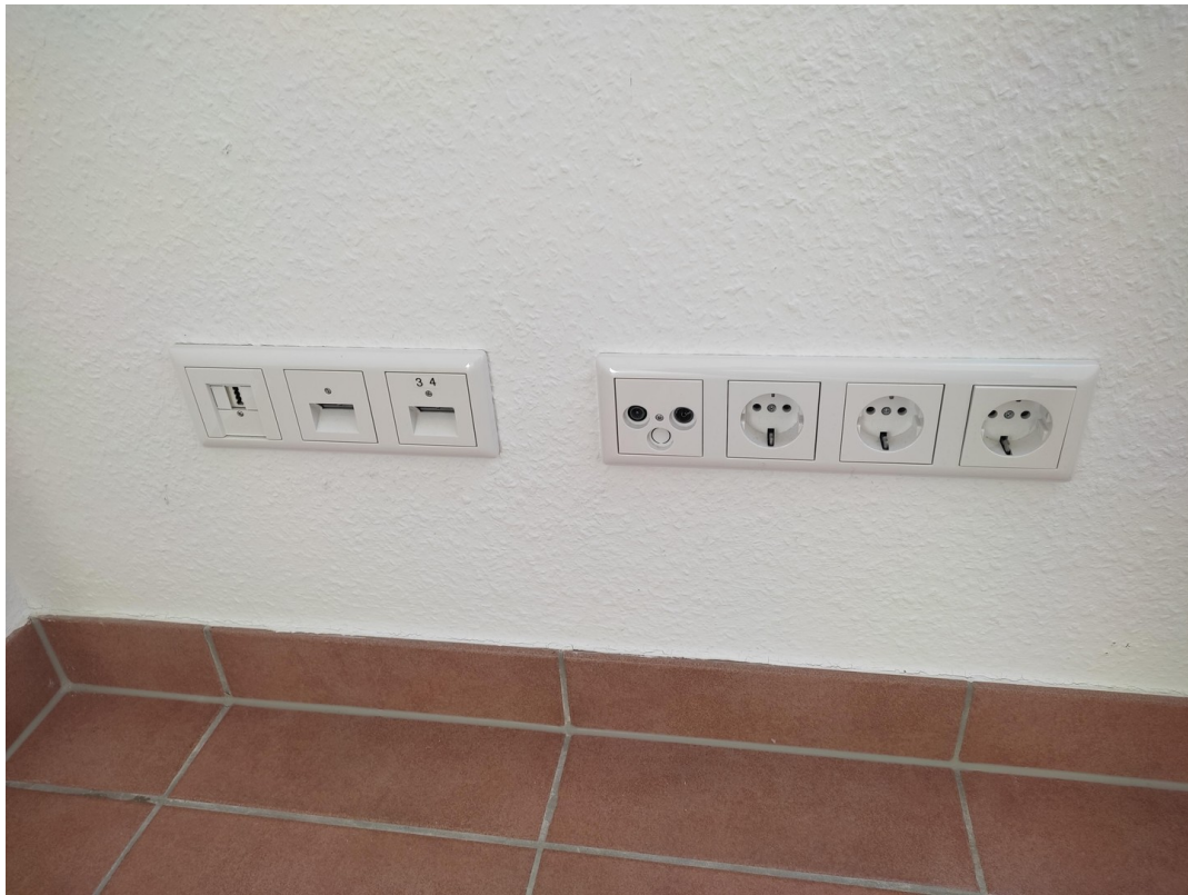
Gira-Elemente für jeden Bedarf