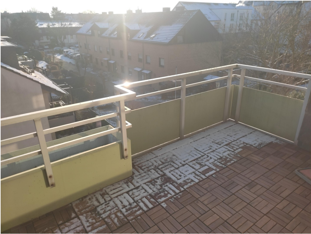
Dachterrasse mit neuem Boden