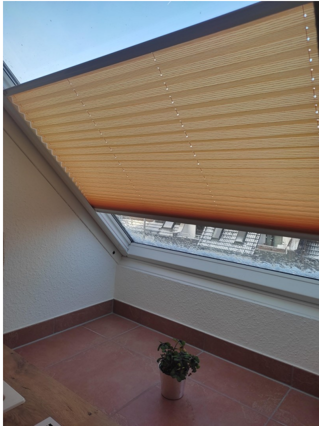
Plissée in Küche