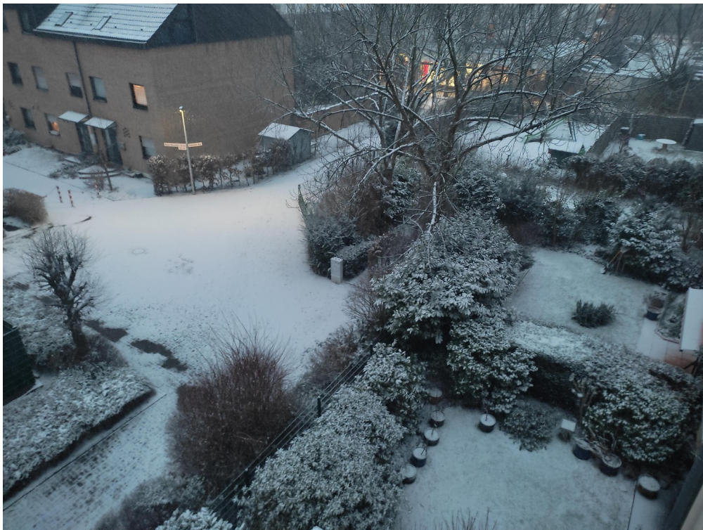
Blick von Dachterrasse