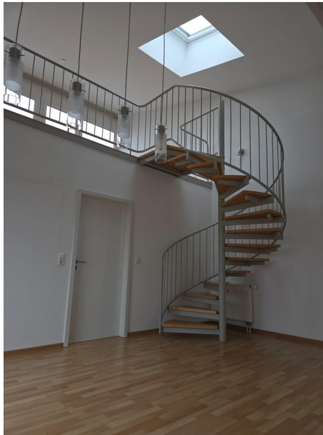
Treppe zur Galerie