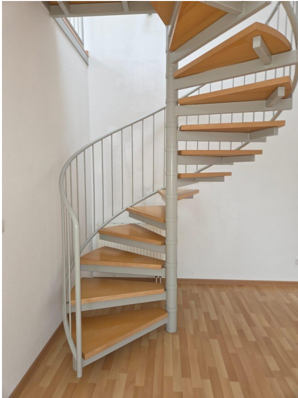
Treppe zur Galerie