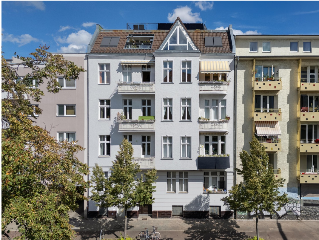
Front Ansicht Haus