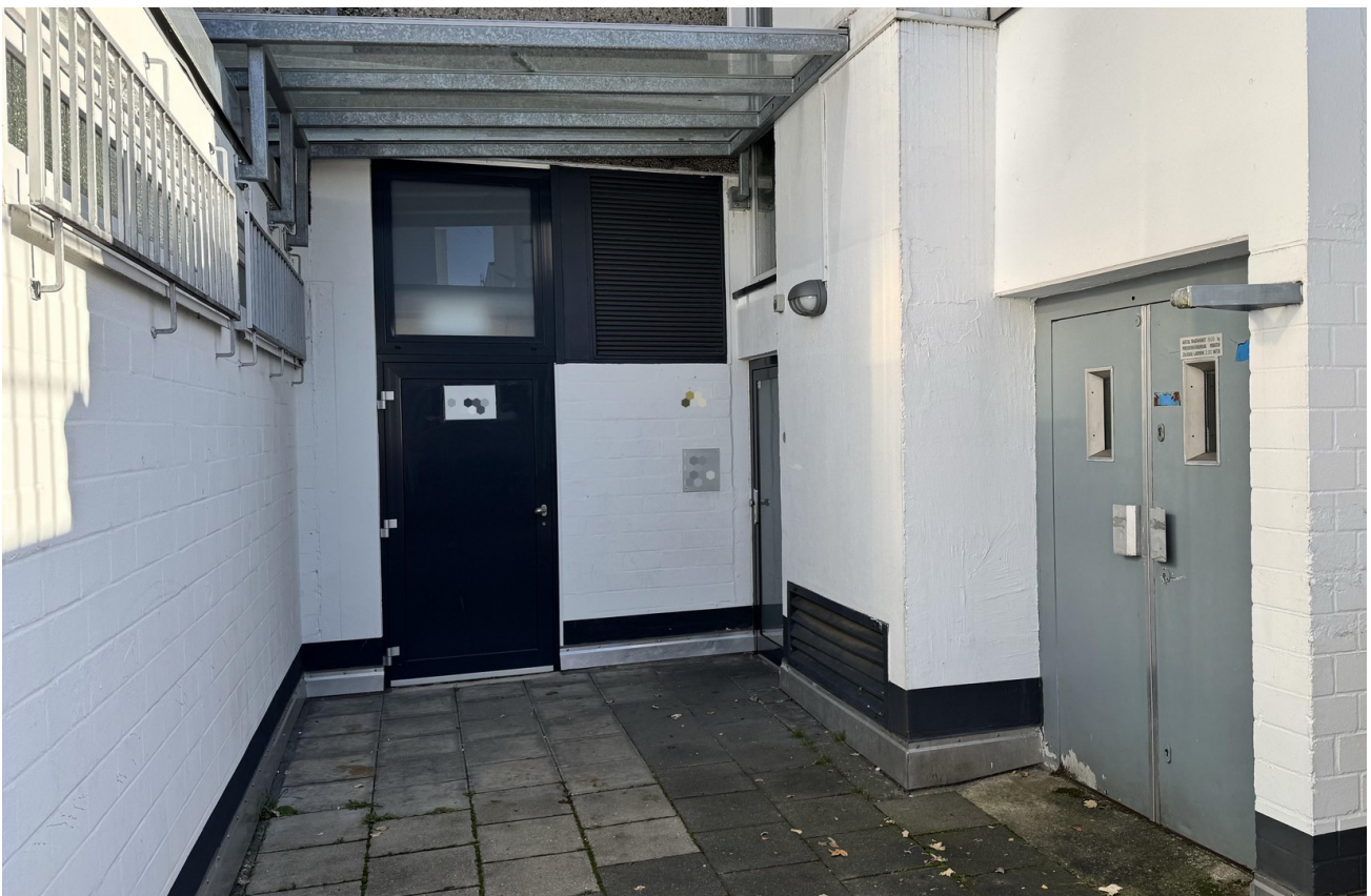
Zugang Laden / Mieter / Aufzug