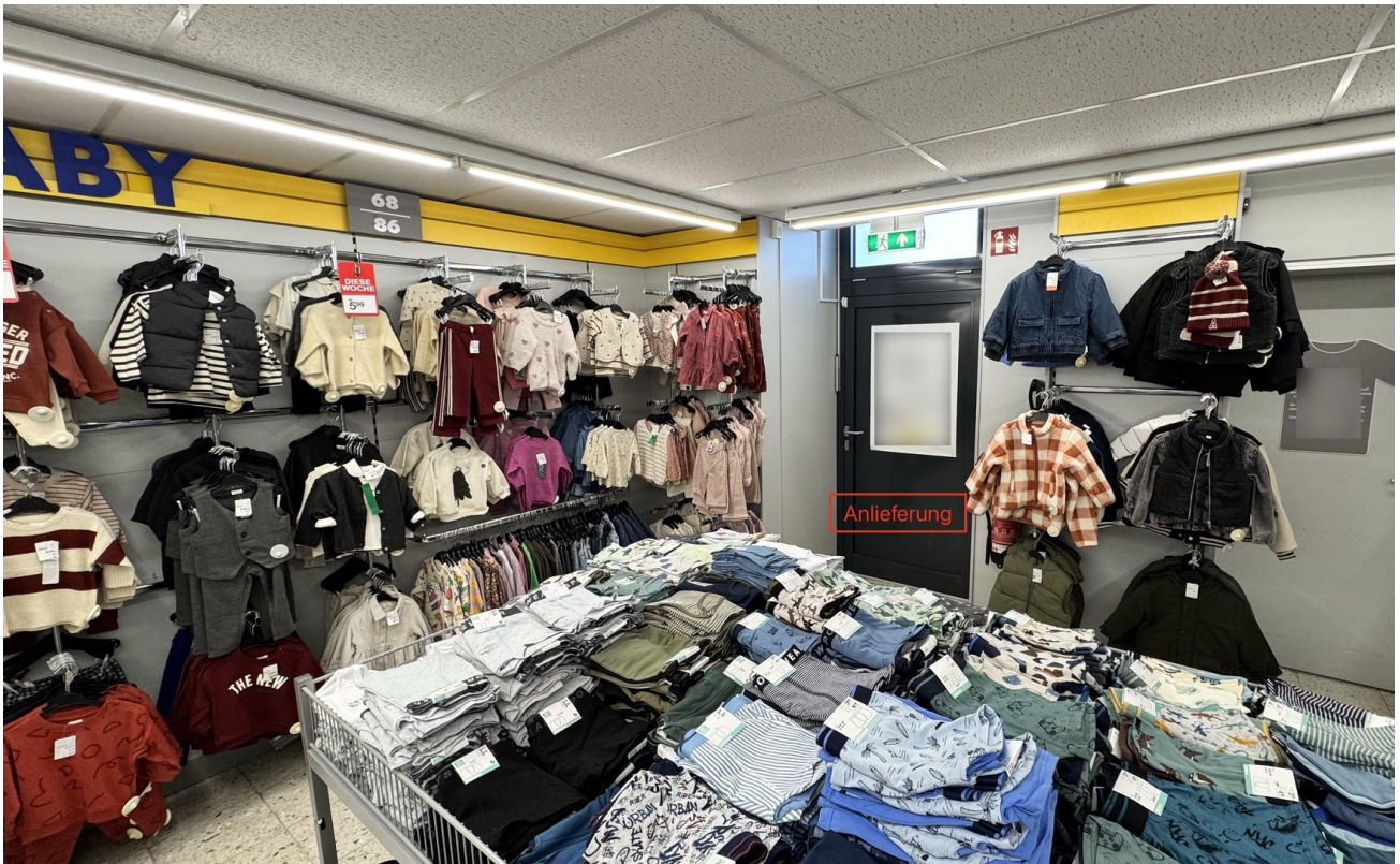
Geschäftsfläche / Anlieferung