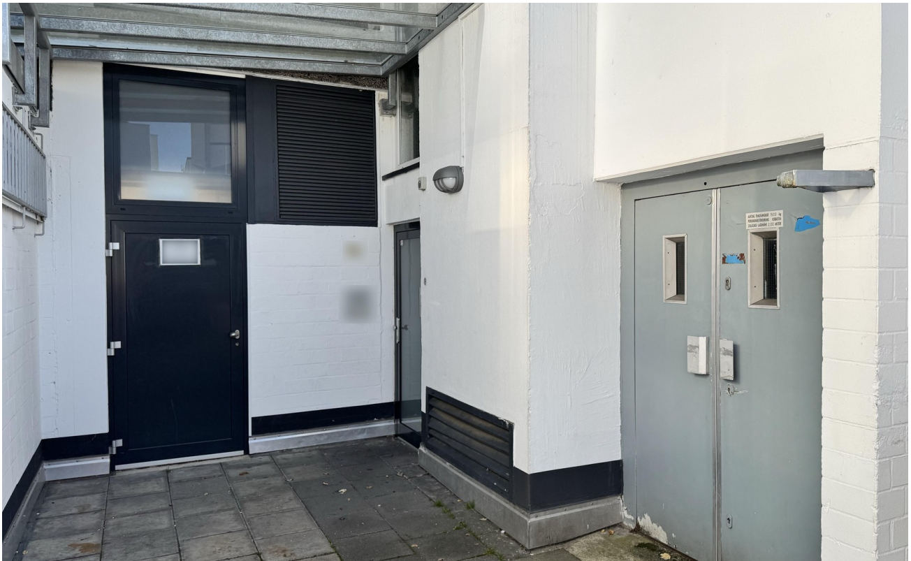
Anlieferung / Lastenaufzug Lag