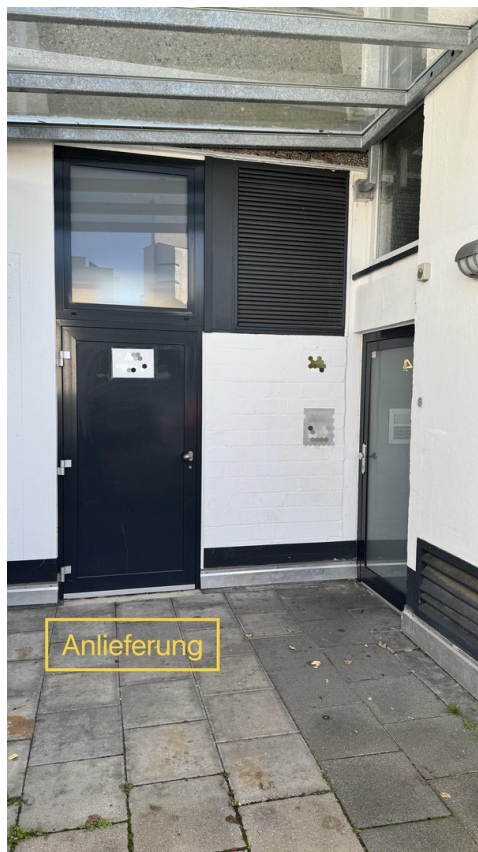
Zugang Laden / Mieter