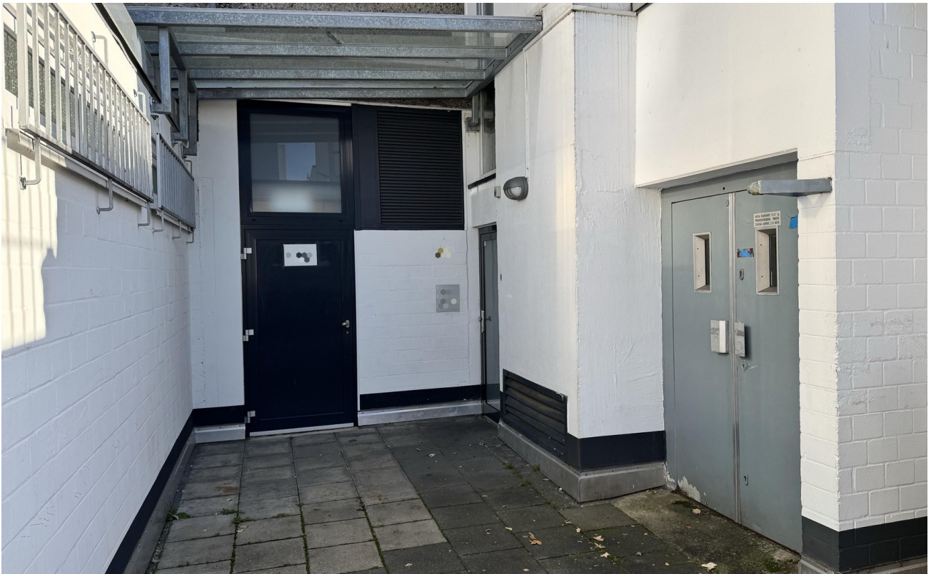
Zugang Laden / Mieter / Aufzug