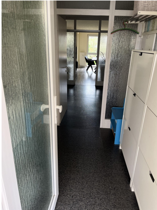
Eingang und Flurbereich