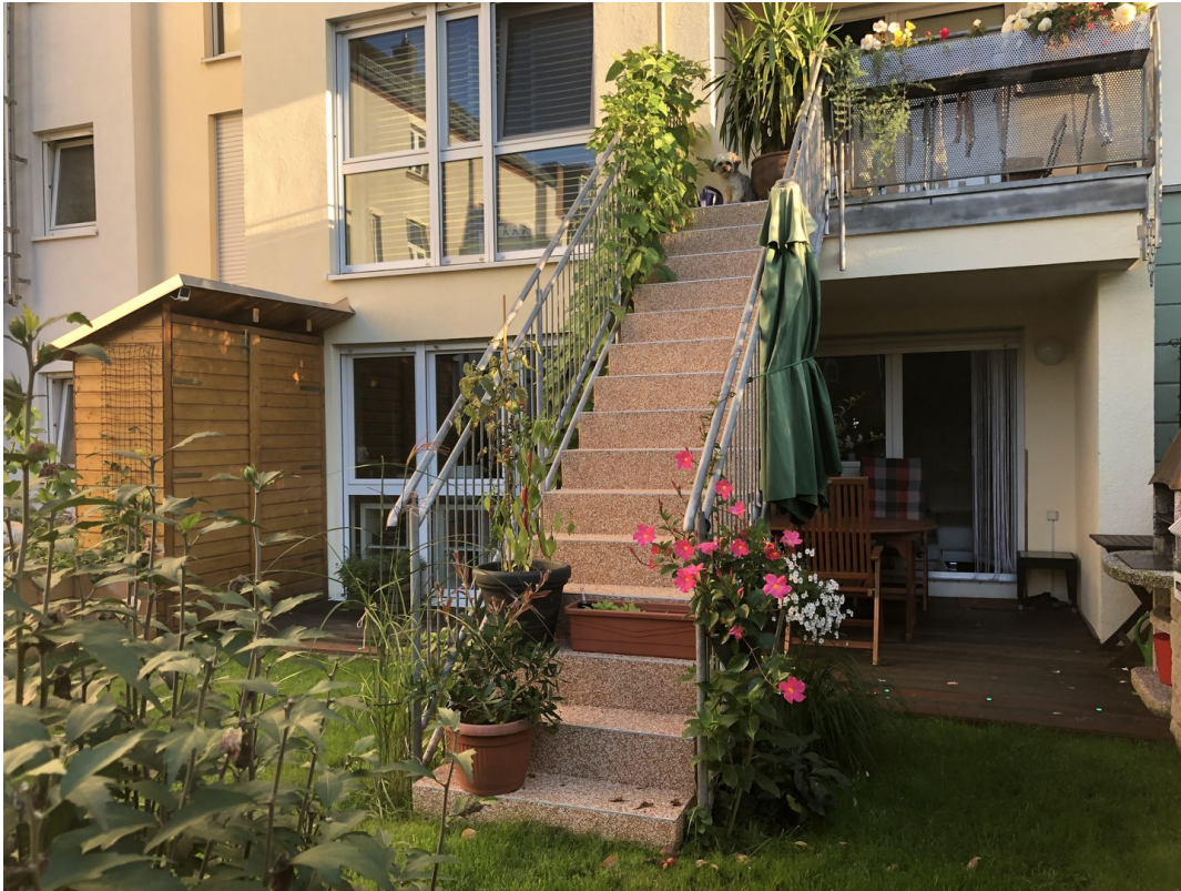
Wohnung aus Gartenblick