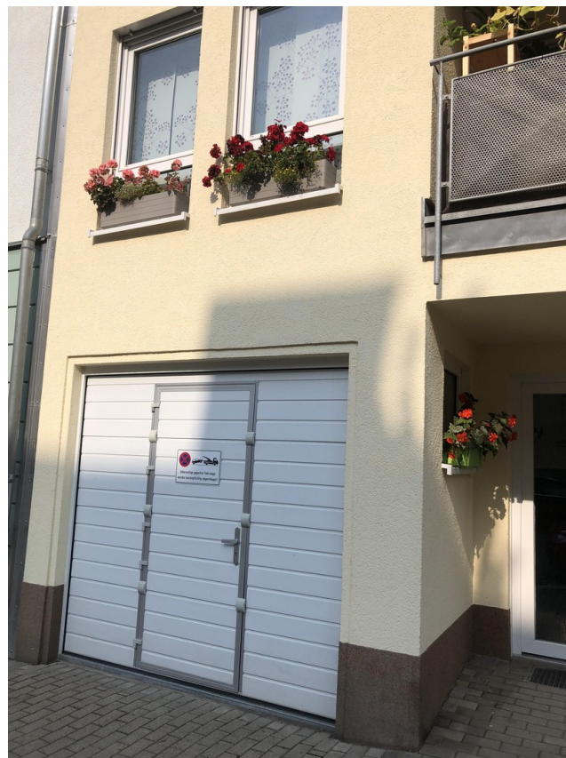
Garage, darüber Kind/Arbeiten