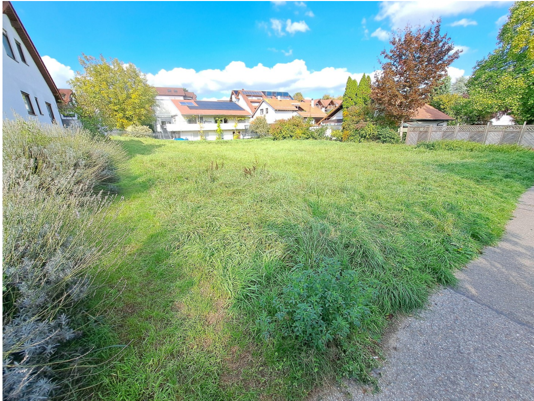
Blick von Süden