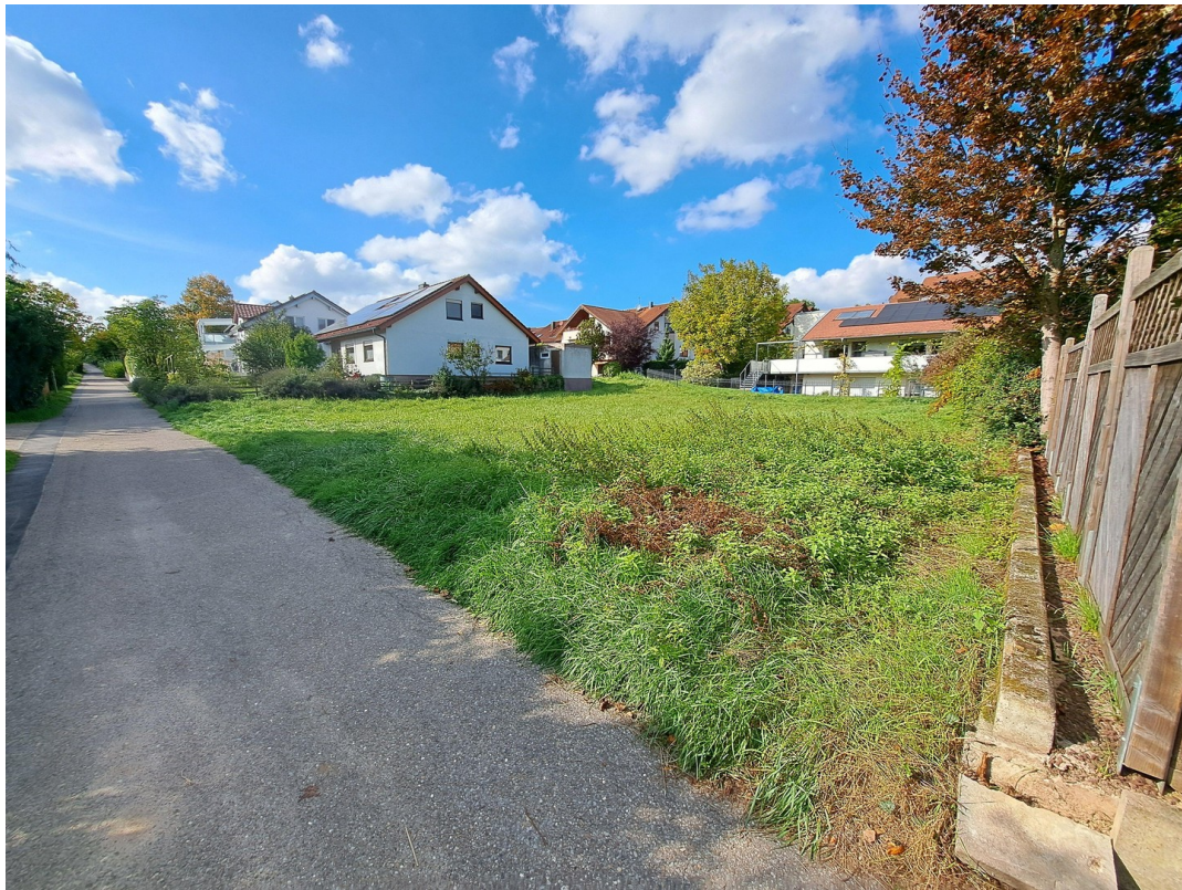
Blick vom Fußweg