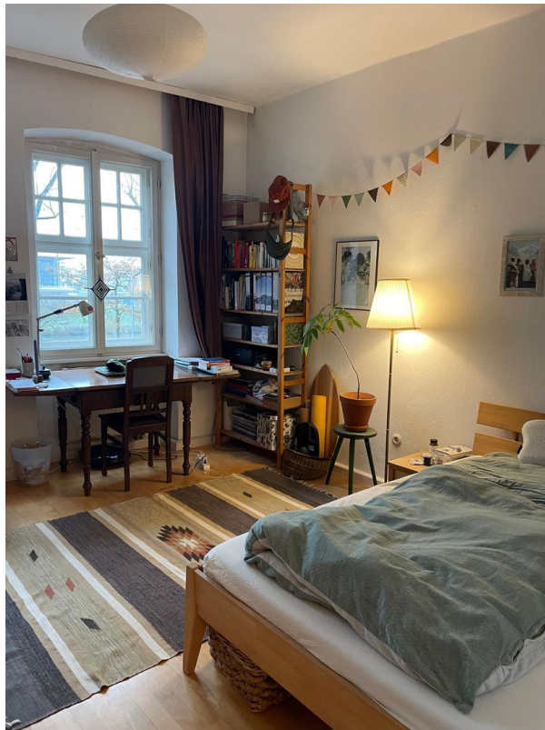
Zimmer mit Blick zum Fluss