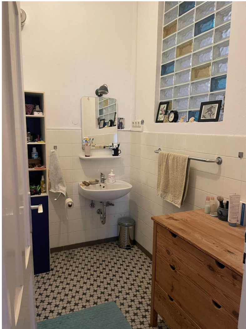
Bad (Toilette extra)