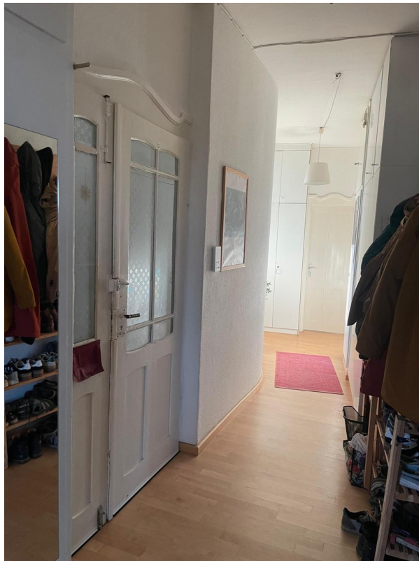
Eingang und Flur