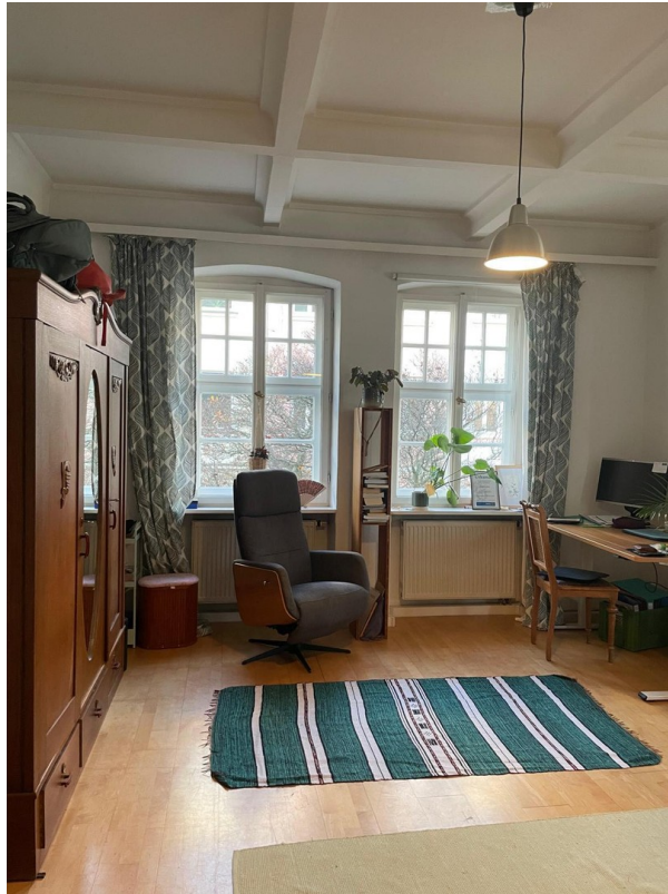
Seitenansicht des Zimmers