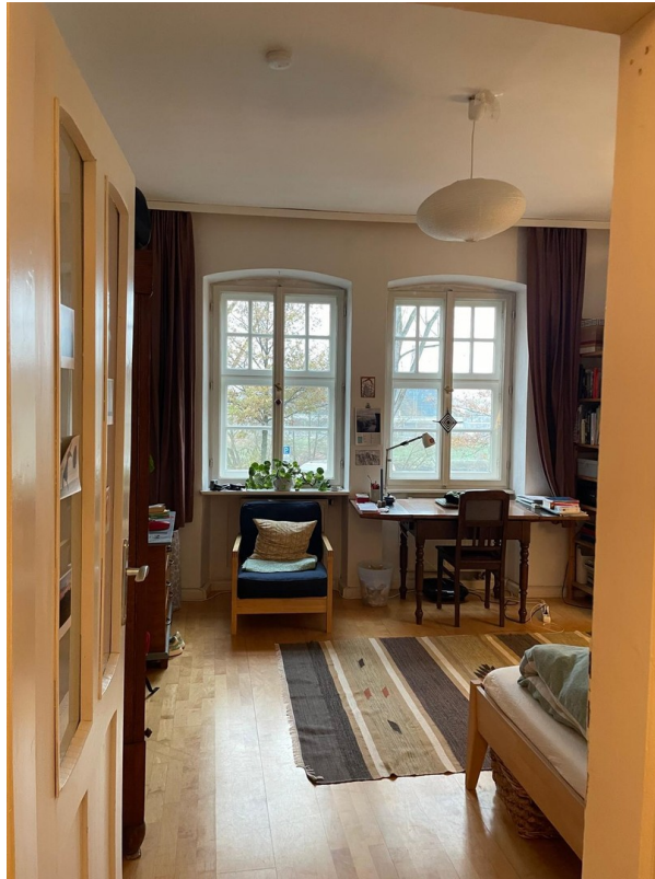
Zimmer mit Blick zum Fluss