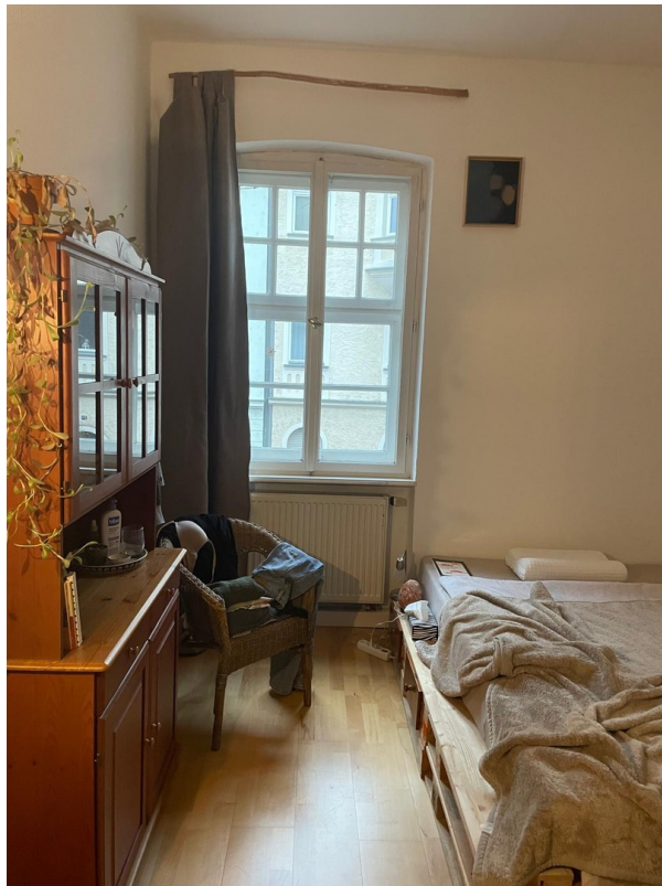
kleines Zimmer am Ende