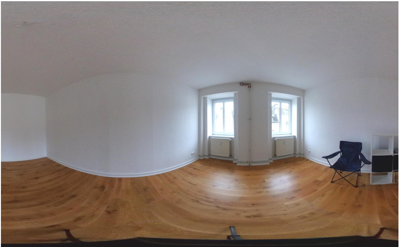
Zimmer 360 Grad