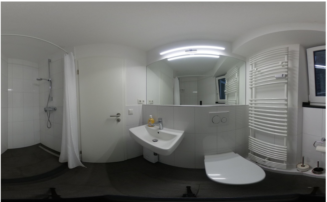
Bad 360 Grad