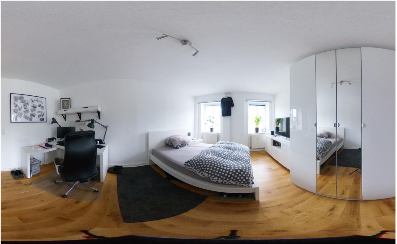
Zimmer 360 Grad