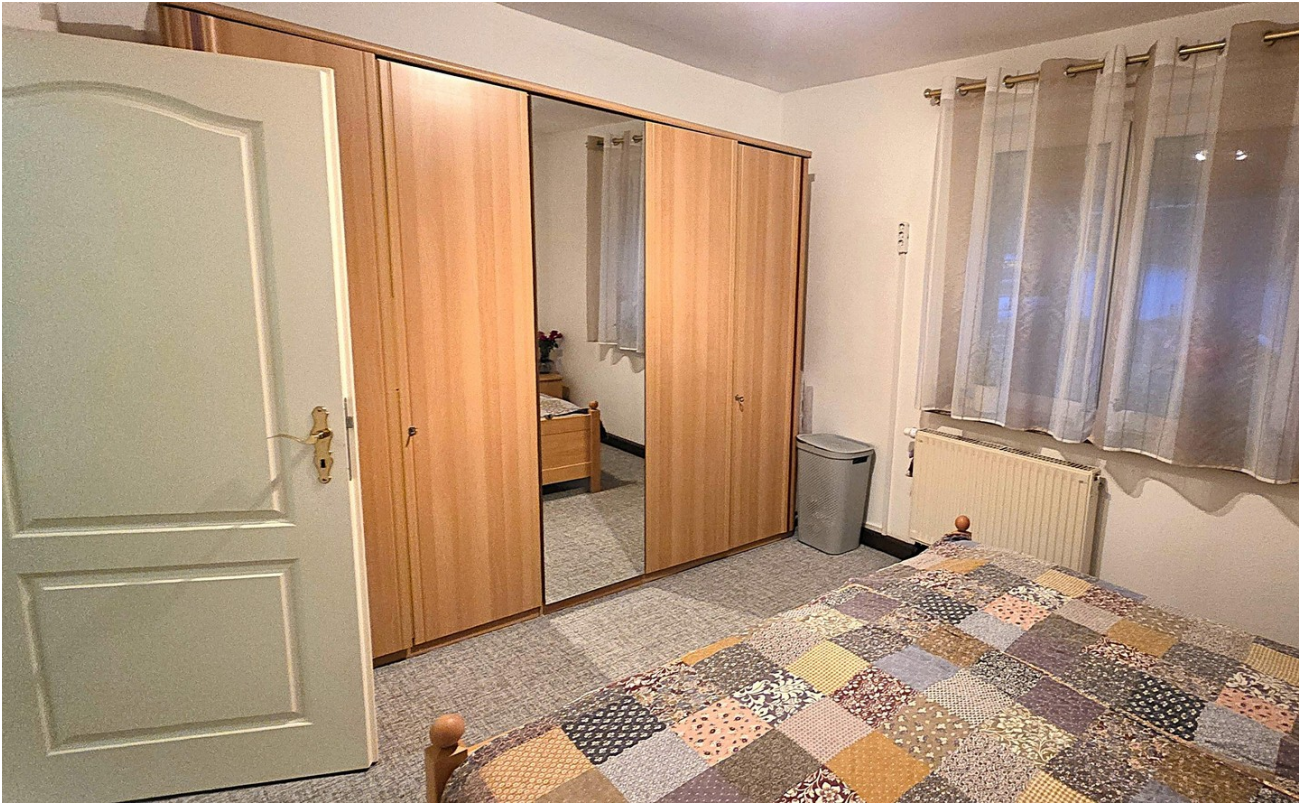
Schlafzimmer, Bild 1