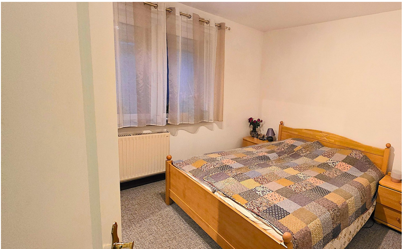
Schlafzimmer, Bild 1