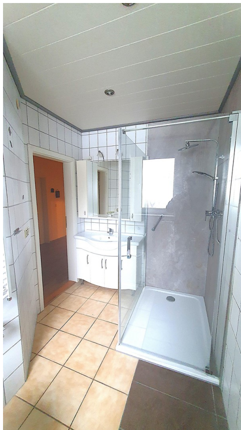
Bad, Bild 1