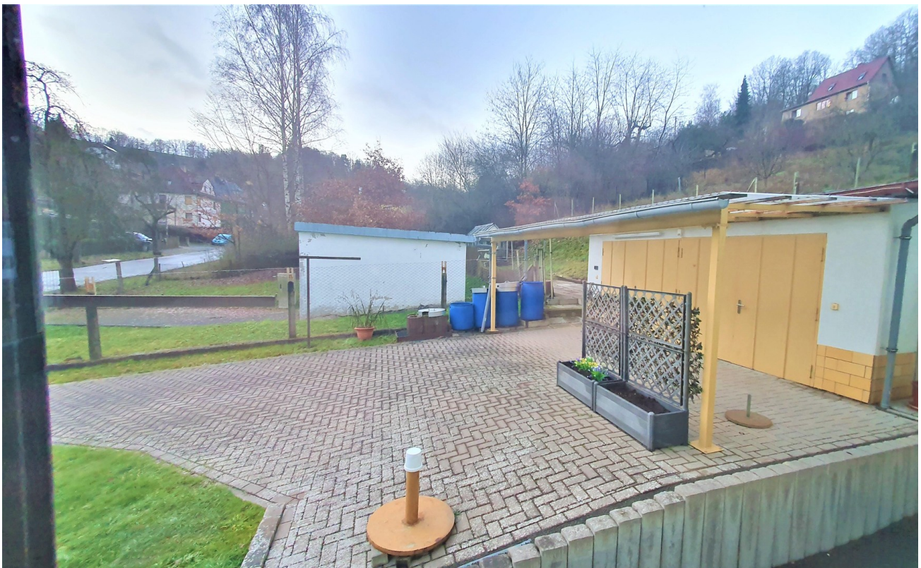
Doppelgarage und Vorplatz