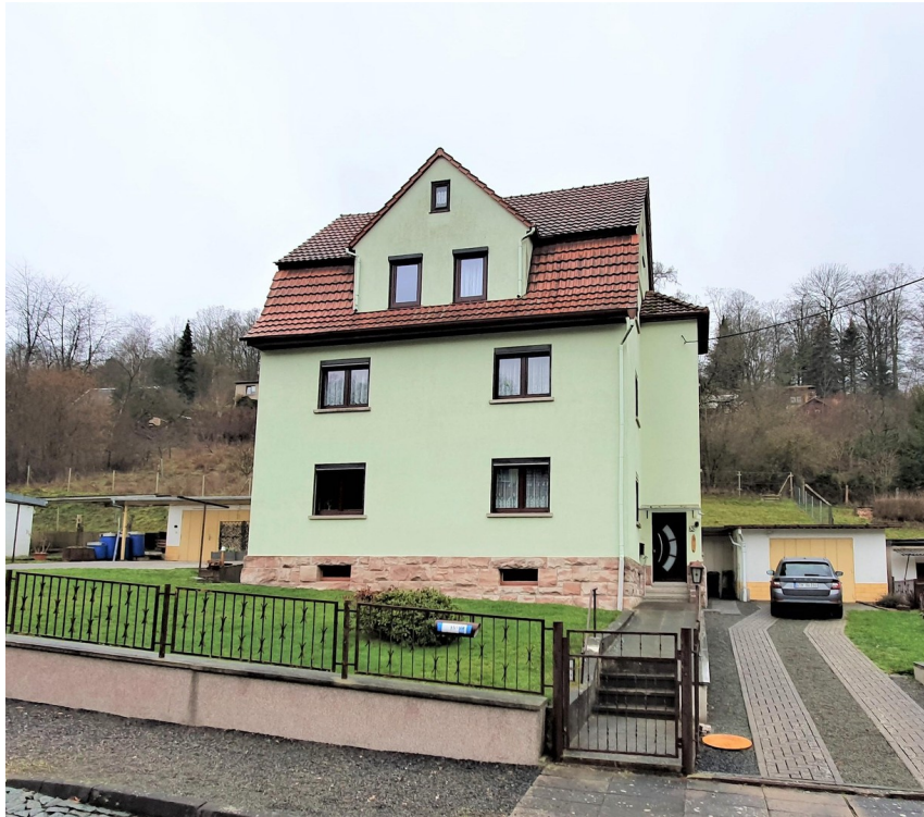
Ansicht Haus - Straßenseite