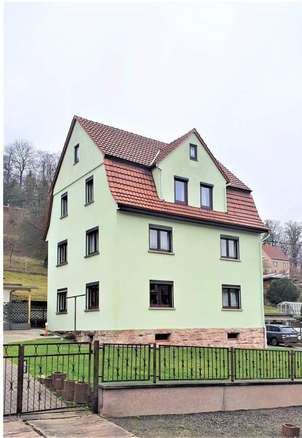
Ansicht Haus Welgerstal