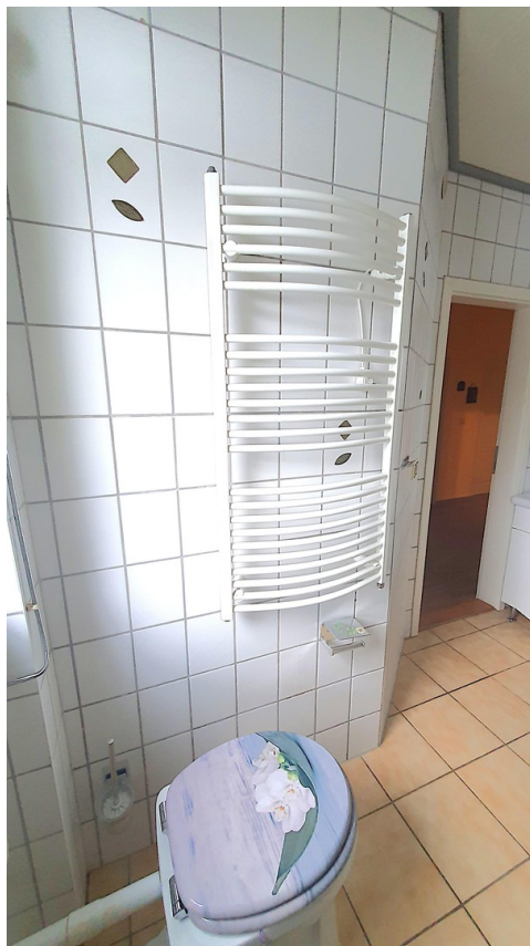
Bad, Bild 3