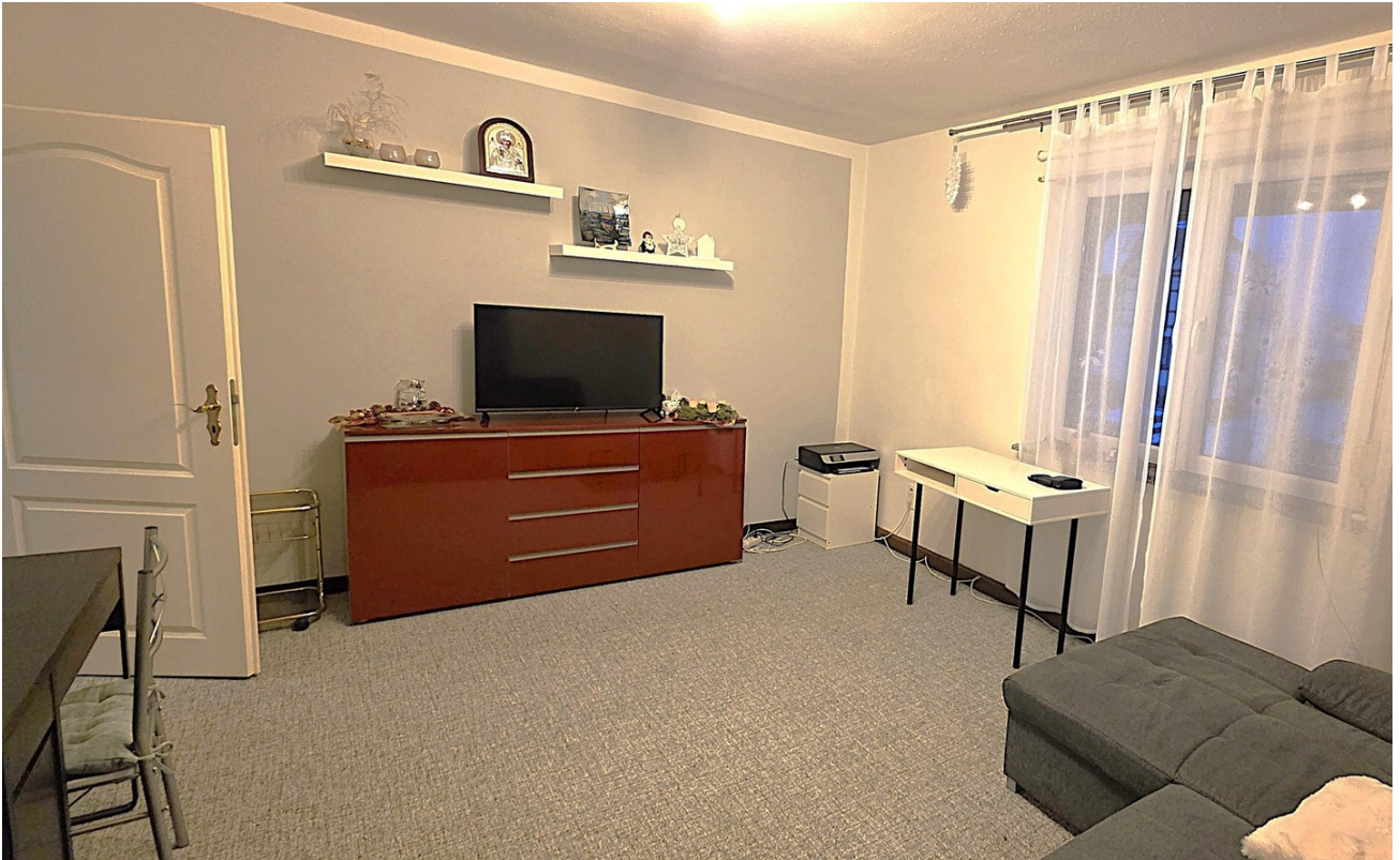
Wohnzimmer, Bild 1