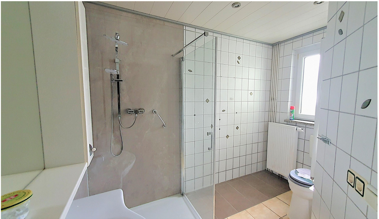
Bad, Bild 2