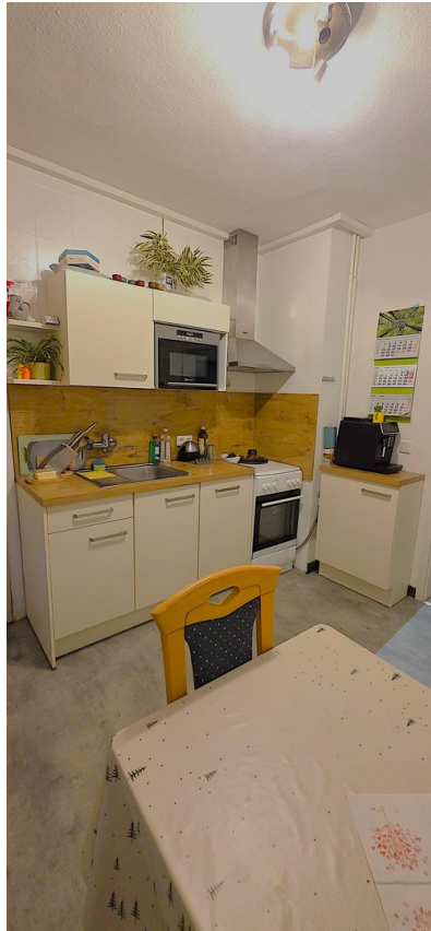
Küche, Bild 1