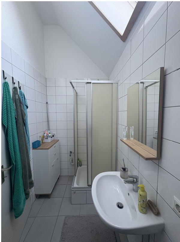
Bad obere Etage