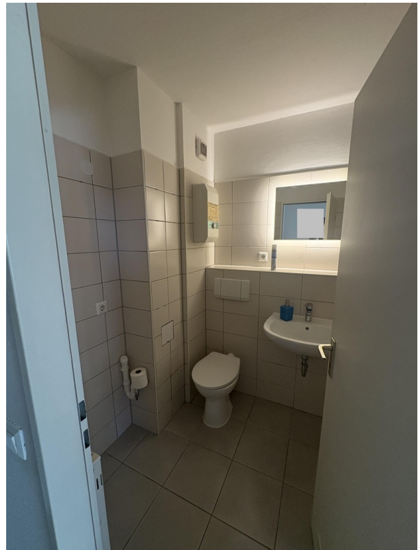
Bad unten 1