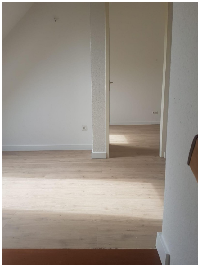
Blick Schlafzimmer von Treppe