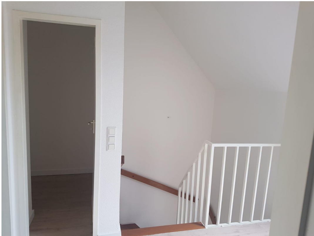
Blick von Schlafzimmer