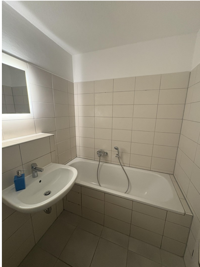
Bad unten 2