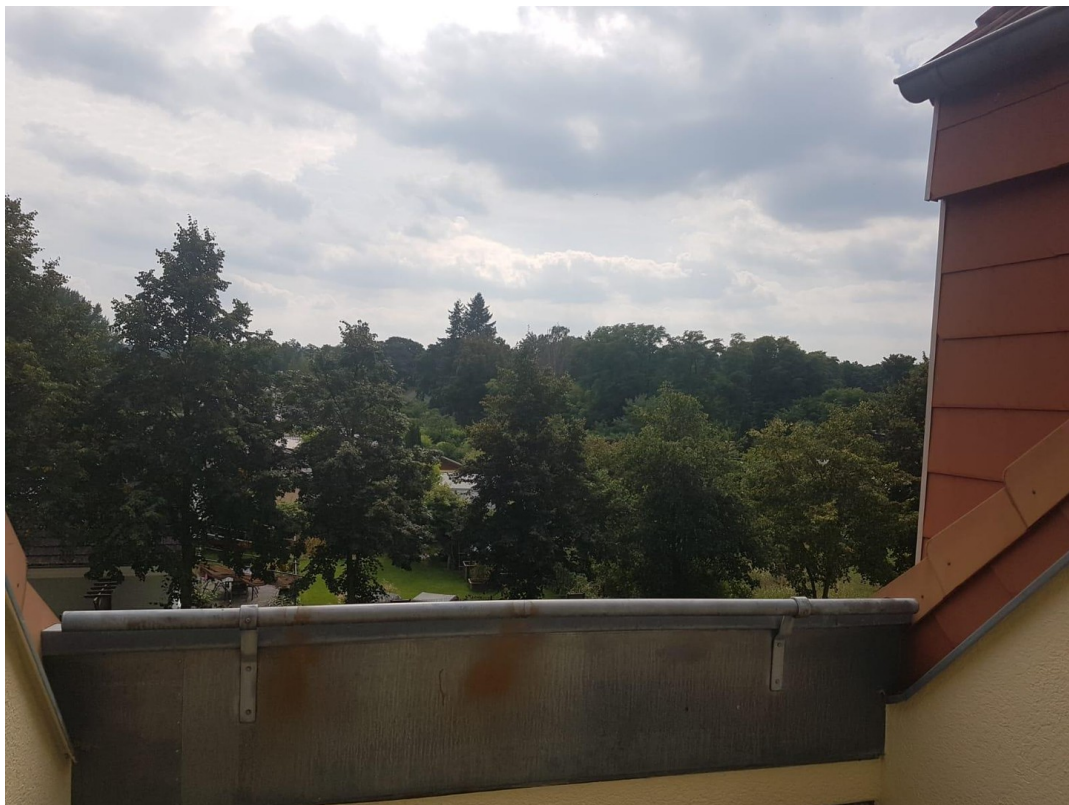
Terrasse nach Süden