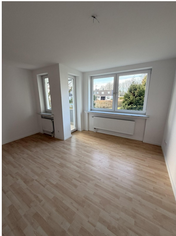
Zimmer 1, Zugang zum Balkon