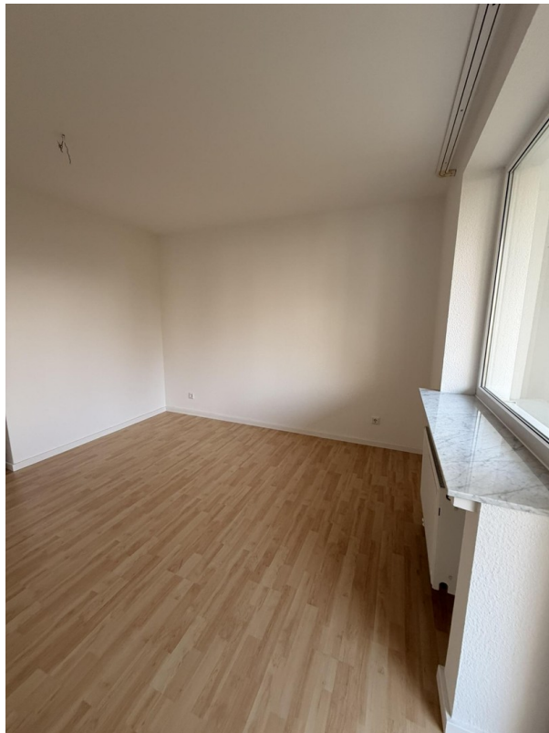
Zimmer 2, Zugang zum Balkon