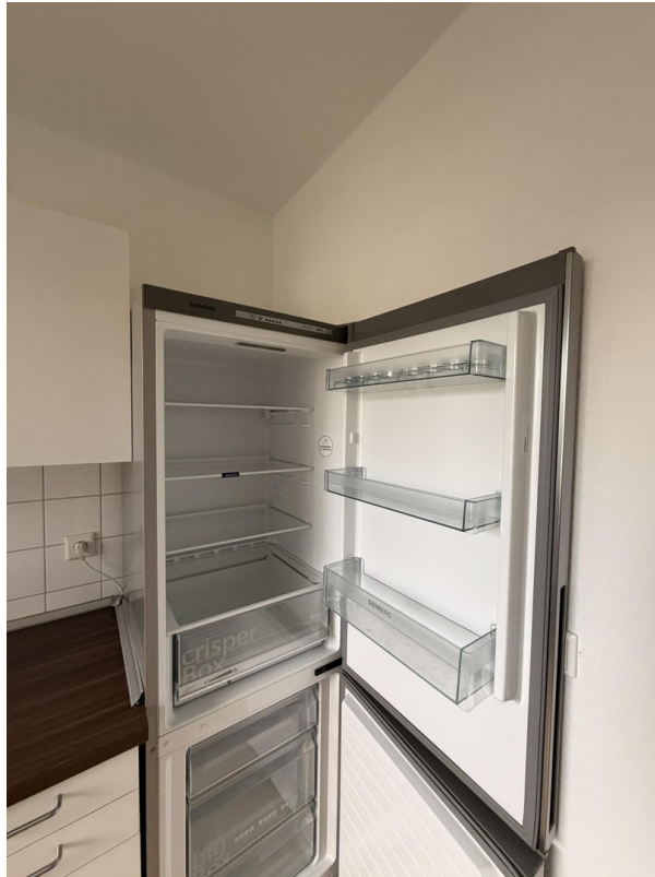
Kühlschrank + Gefrierschrank