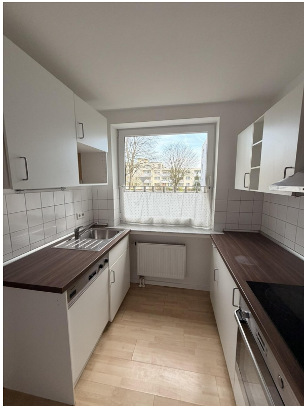
Küche mit Spülmaschine