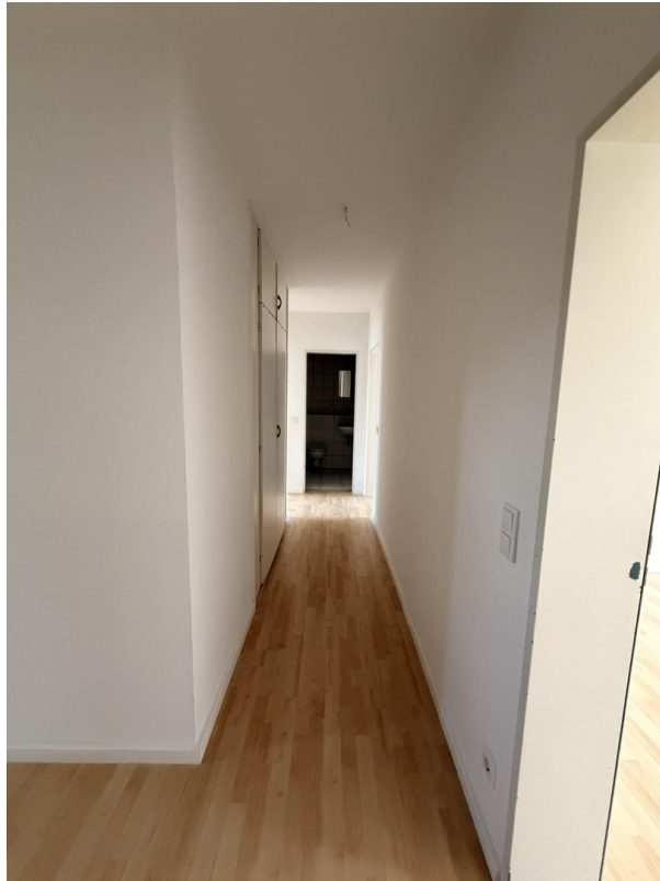
Flur mit Einbauschränk