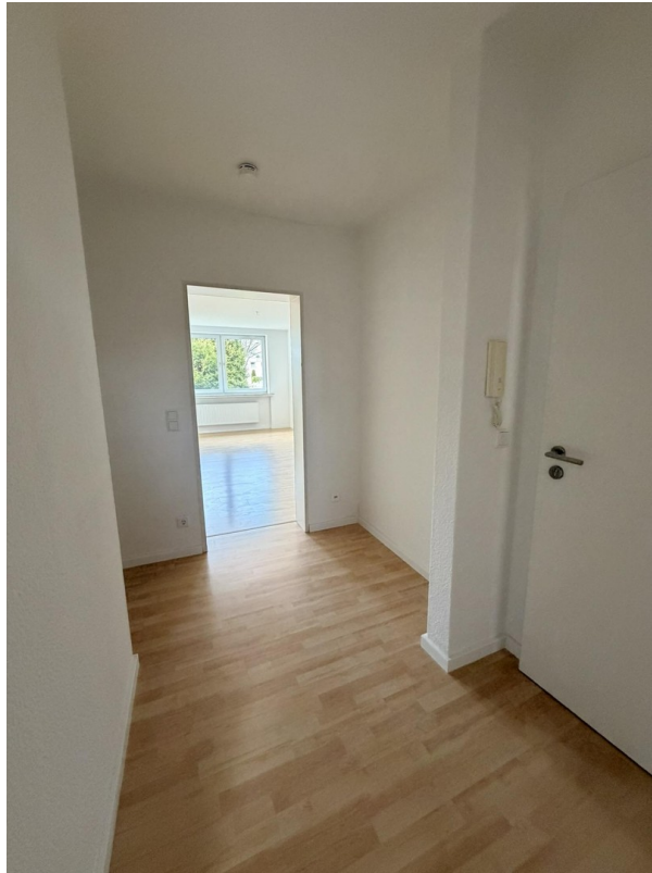
Eingangsbereich und Flur