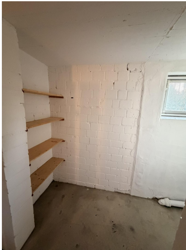
Kellerraum, frisch gestrichen