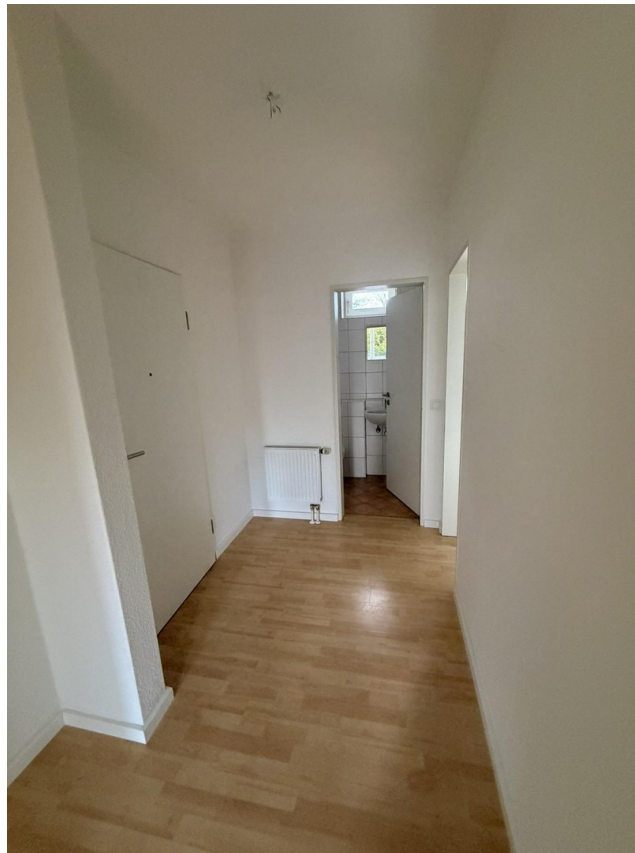
Eingangsbereich und Flur