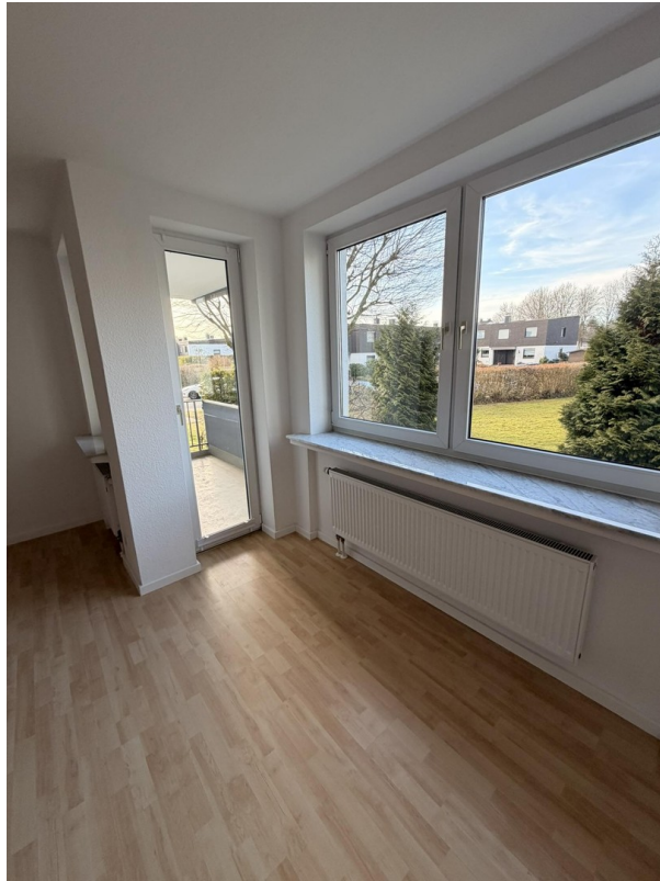
Zimmer 1, Zugang zum Balkon