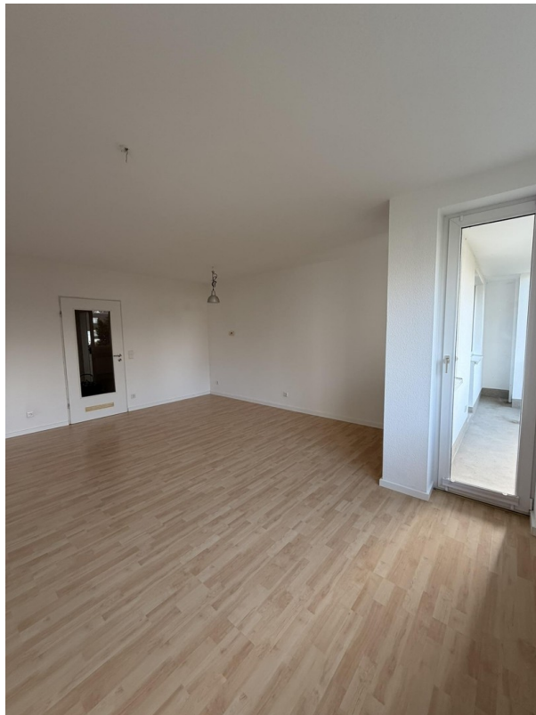
Zimmer 1, Zugang zum Balkon