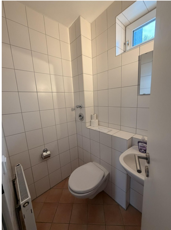
Gäste-WC mit Fenster