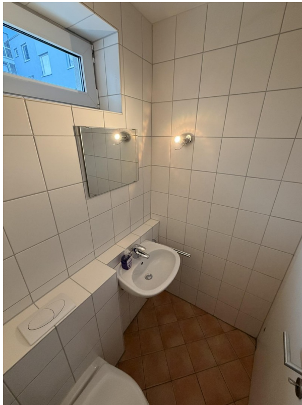
Gäste-WC mit Fenster