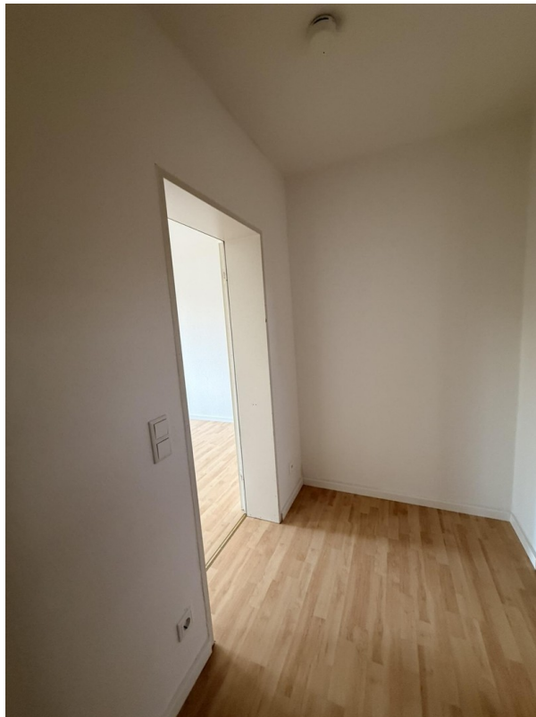
Flur, Garderobe möglich