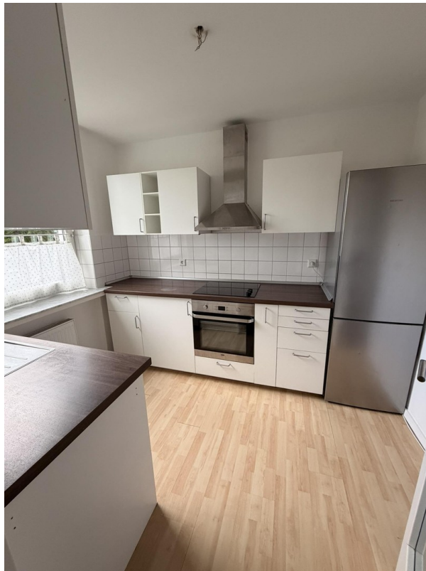
Küche Kühlschrank + Backofen