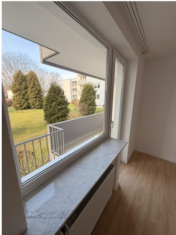
Zimmer 2, Zugang zum Balkon