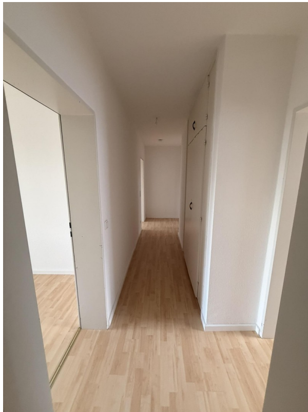
Flur mit Einbauschränk