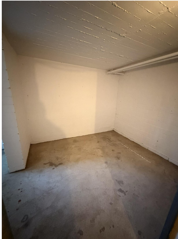
Kellerraum, frisch gestrichen