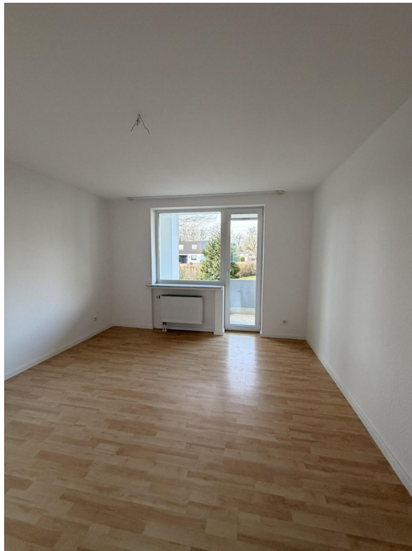
Zimmer 2, Zugang zum Balkon