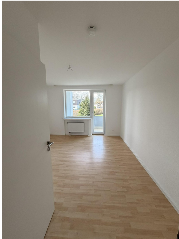
Zimmer 2, Zugang zum Balkon