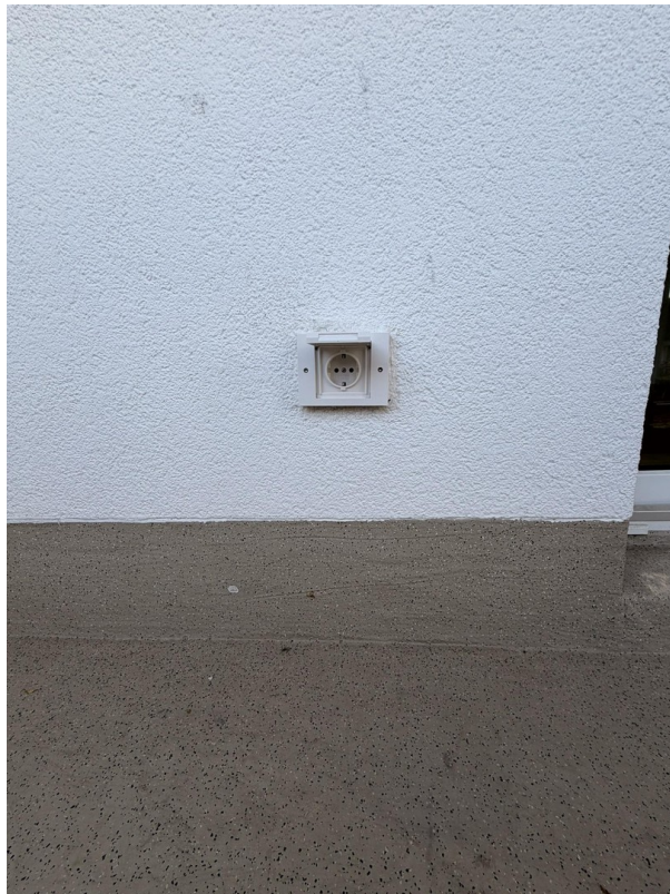
Balkon, neue Steckdosen