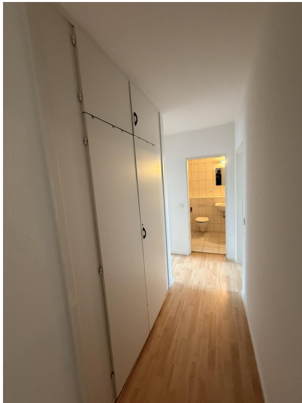
Flur mit Einbauschränk