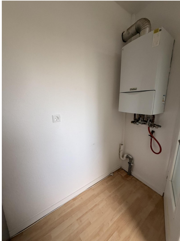
Küche, Platz für Waschmaschine