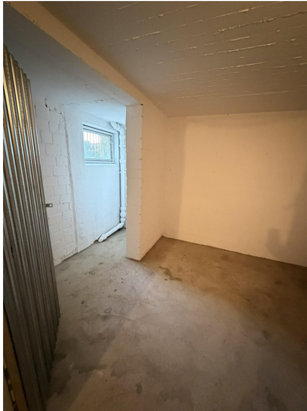
Kellerraum, frisch gestrichen