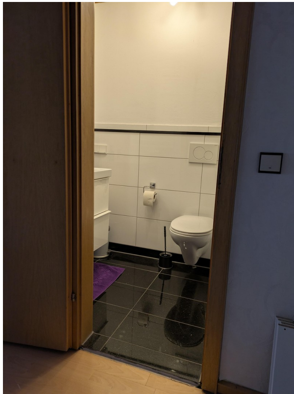
Duschbad mit Toilette im 2. OG