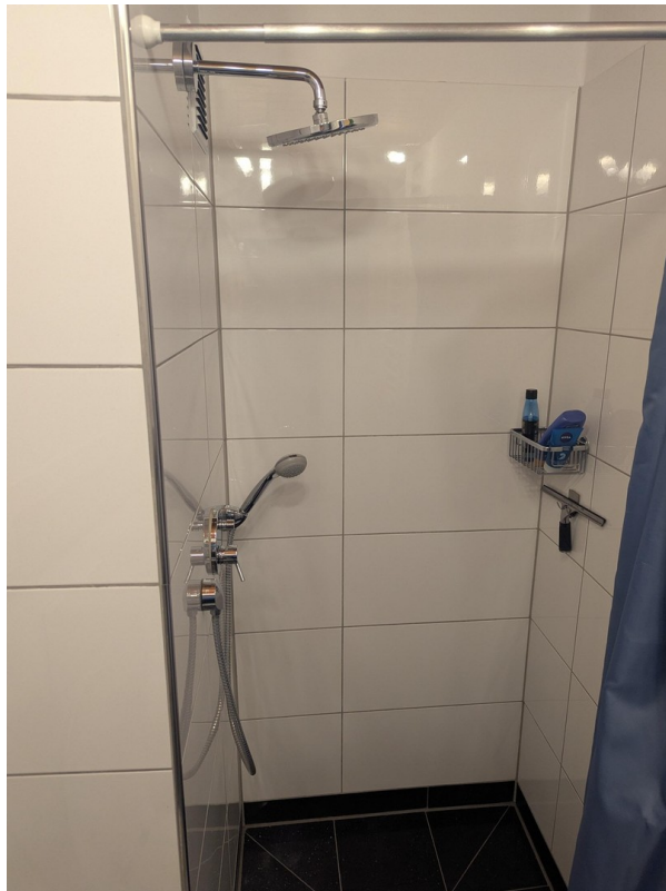
Duschbad mit Toilette im 2. OG