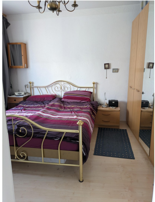
Schlafzimmer im EG