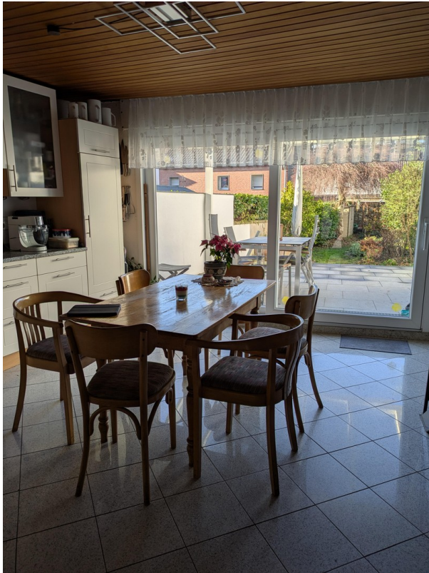
Küche & Terrasse