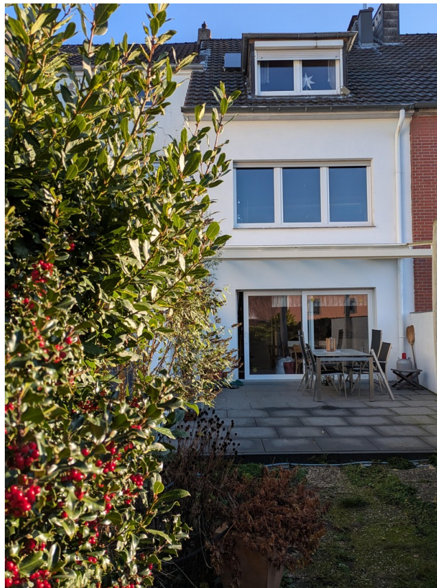
Hausansicht vom Garten