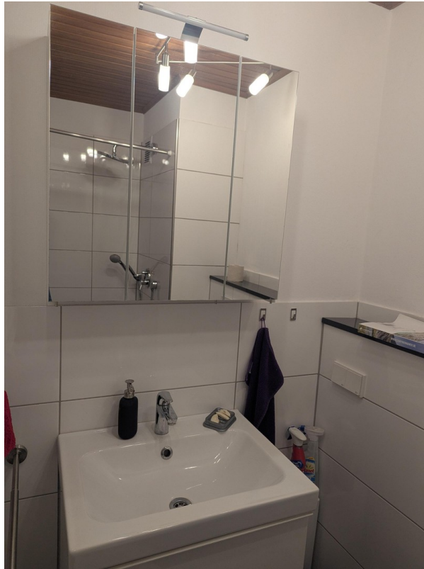
Duschbad mit Toilette im 2. OG