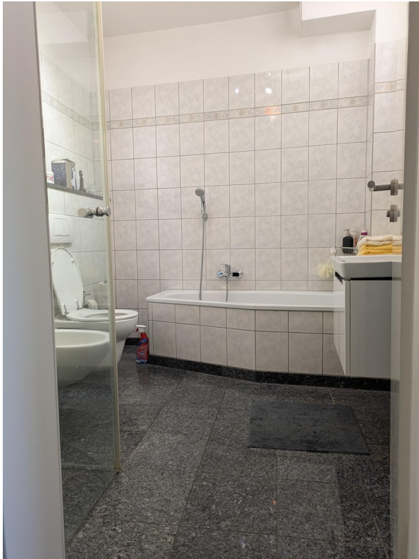
Bad mit Dusche und Wanne