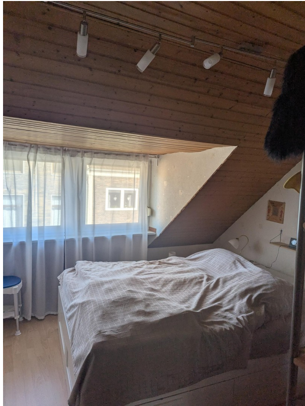
Schlafbereich im 2. OG