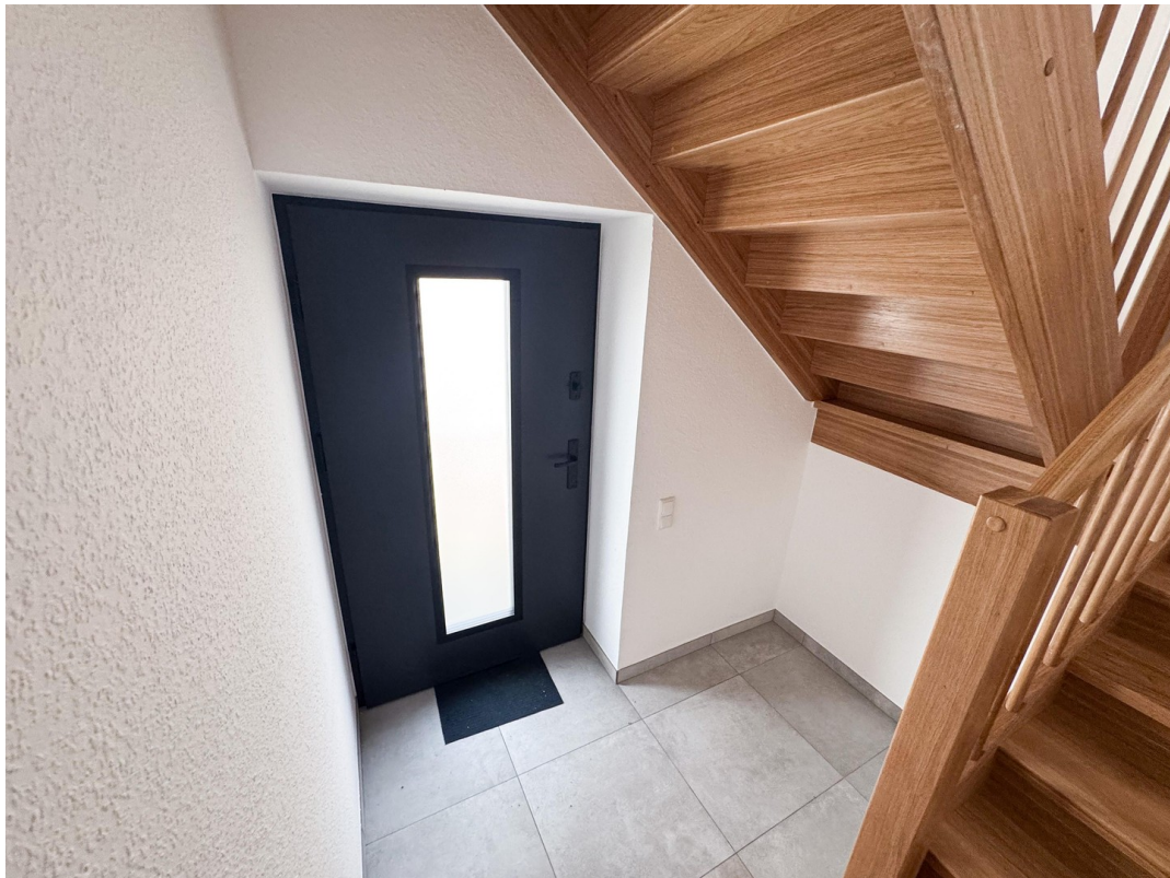
Treppenhaus mit Stellfläche