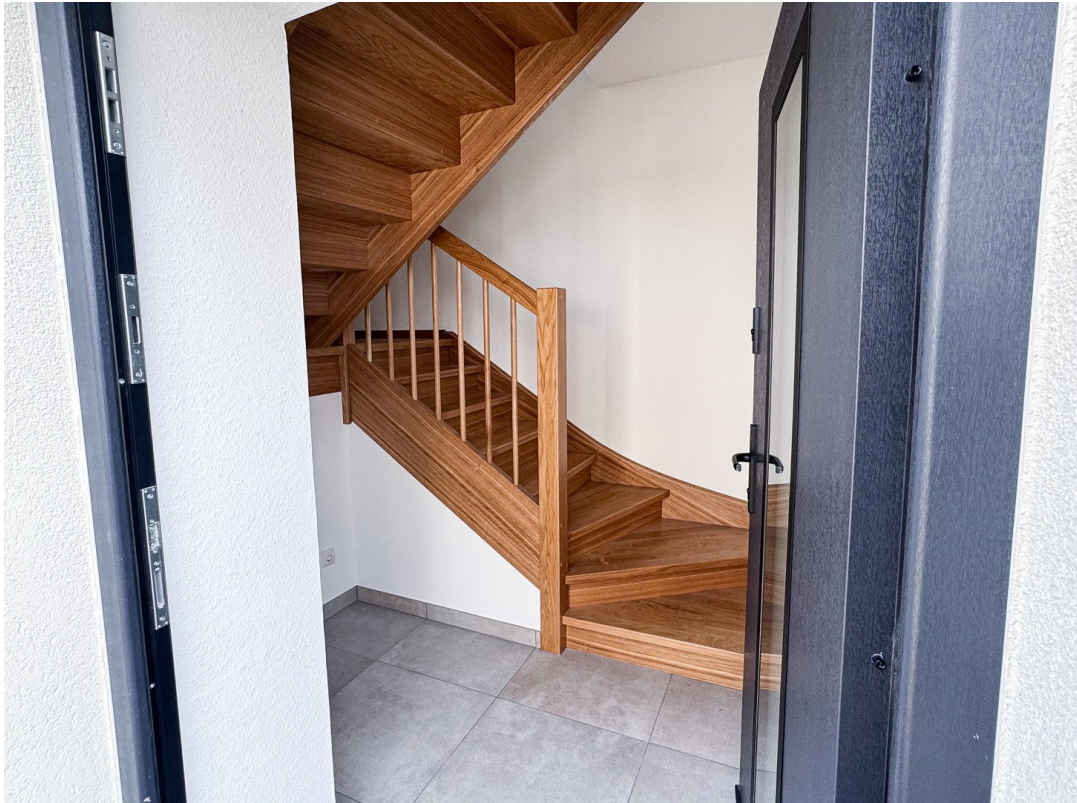
Eingang eigenes Treppenhaus