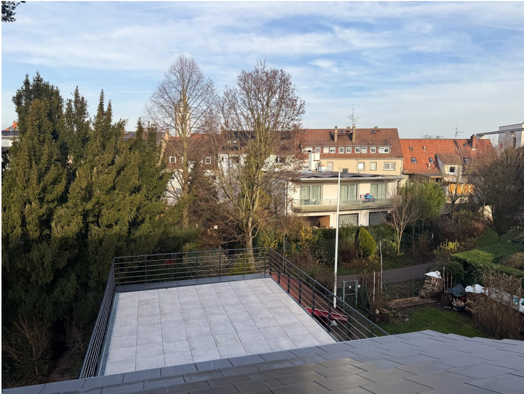
Blick vom Dachgeschoss