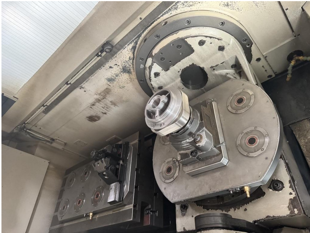
CNC 3/5-Achs Fräse 1