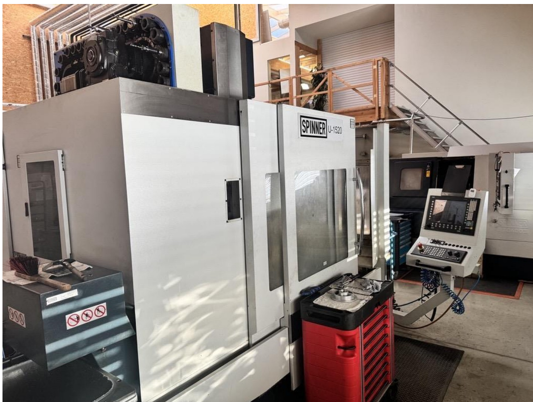
CNC 3/5-Achs Fräse 1