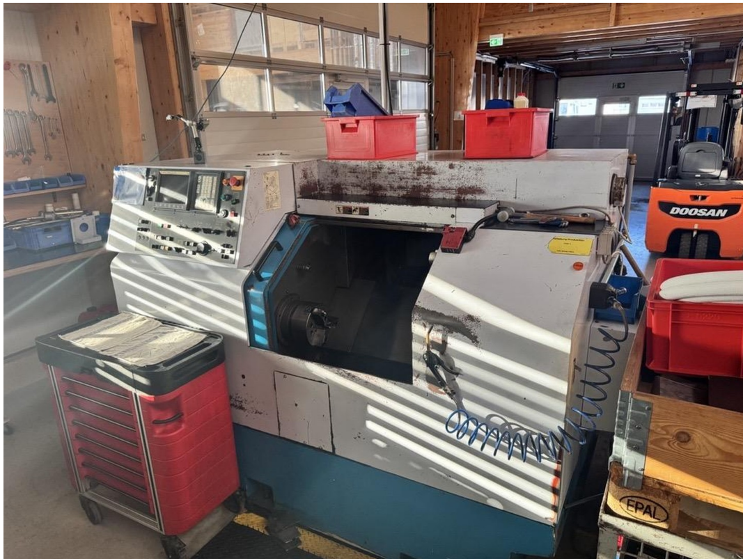
CNC drehen 1