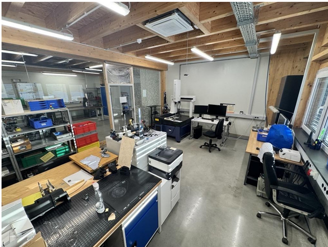
Messraum (optional nutzbar)