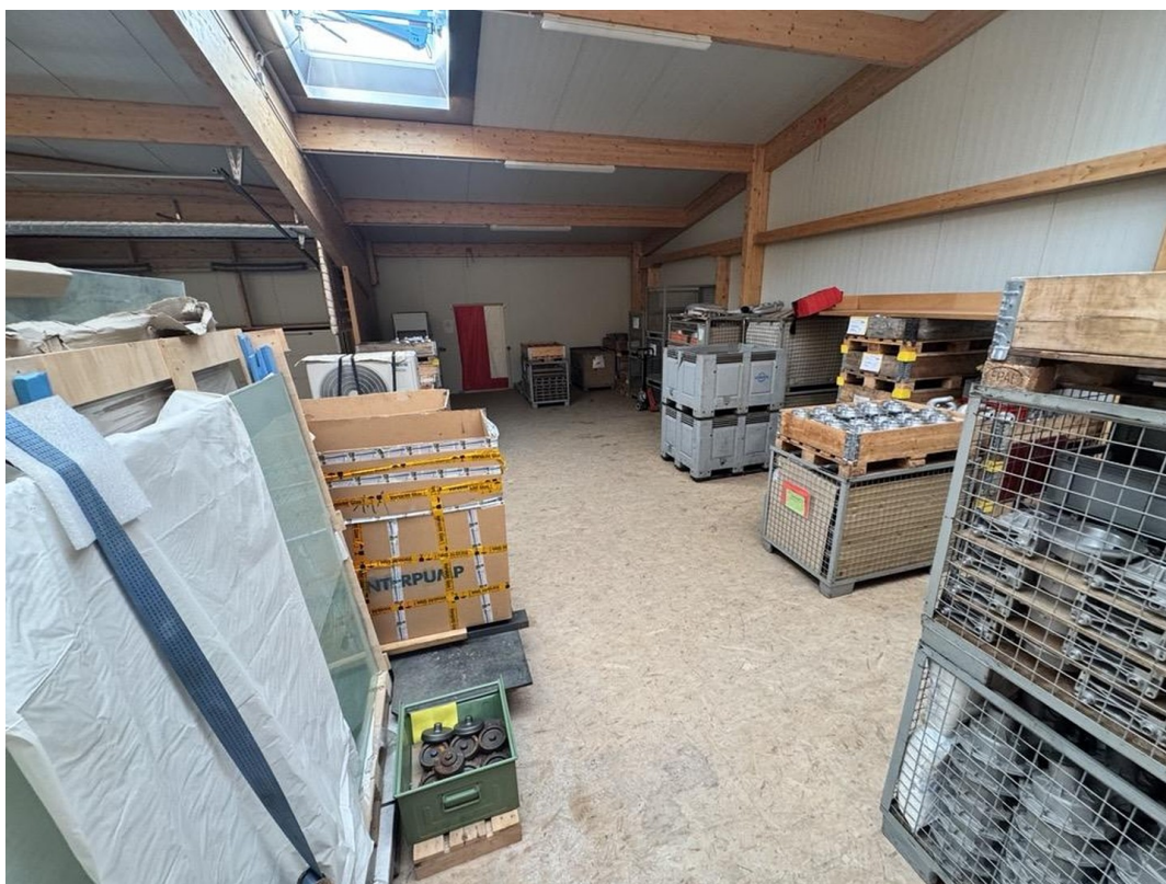
Lager OG 1