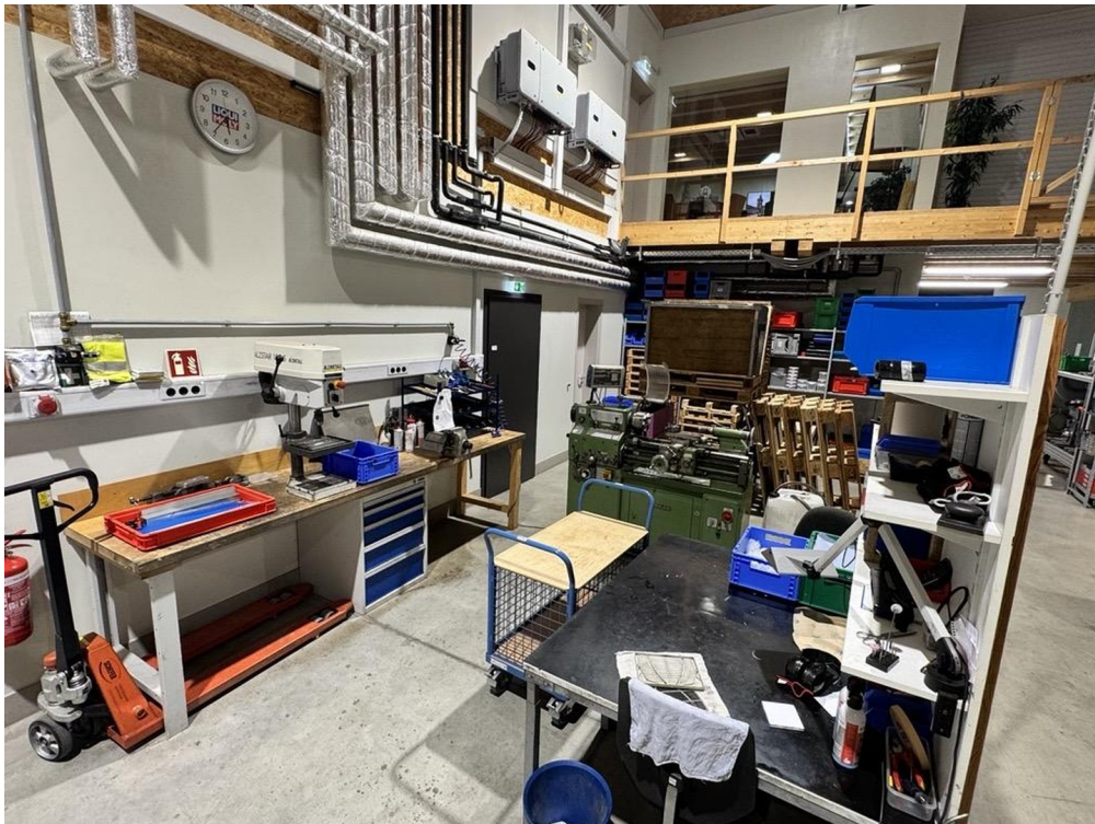
Konventionelle Fertigung, Entg