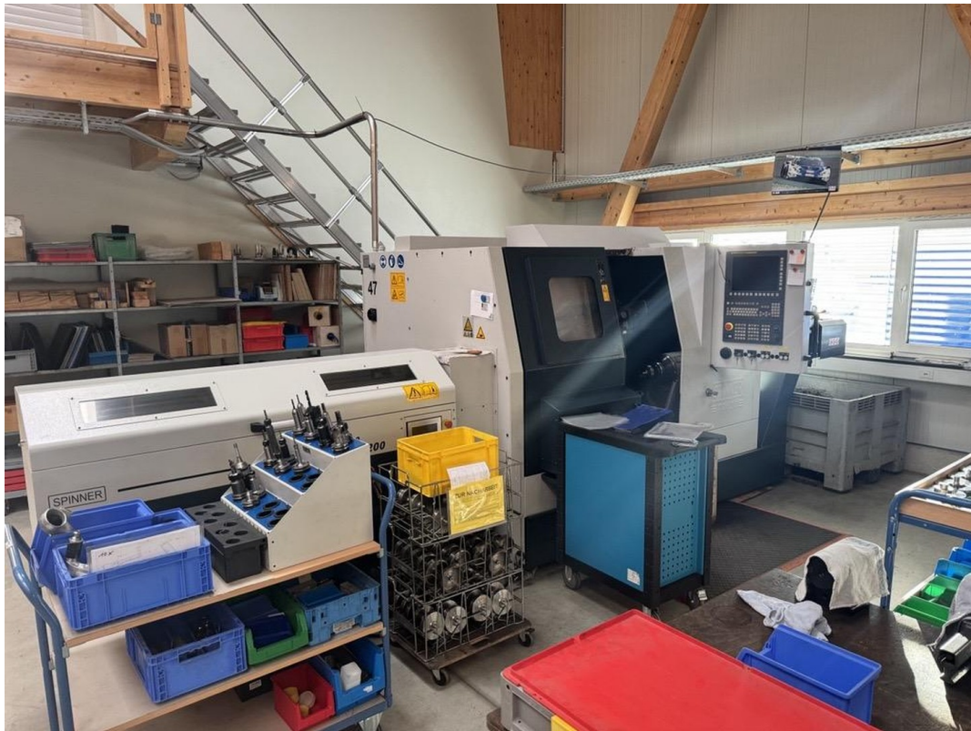
CNC drehen 2 Stangenzuführer