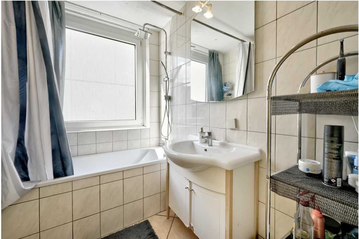
Bad mit Badewanne