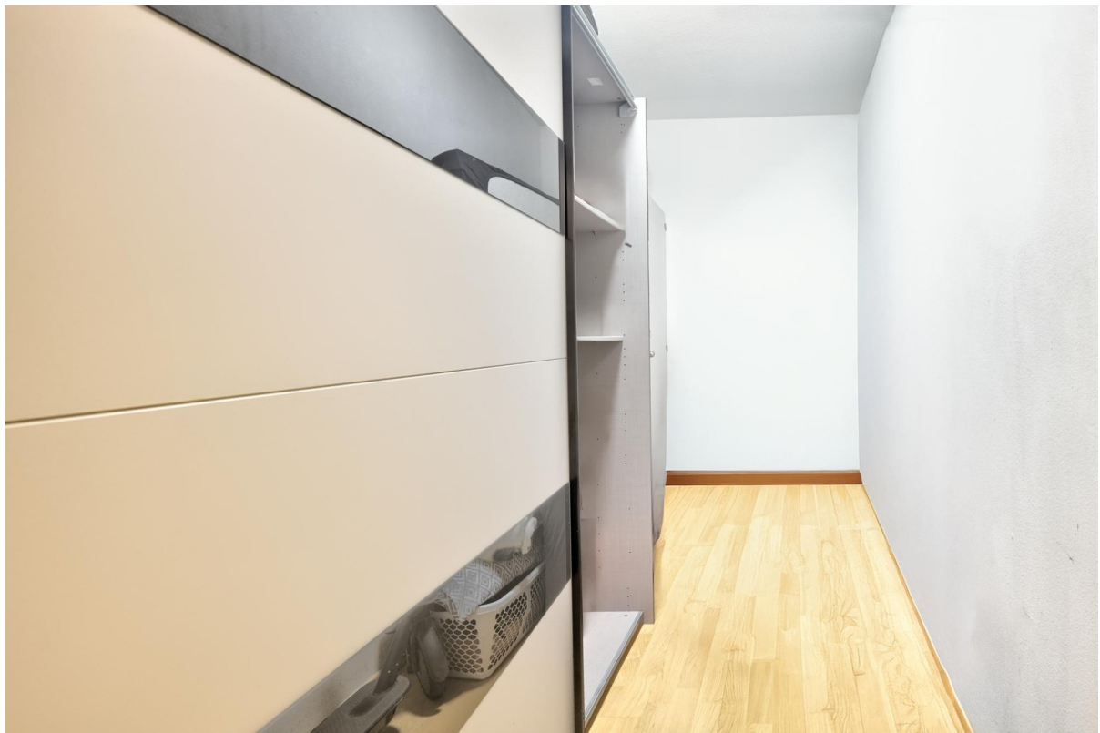
Abstellraum in der Wohnung