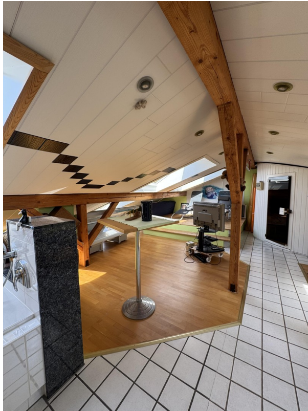
Spa- Bereich / Sauna