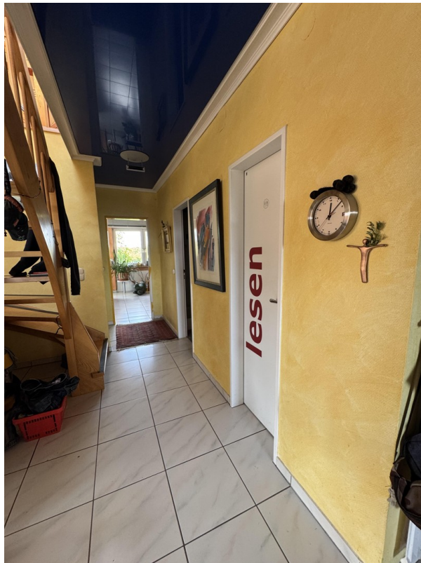
Flur mit Treppe