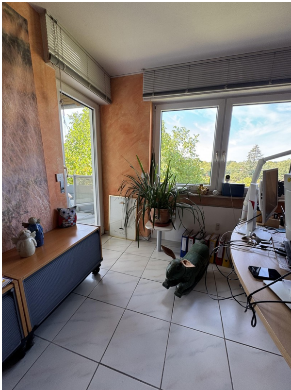
Arbeitszimmer mit Balkon