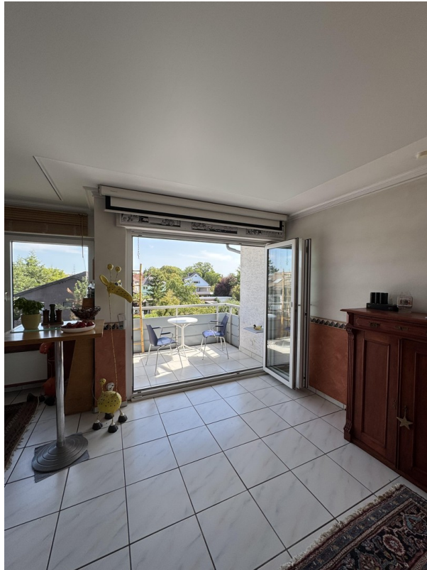
Balkon nach Osten