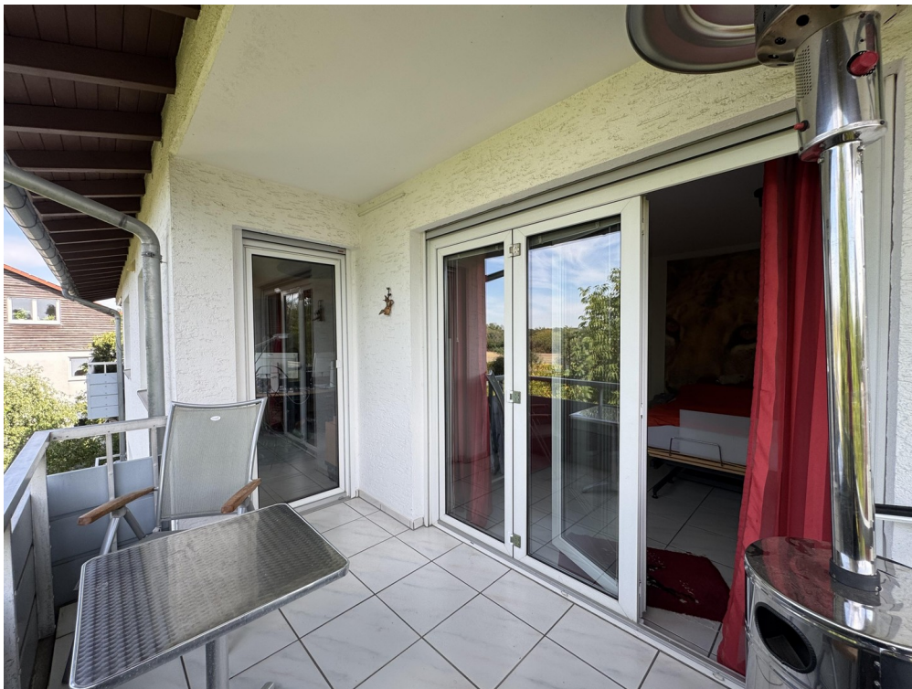
Balkon nach Westen