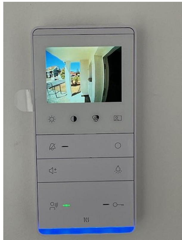
Sprechanlage mit Kamera