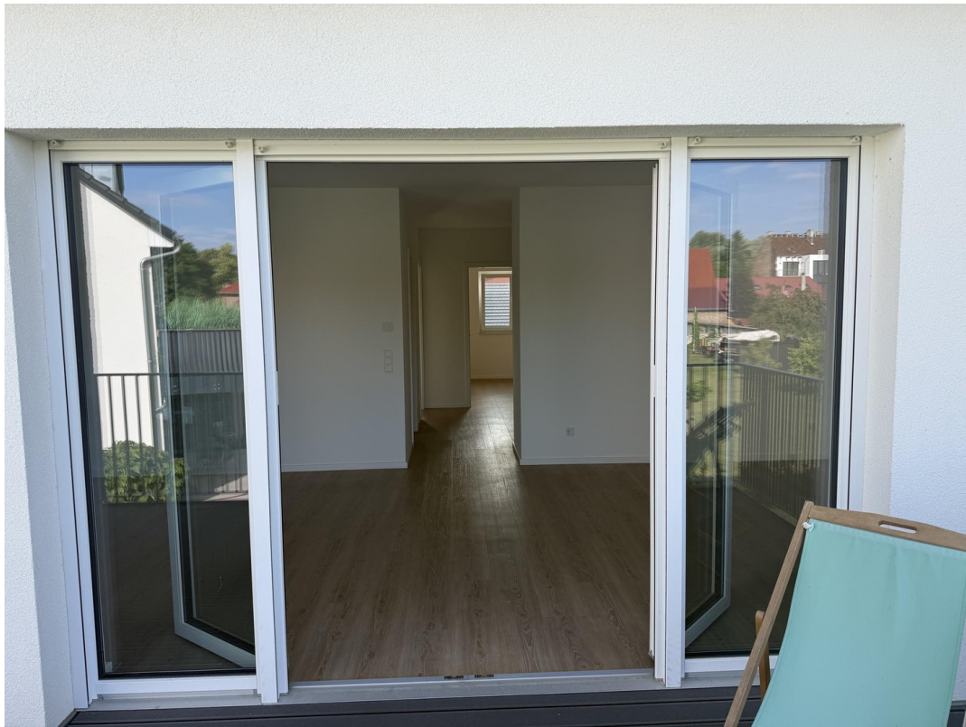
Eingang ins Wohnzimmer