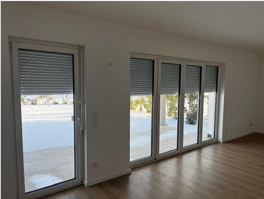
Elektr Jalousien im ganz. Haus