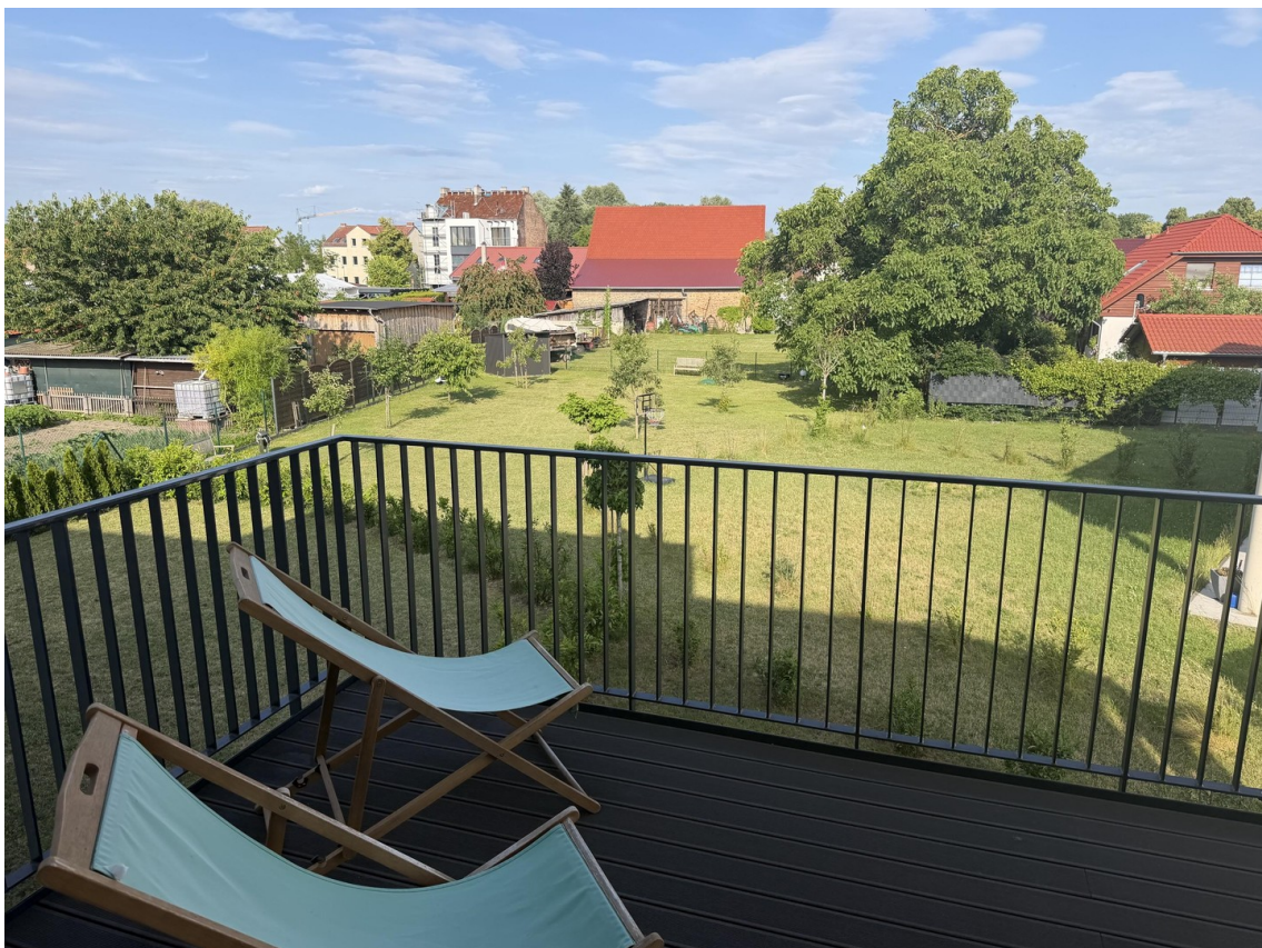
Aussicht von Terrasse