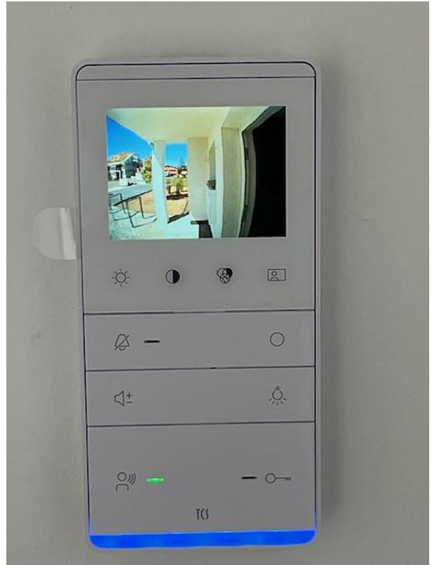
Sprechanlage mit Kamera