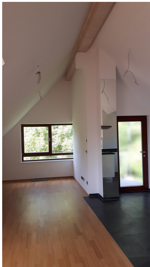
Wohnzimmer und Eingang