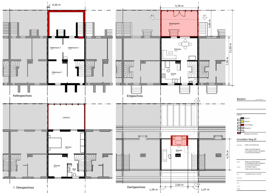
AW 20, Grundrisse KG bis DG