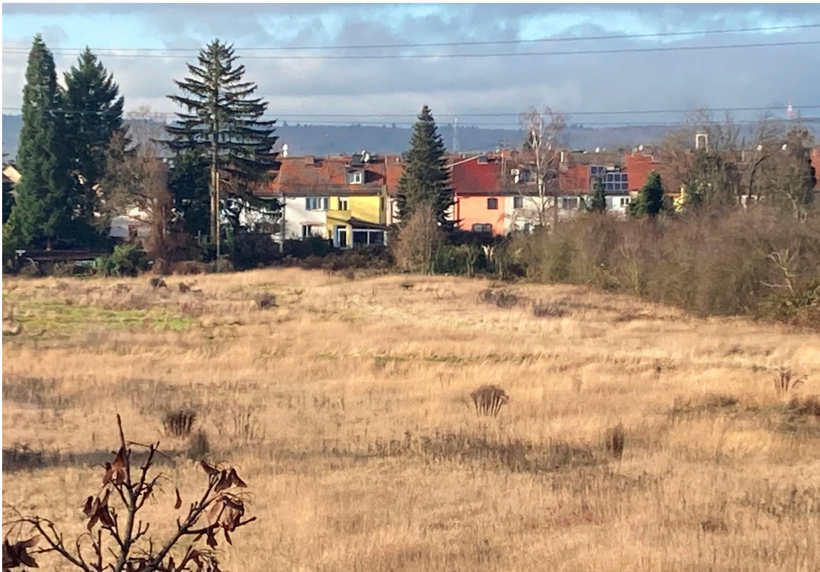
Blick von der S-Bahn zum AW