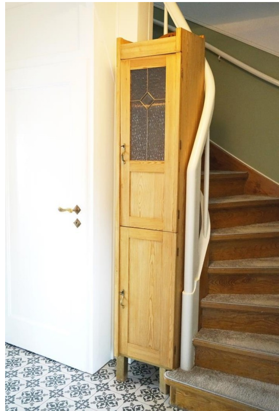
Treppenaufgang zum OG