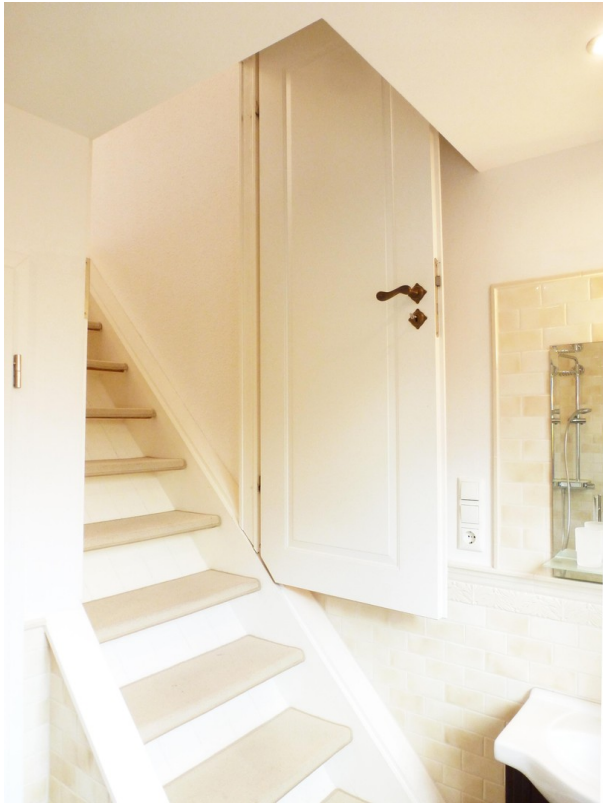
Treppe zum DG