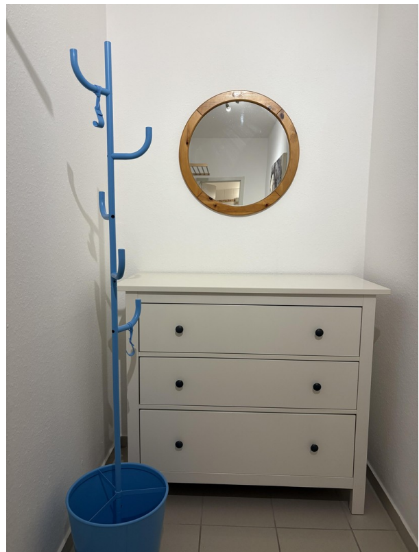
Flur / corridor 1