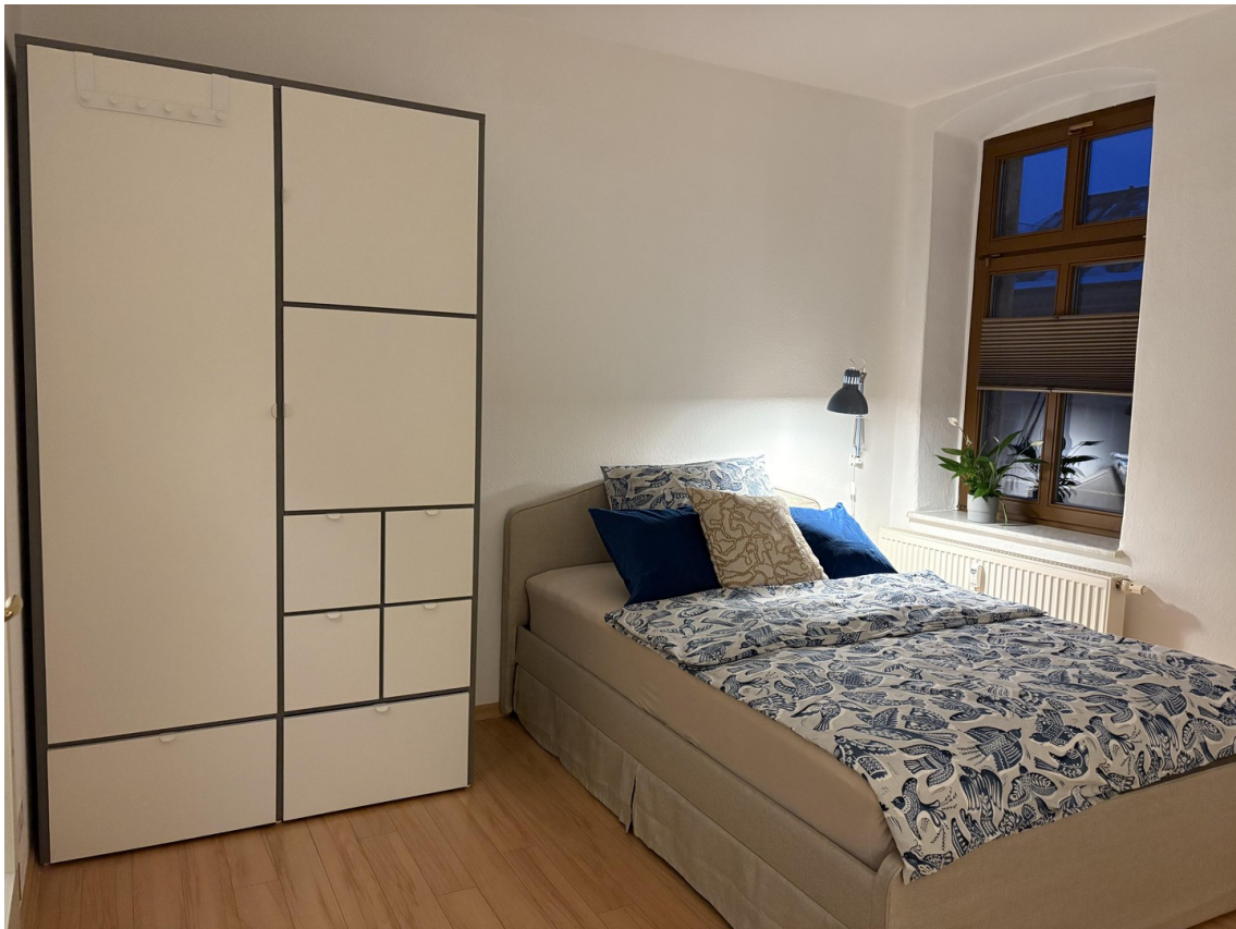
Schlafbereich / sleeping