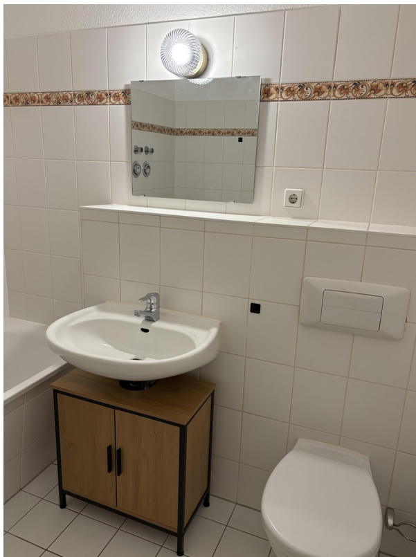
Bad / bathroom