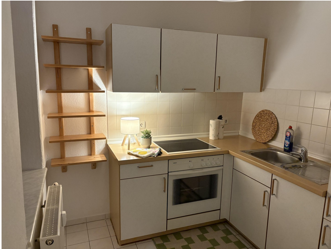
Küche / kitchen