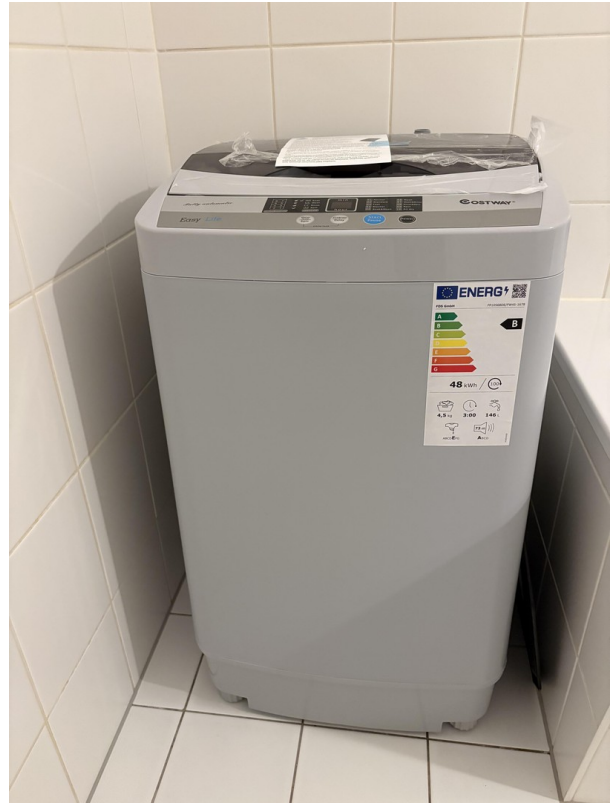
Waschmaschine/ Washing machine