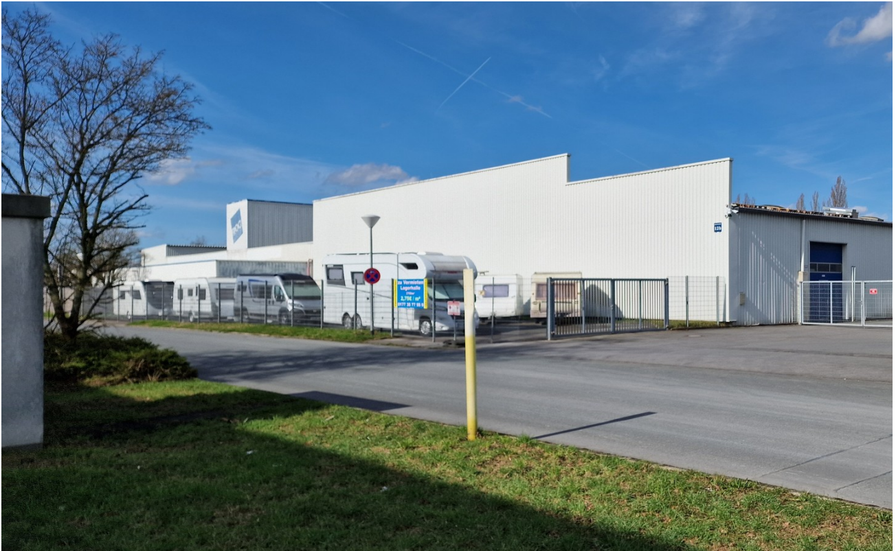
Halle B 2800 qm Seitenansicht