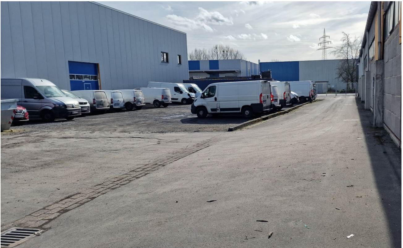
Halle B hintere Zufahrt 1