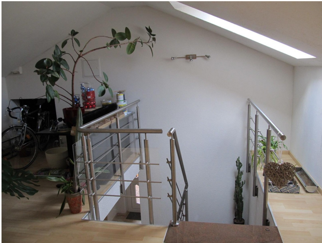
Flur / Vorraum OG