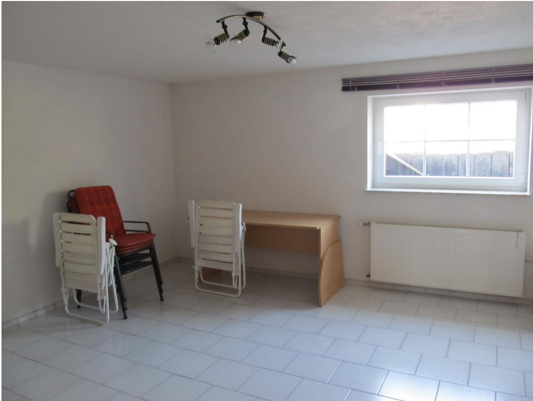
Zimmer 2 KG