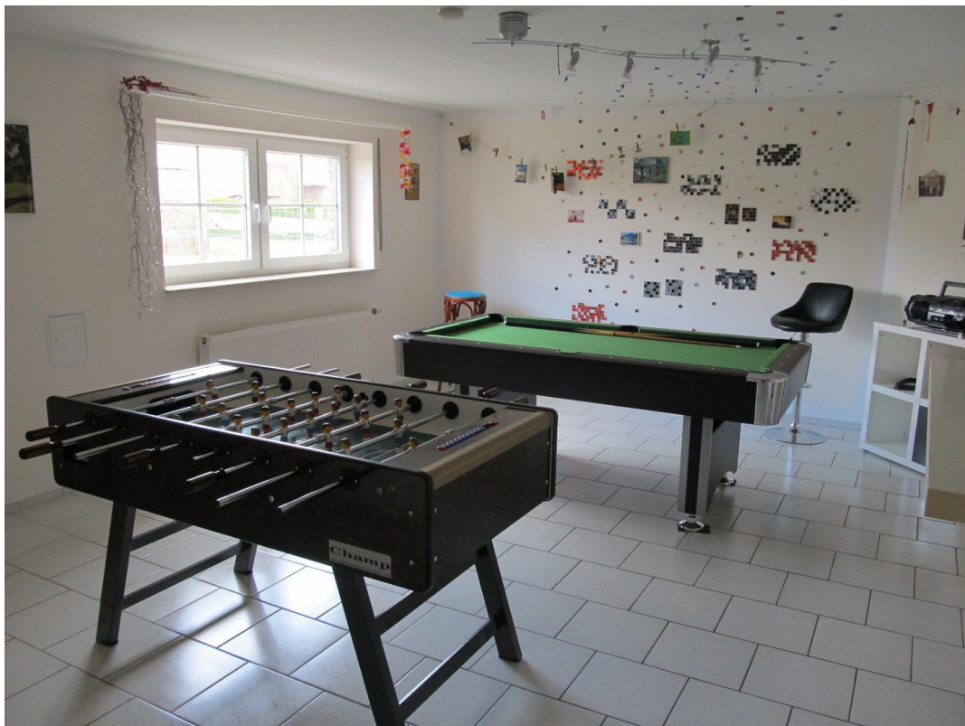
Zimmer 1 KG