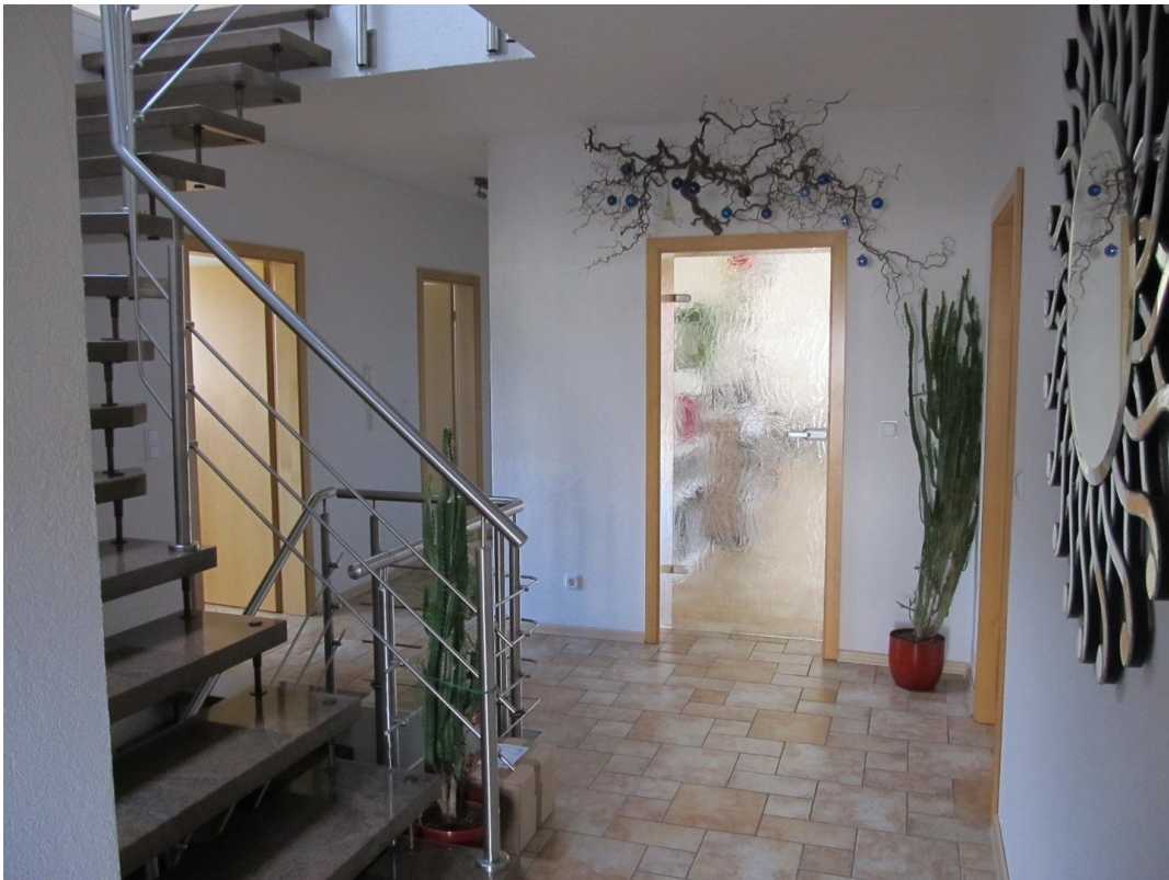
Eingangsbereich / Flur