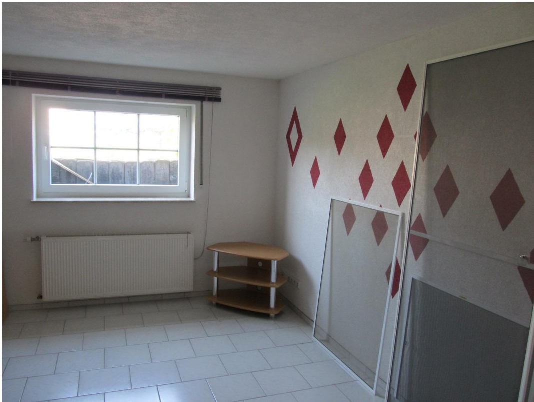
Zimmer 2 KG