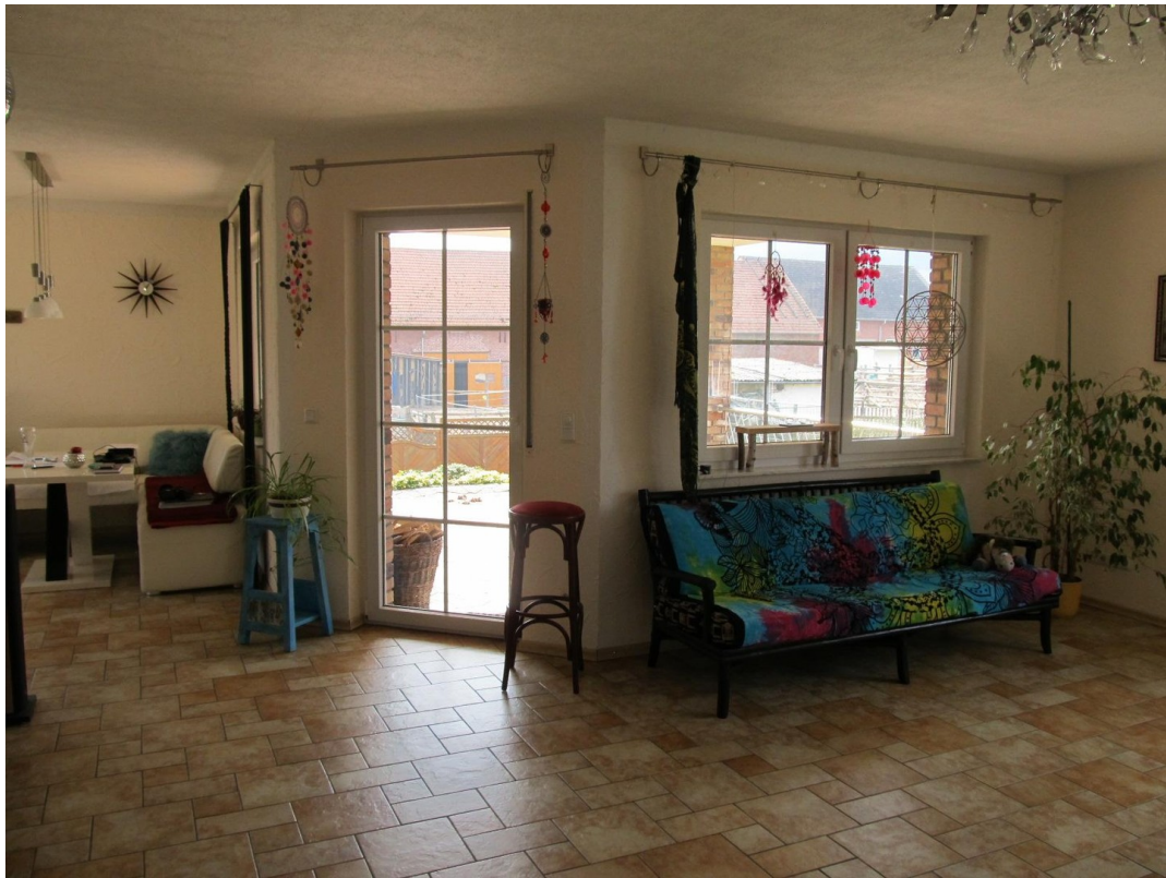
Wohnküche Zugang zur Terrasse