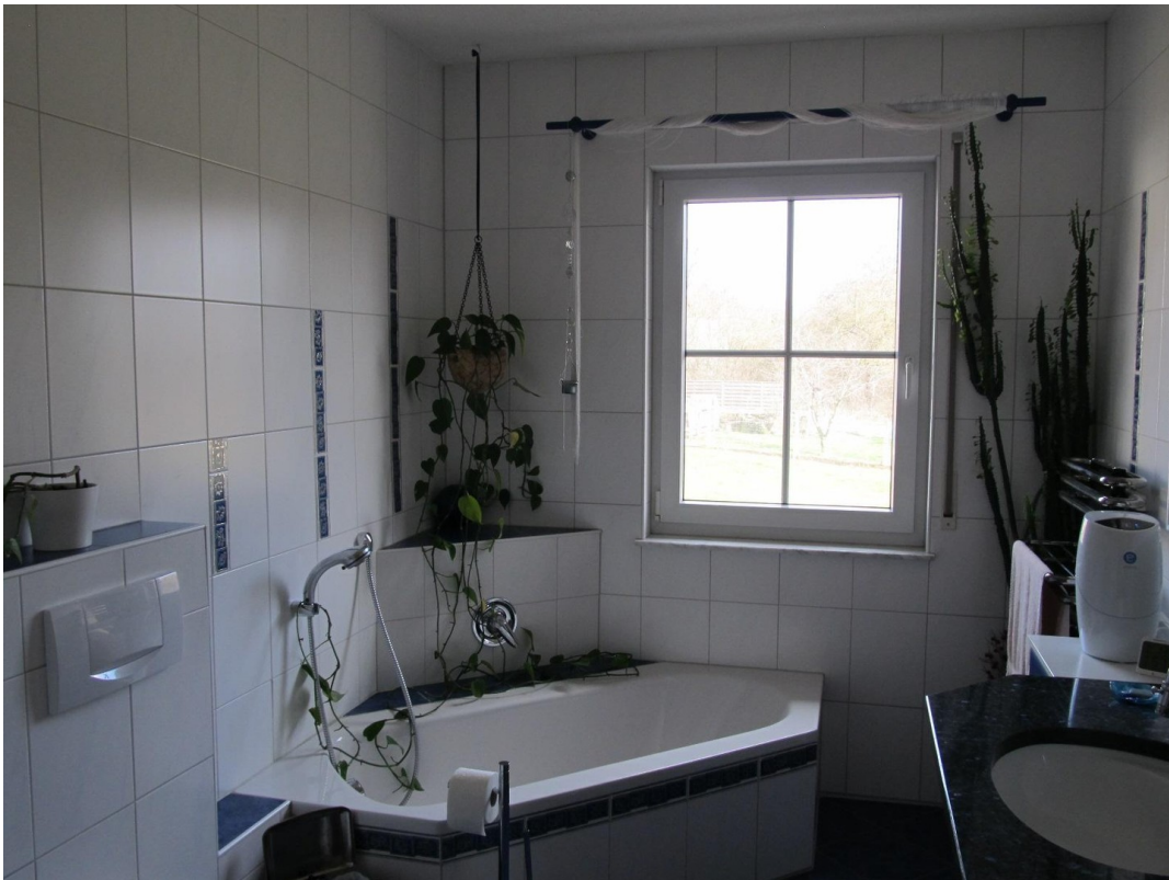
Bad im EG