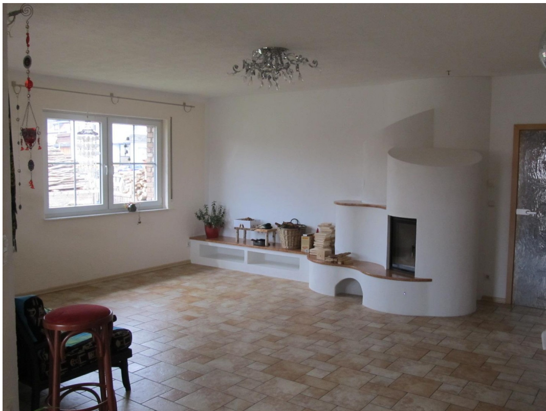
Wohnzimmer mit Speicherofen