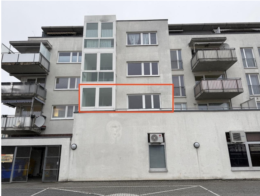
Außenansicht vom Hinterhof