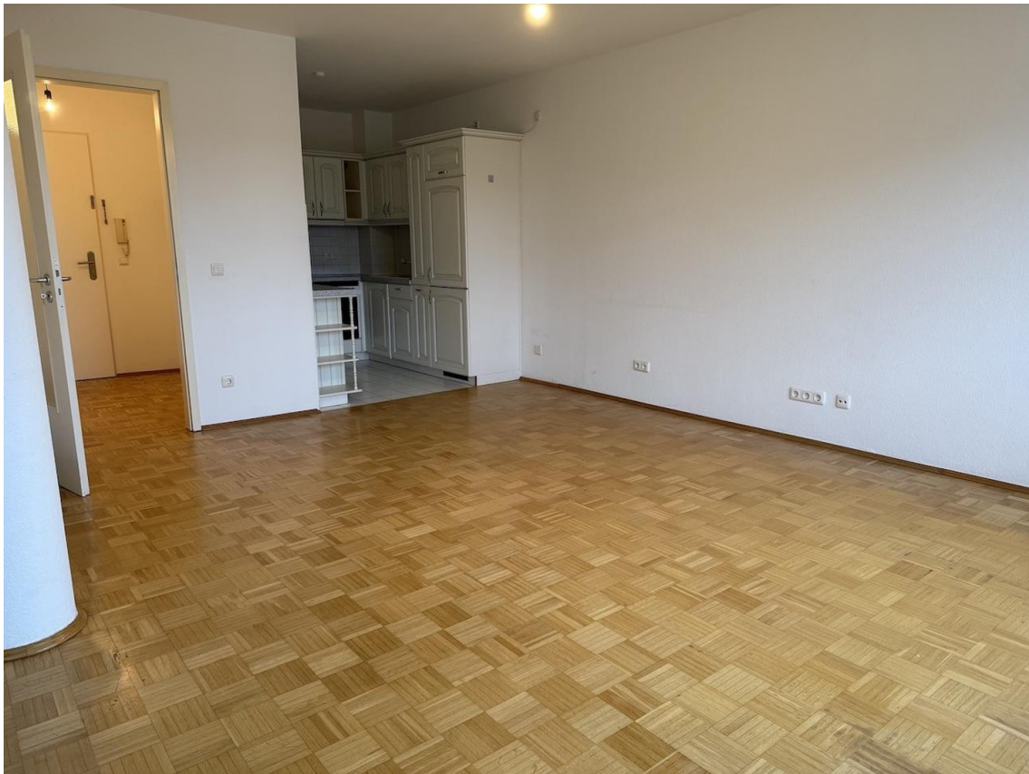
Wohnraum groß mit Küche