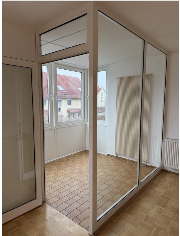
Wintergarten vom Wohnzimmer