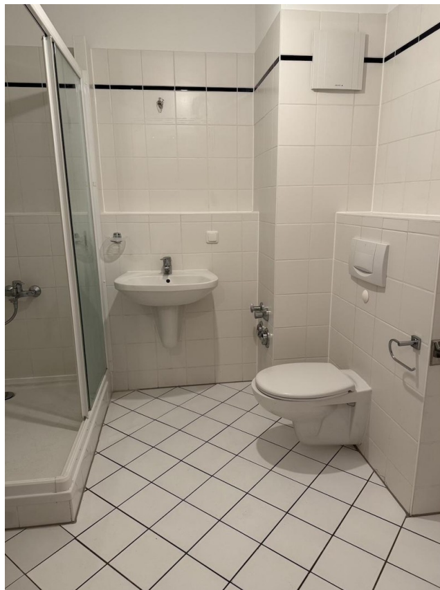
Bad mit WC