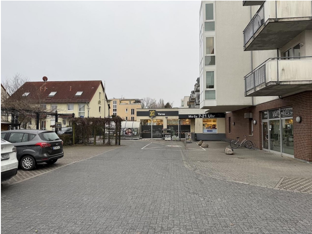
Lebensmittel direkt nebenan