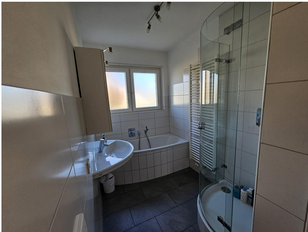
Blick ins Bad