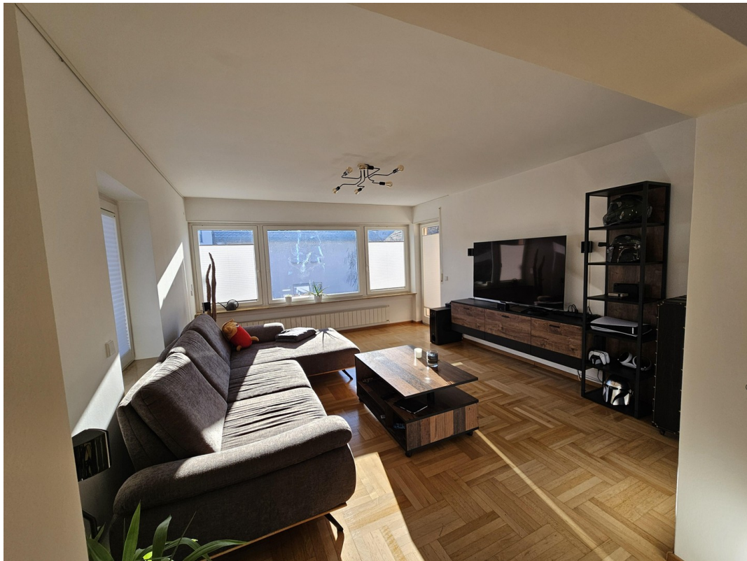
Blick ins Wohnzimmer