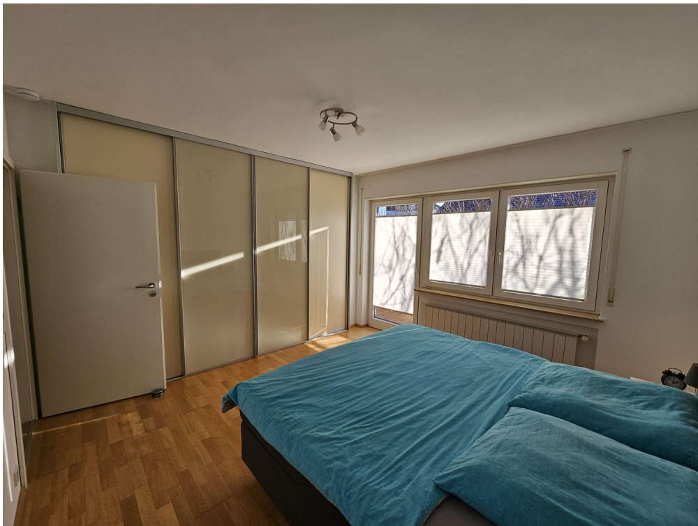
Einbauschränk im Schlafzimmer