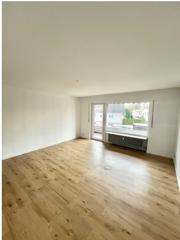
Wohnbereich mit Balkon