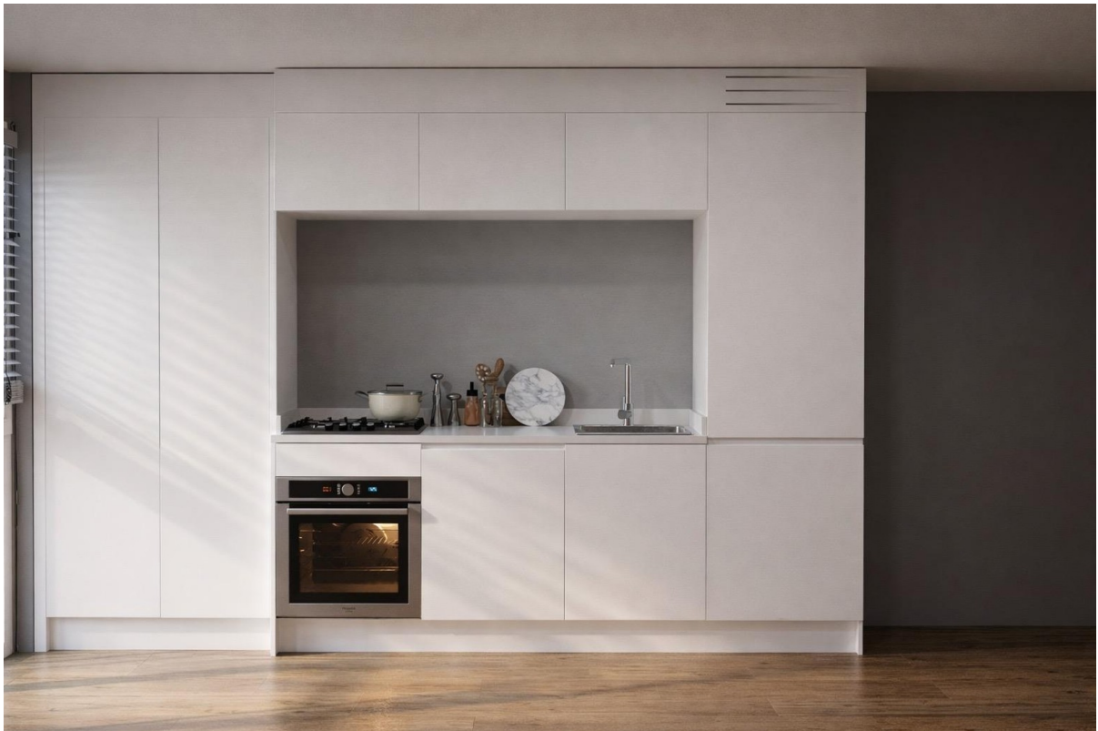
Küche WE 3