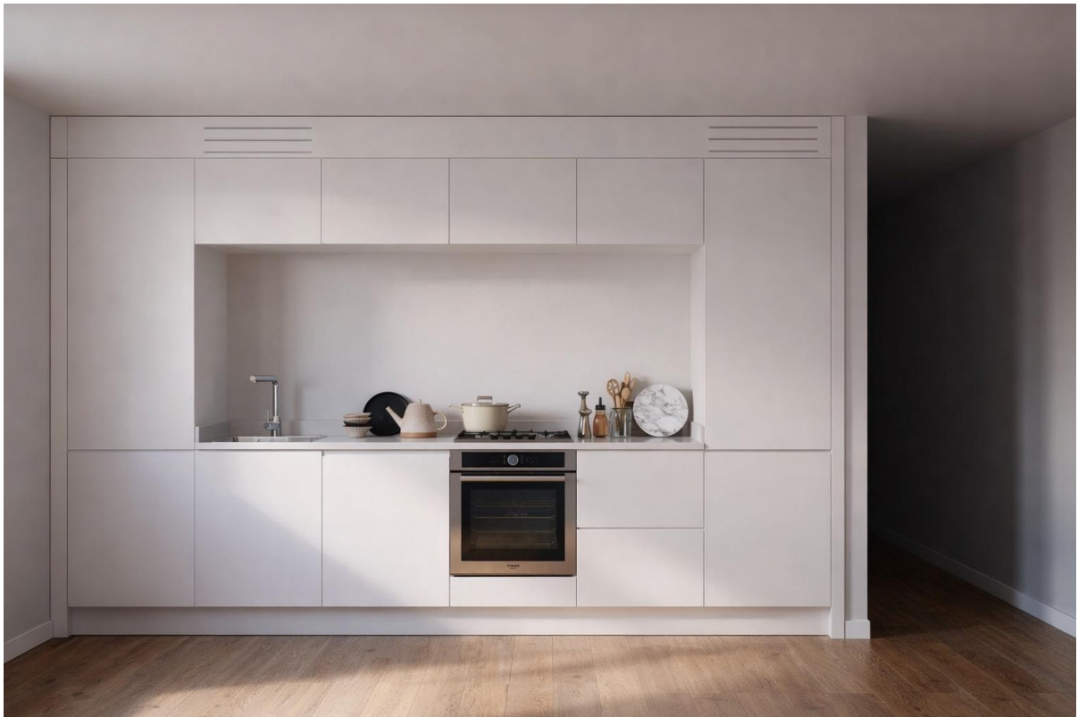
Küche WE 1 und 4