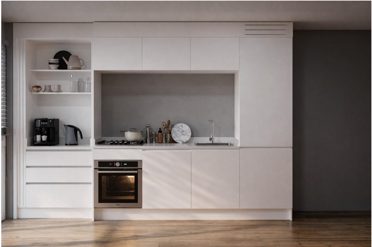
Küche WE 3