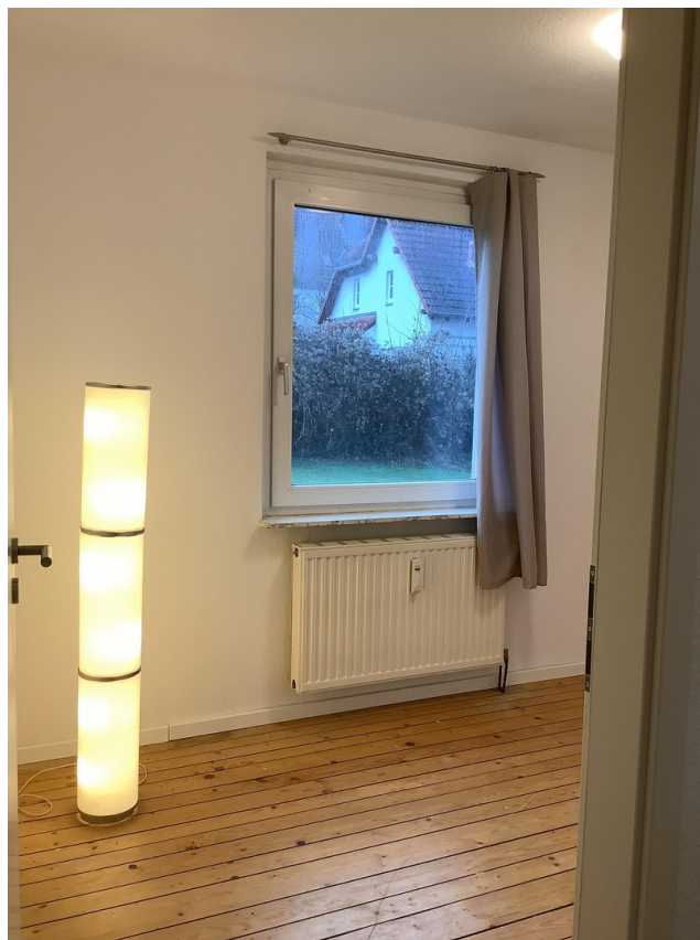
Zimmer Ansicht 1