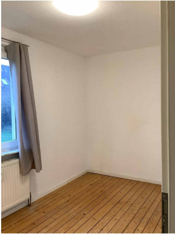
Zimmer Ansicht 2