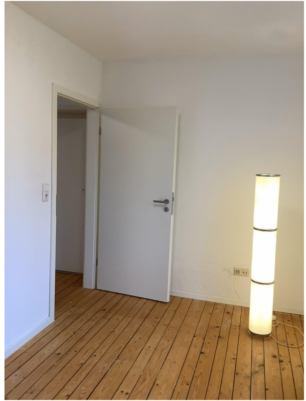
Zimmer Ansicht 3