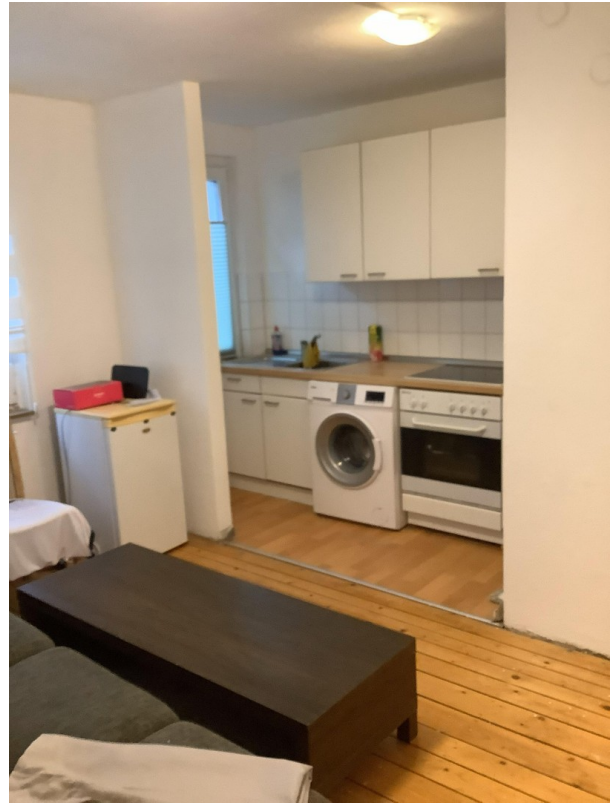
Küche - Essbereich