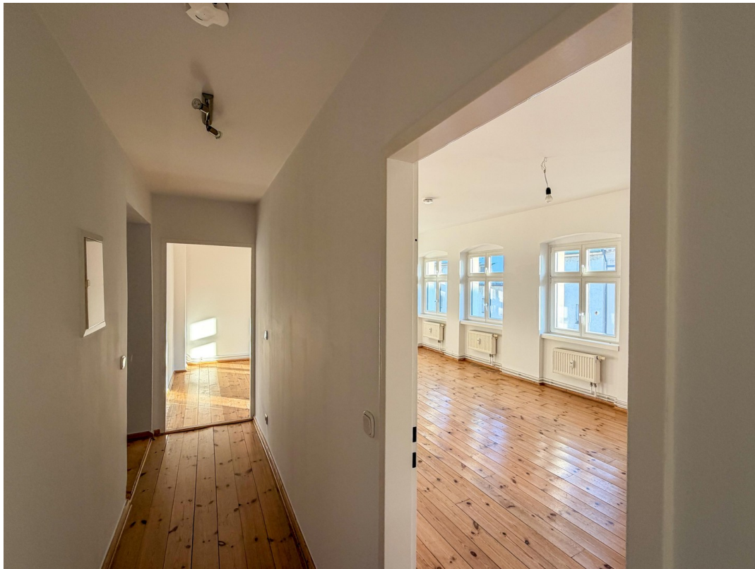
Flur / Zimmer 1