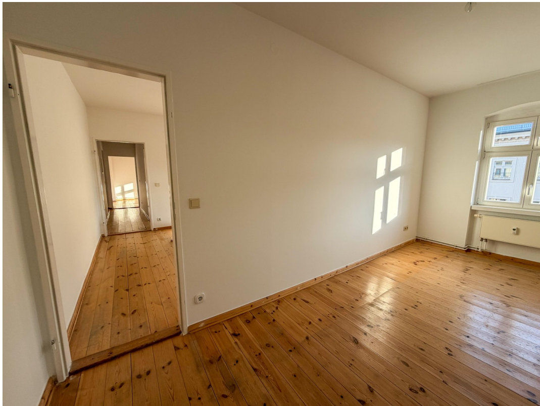
Zimmer 3 / Zimmer 2 / Flur