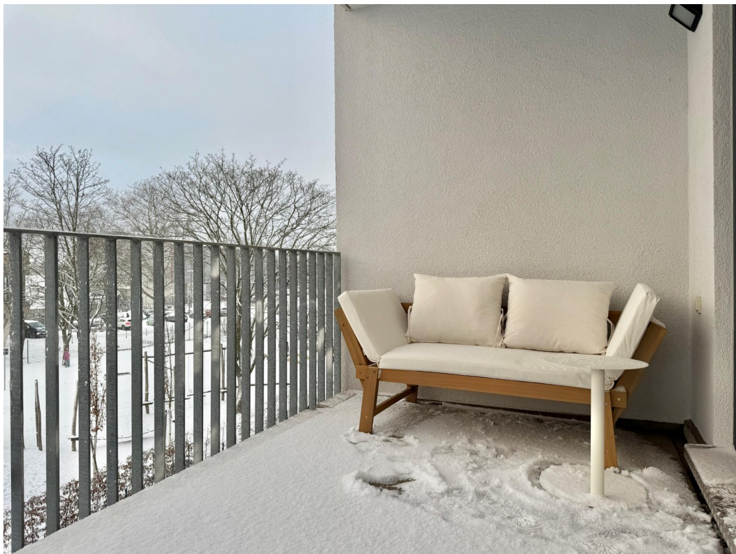
Exklusiver Balkon WG-Zimmer