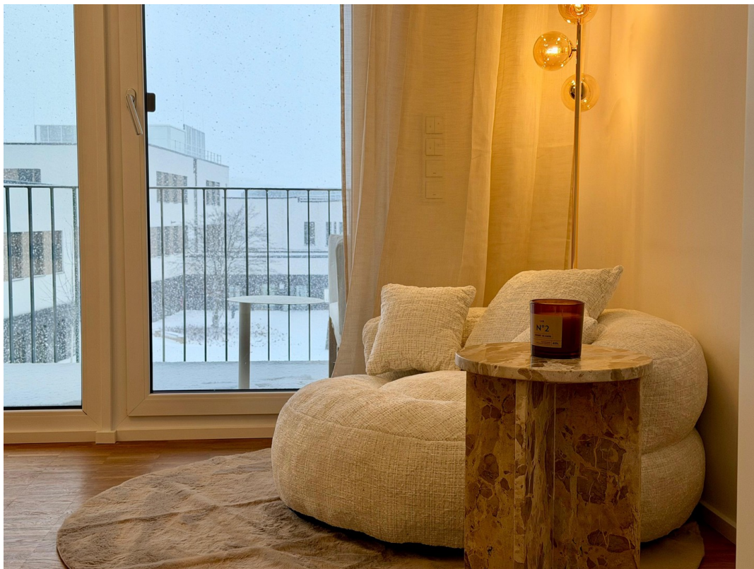
WG-Zimmer (1. Zimmer rechts)