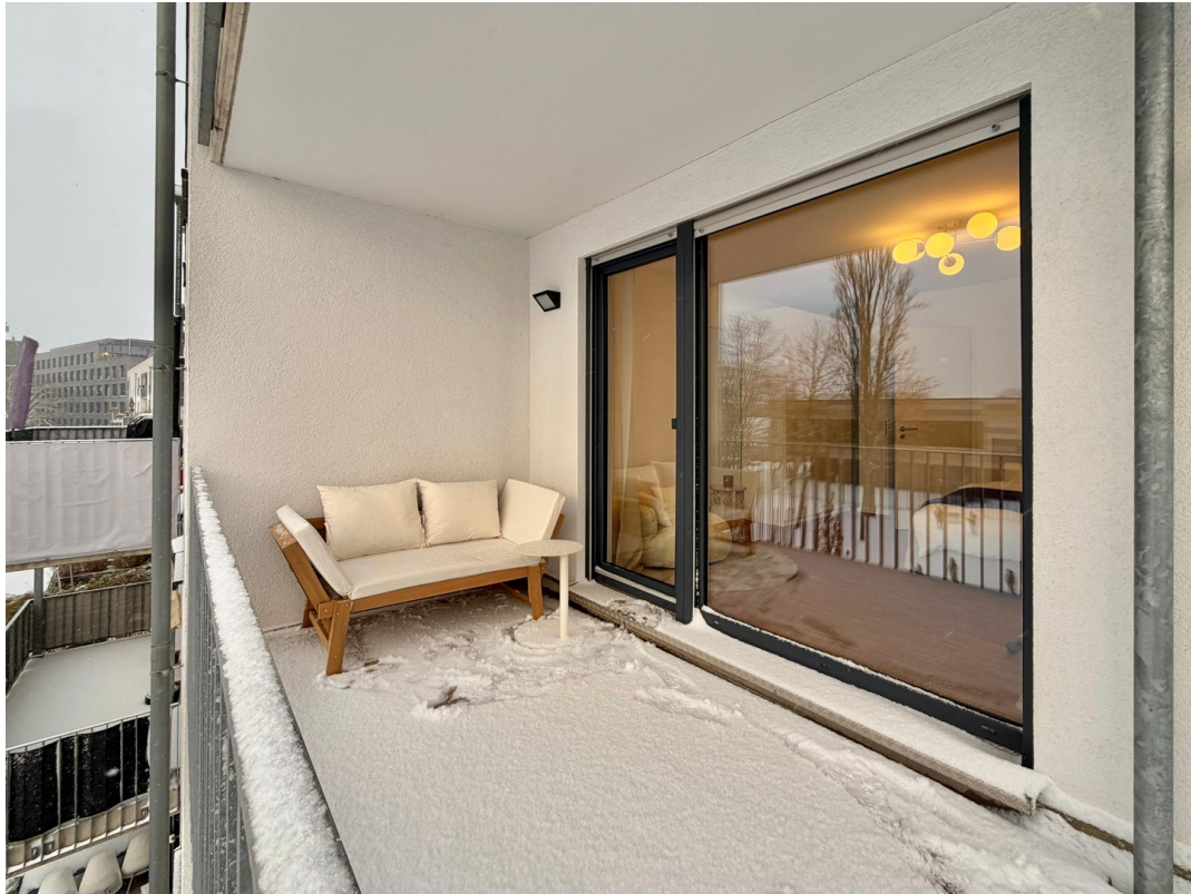
Exklusiver Balkon WG-Zimmer