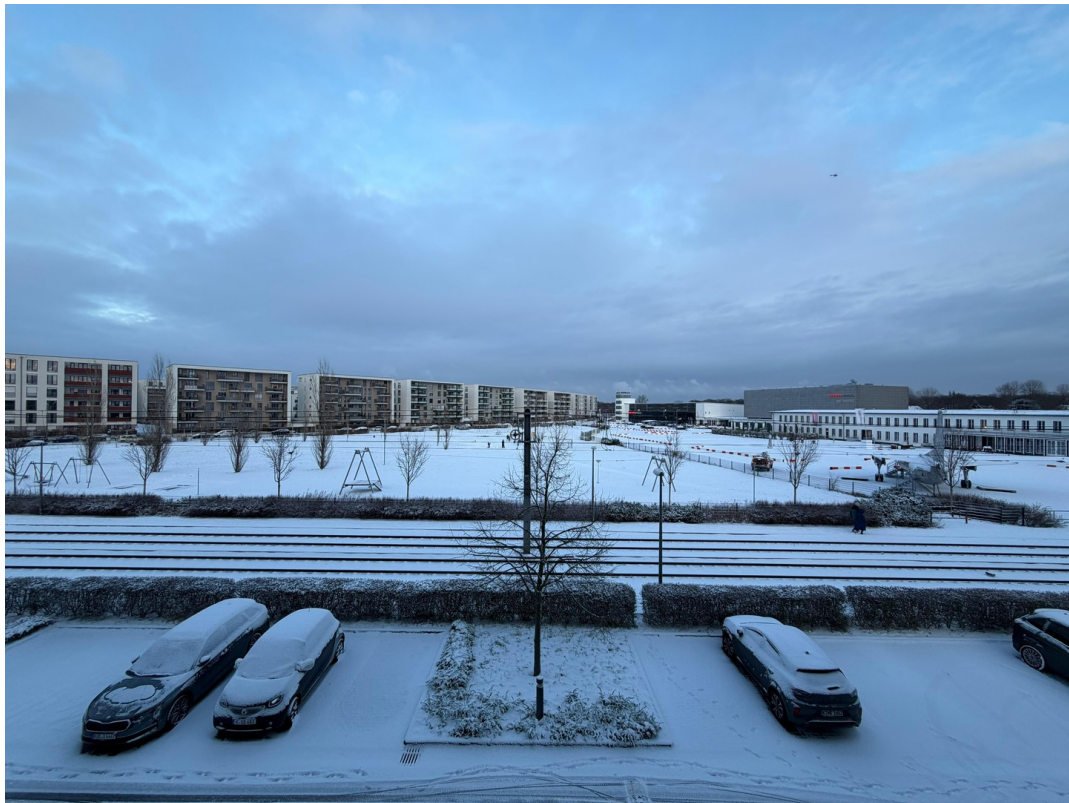
Umgebung & Aussicht