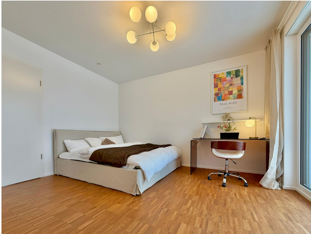
WG-Zimmer (1. Zimmer rechts)