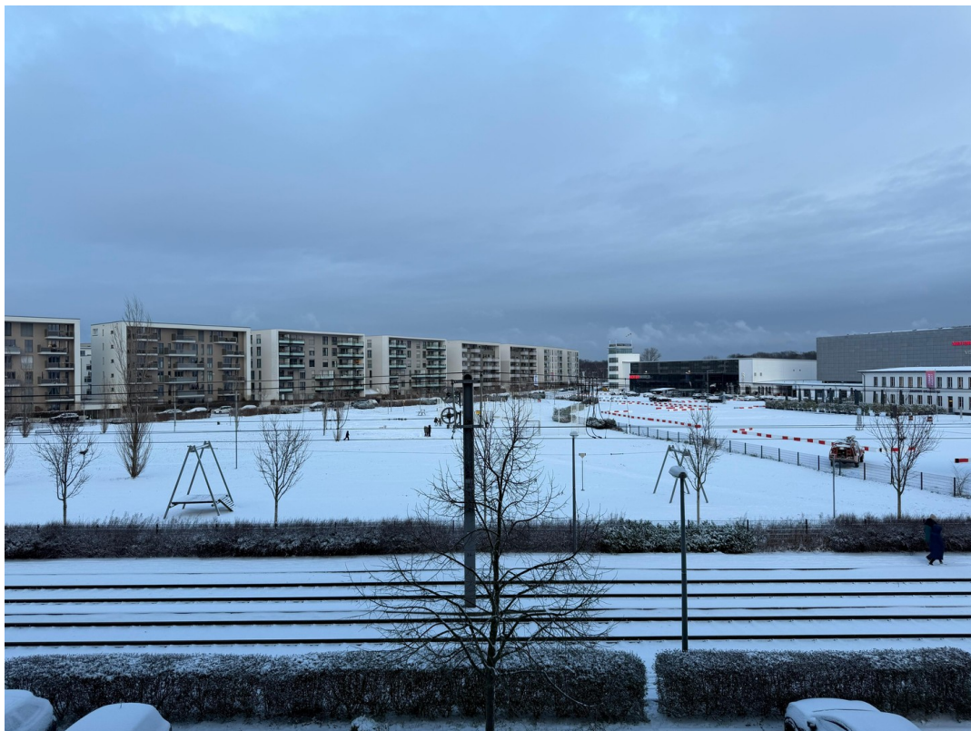
Umgebung & Aussicht