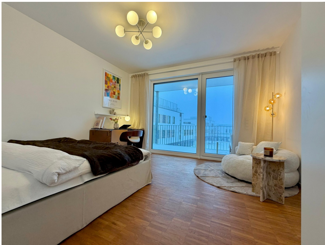
WG-Zimmer (1. Zimmer rechts)