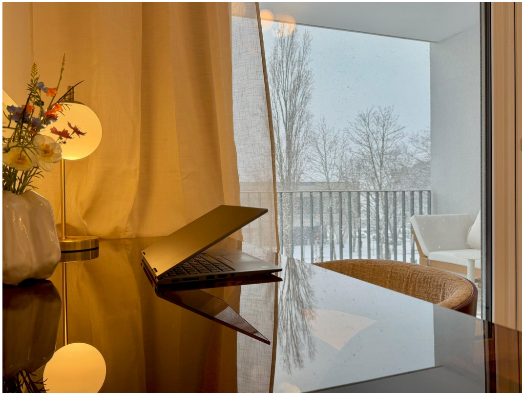
WG-Zimmer (1. Zimmer rechts)