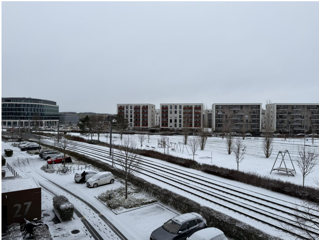
Umgebung & Aussicht