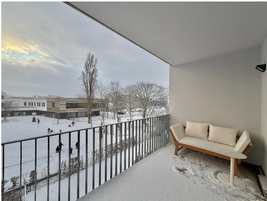
Exklusiver Balkon WG-Zimmer