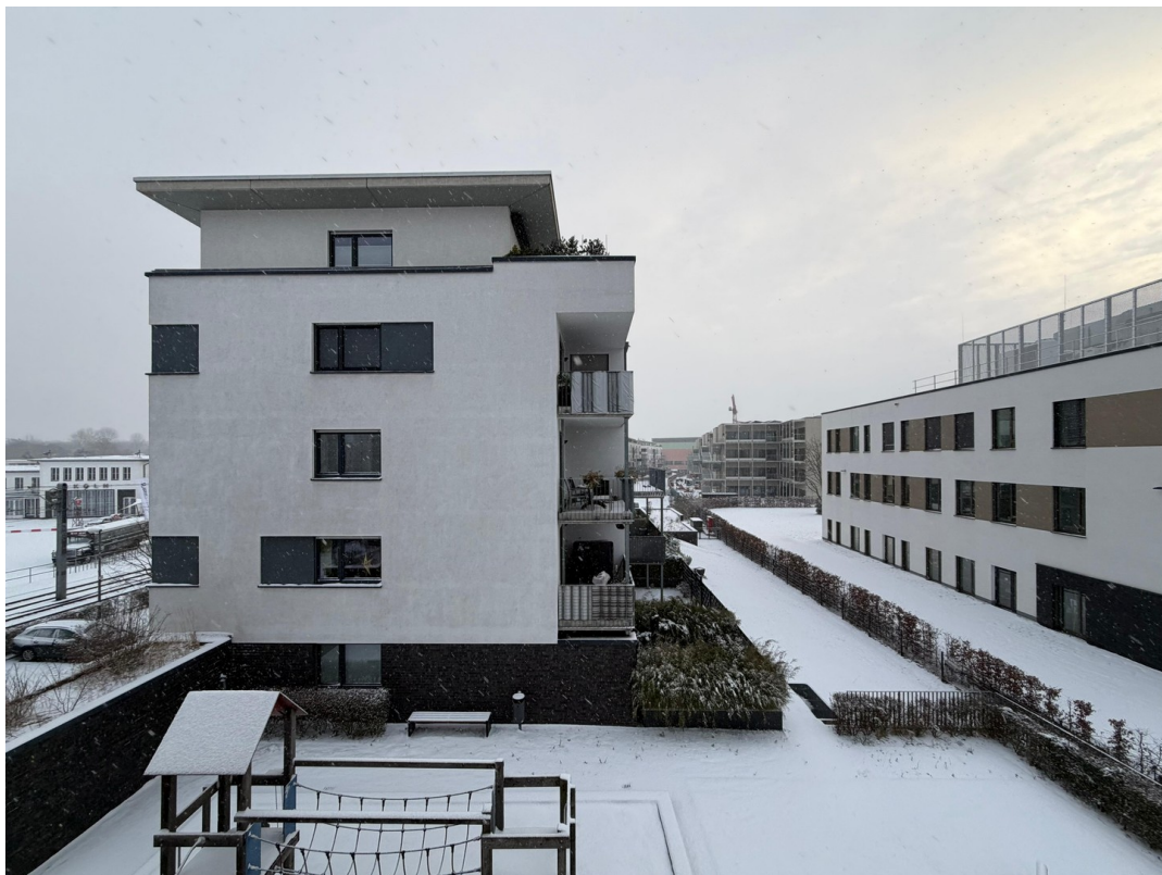
Umgebung & Aussicht