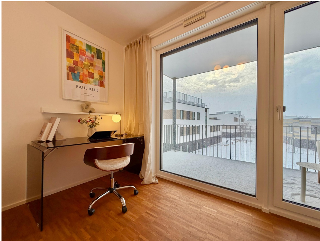
WG-Zimmer (1. Zimmer rechts)