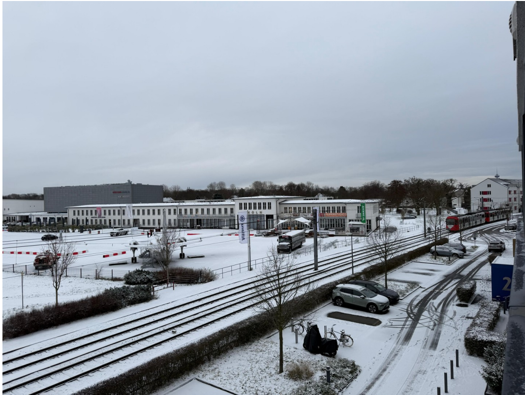
Umgebung & Aussicht