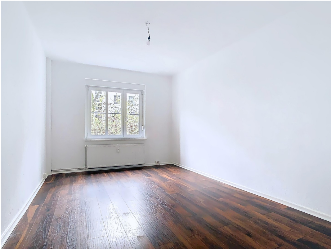
Schlafzimmer zum ruhigen Hof