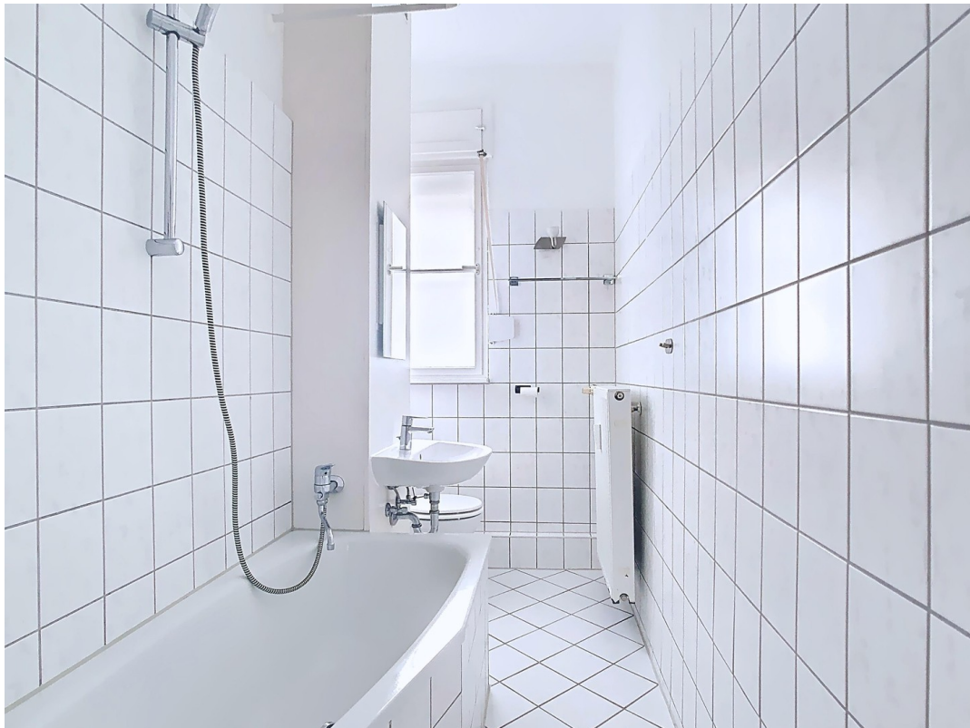
Tageslichtbad mit Wanne