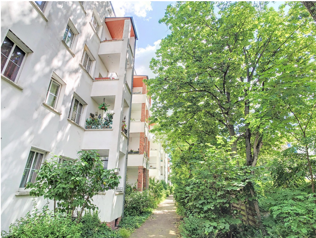
Grüner, ruhiger Hof