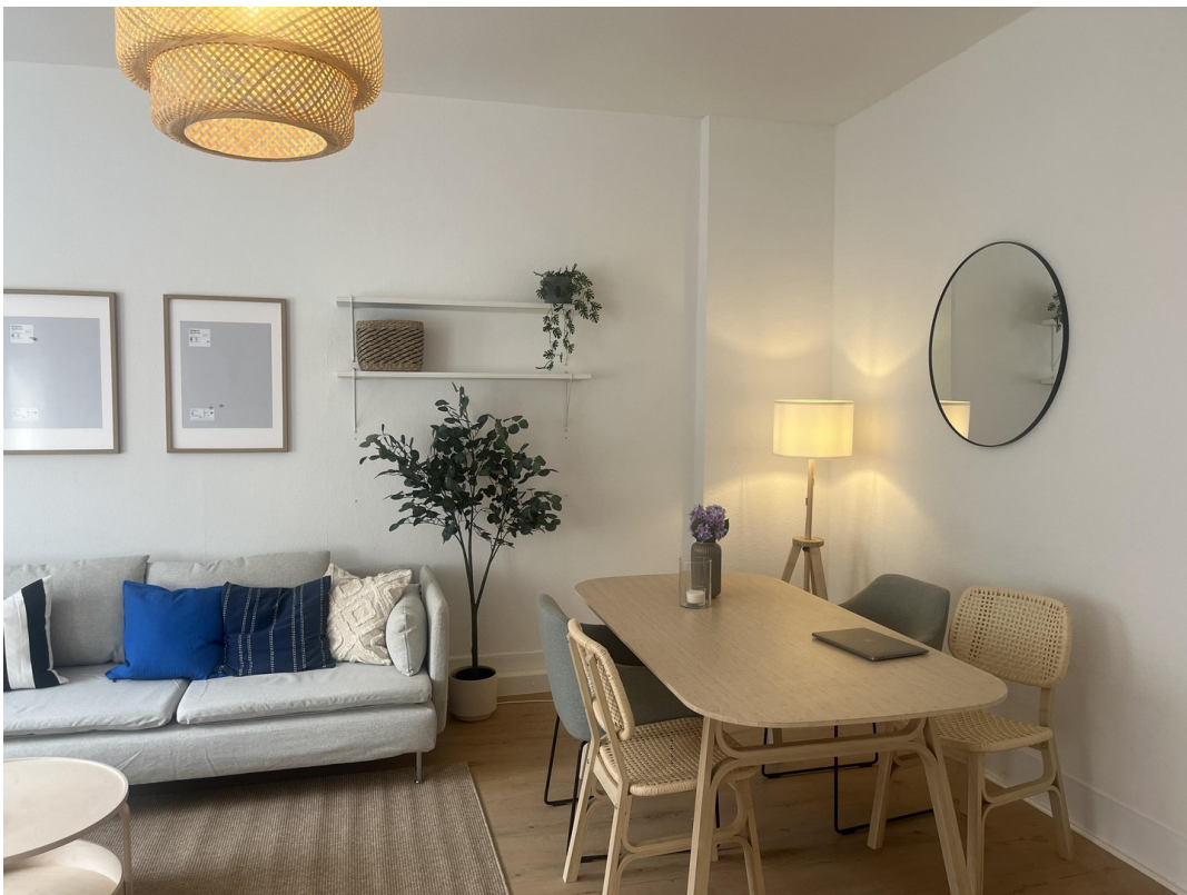
Wohn- / Ess- / Arbeitszimmer 4