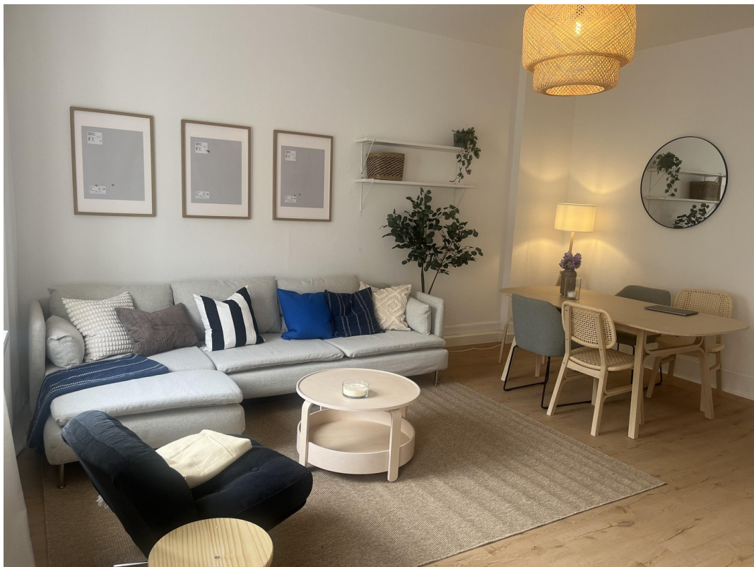
Wohn- / Ess- / Arbeitszimmer 2