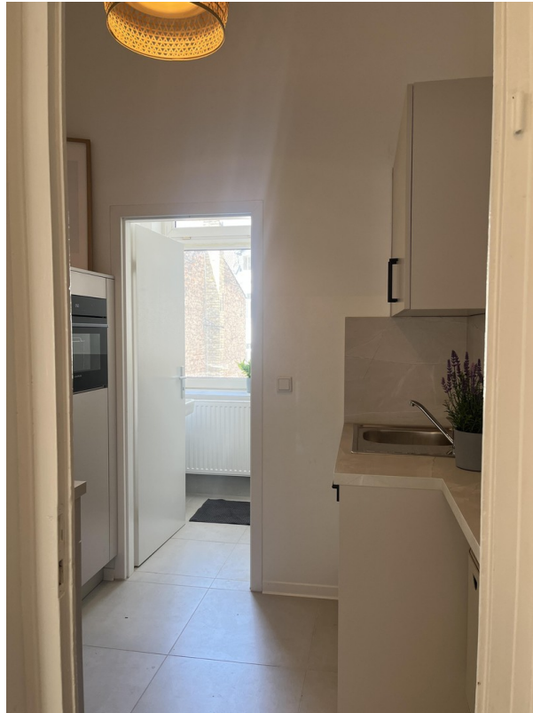
Küche und Bad