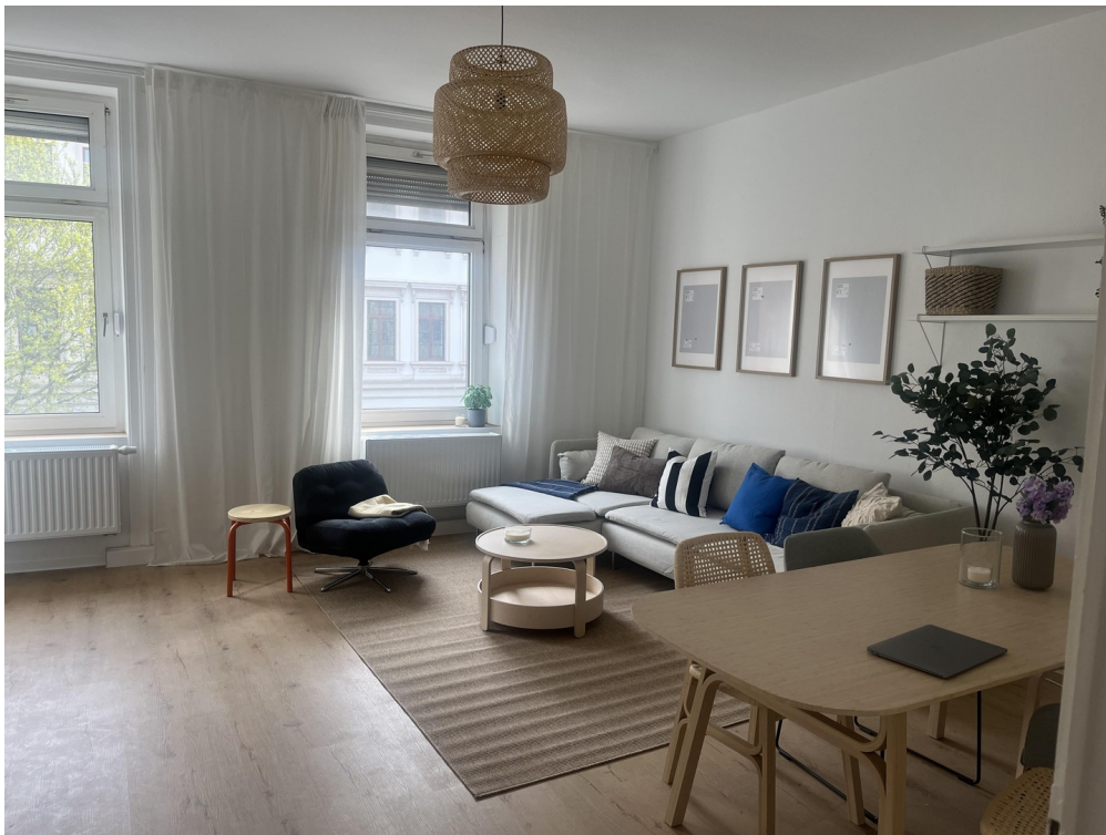
Wohn- / Ess- / Arbeitszimmer 6