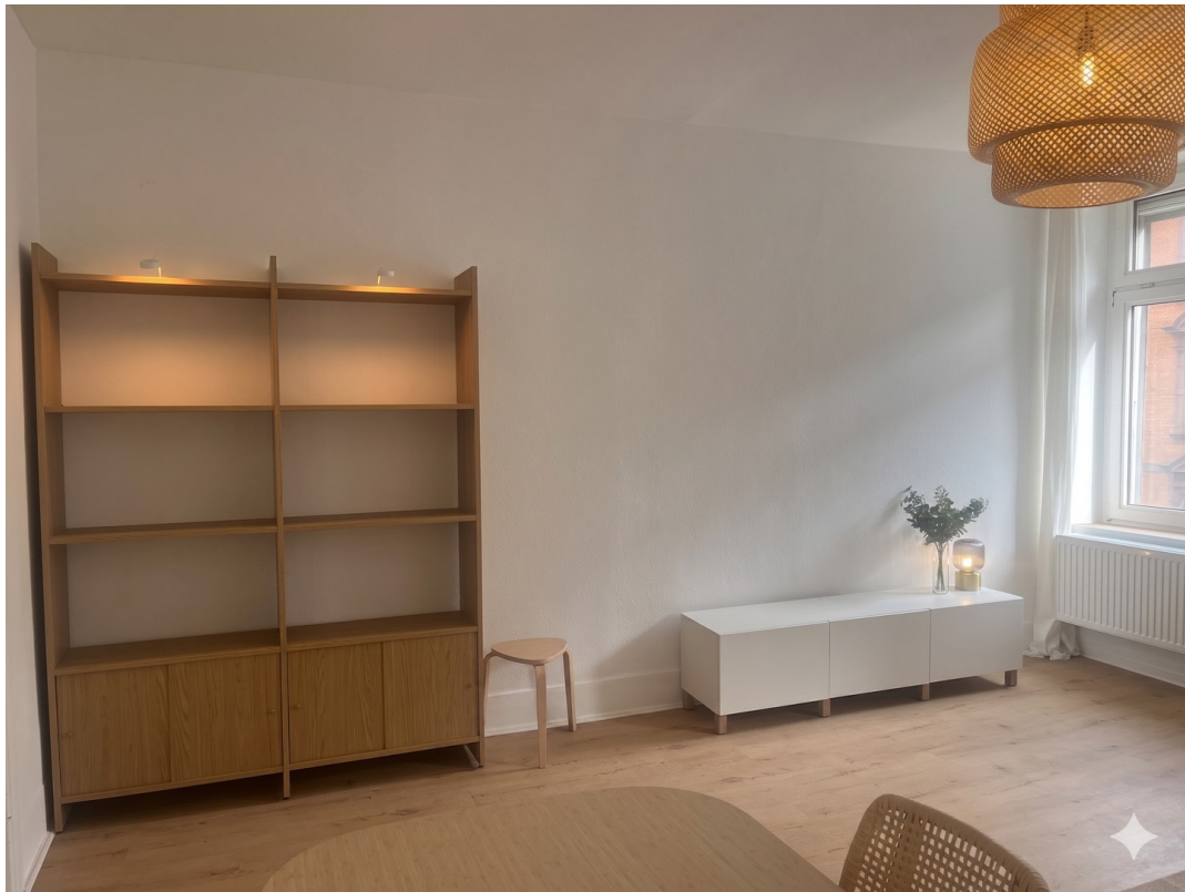
Wohn- / Ess- / Arbeitszimmer 7