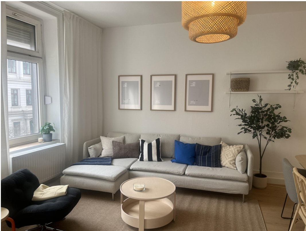
Wohn- / Ess- / Arbeitszimmer 3