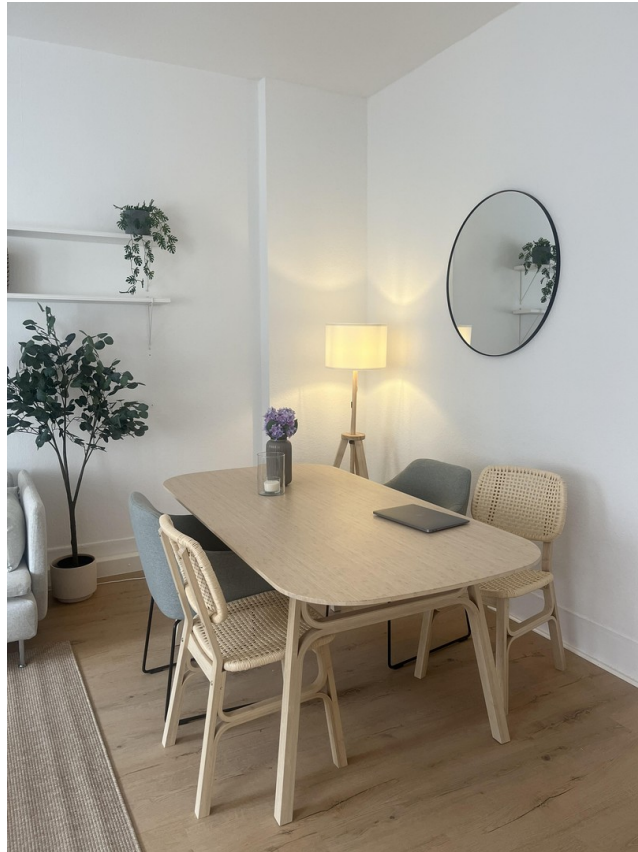
Wohn- / Ess- / Arbeitszimmer 5