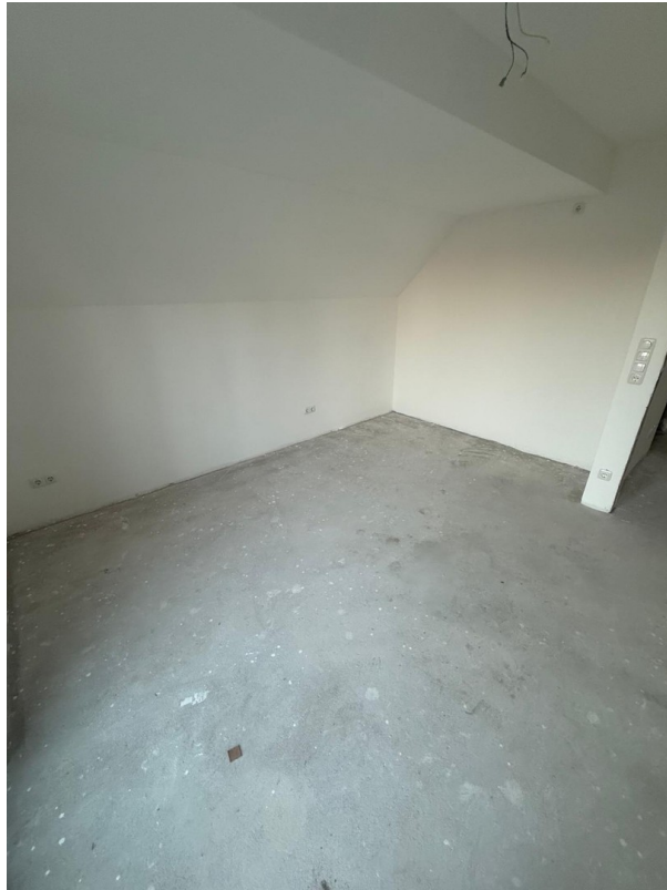
4-Zimmer Galerie: Schlafzimmer