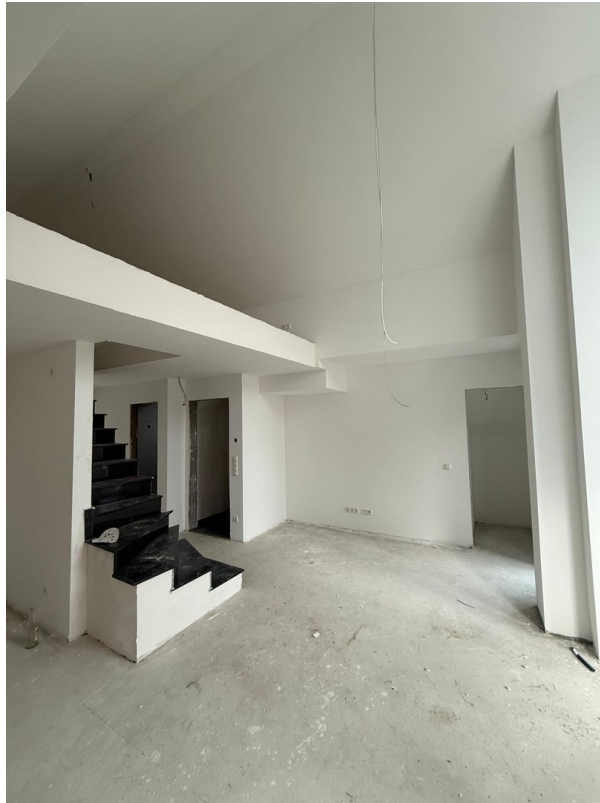
4-Zimmer Galerie: Wohnzimmer