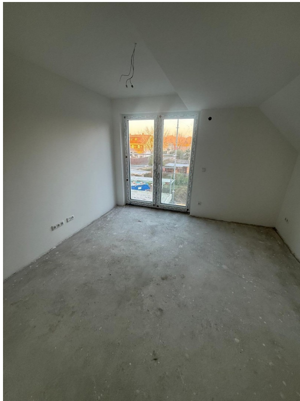
4-Zimmer Galerie: Schlafzimmer