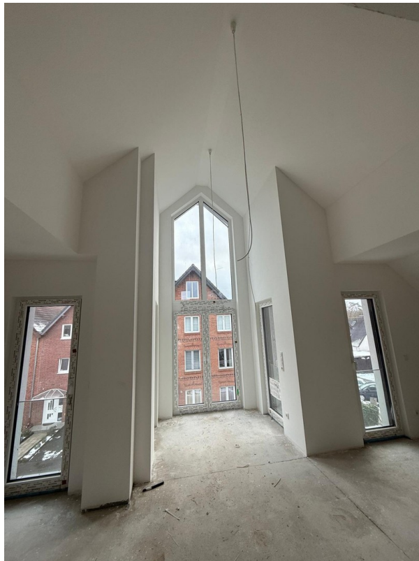
4-Zimmer Galerie: Wohnzimmer