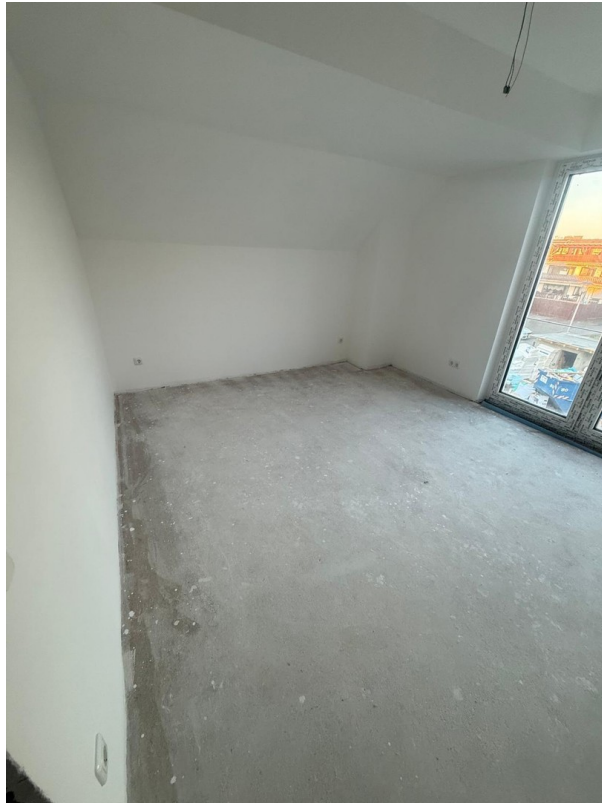
4-Zimmer Galerie: Schlafzimmer