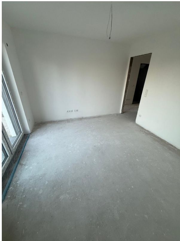
4-Zimmer Galerie: Schlafzimmer