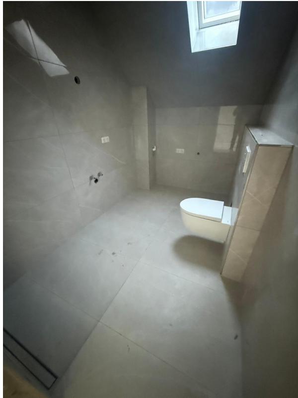
4-Zimmer Galerie: Badezimmer