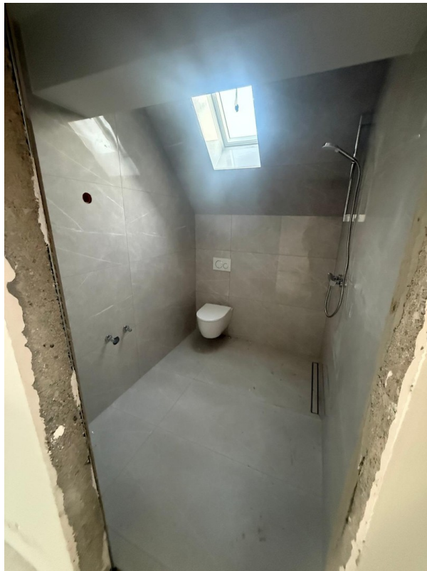
4-Zimmer Galerie: Badezimmer