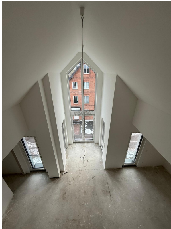
4-Zimmer Galerie: Dachgeschoss