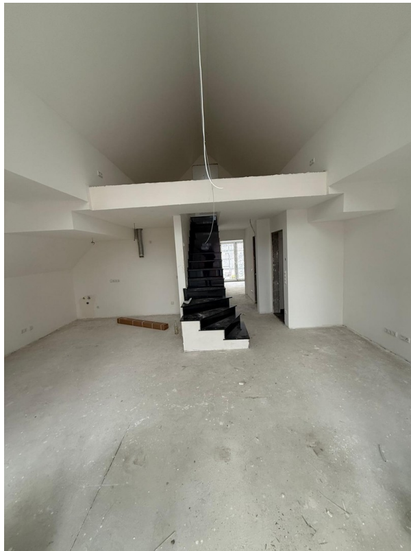
4-Zimmer Galerie: Wohnen+Küche