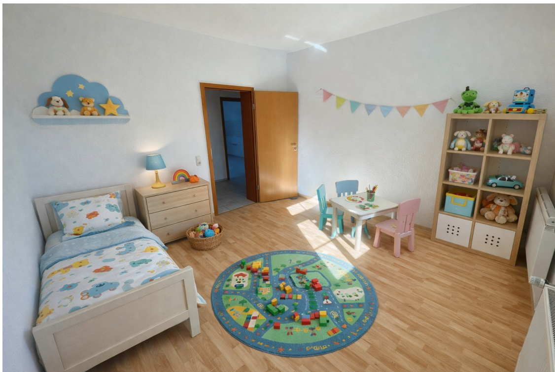
Kinderzimmer Ki möbliert