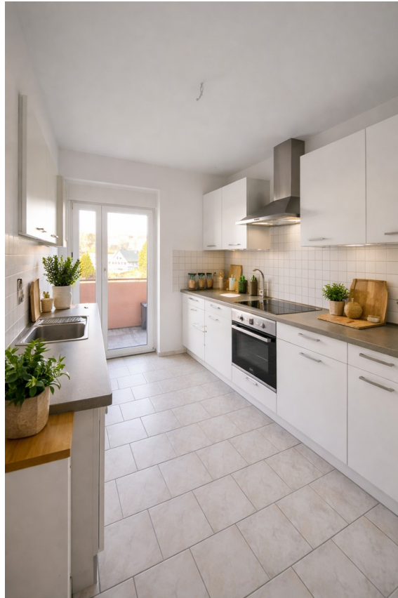
Küche Ki möbliert