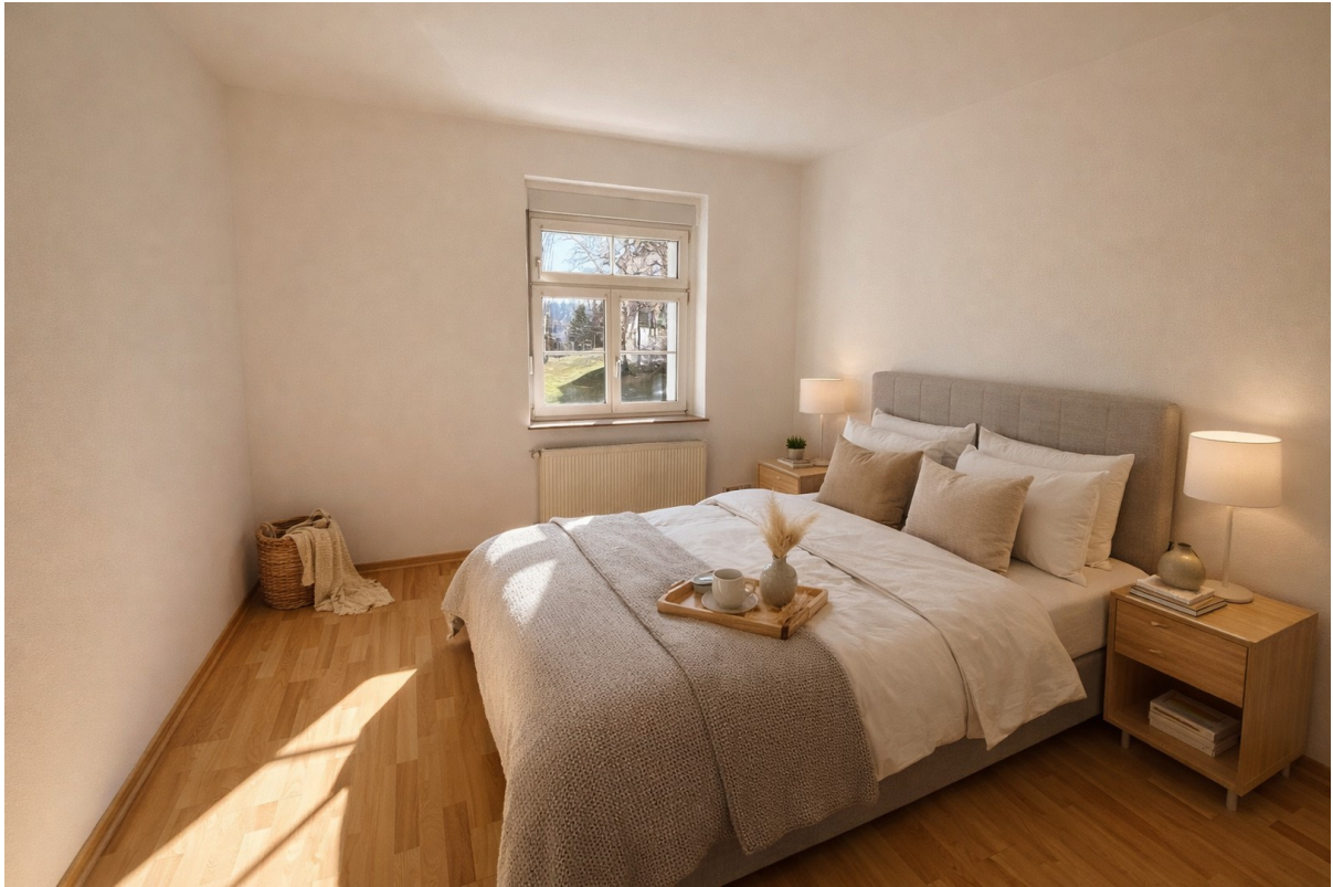
Schlafzimmer Ki möbliert