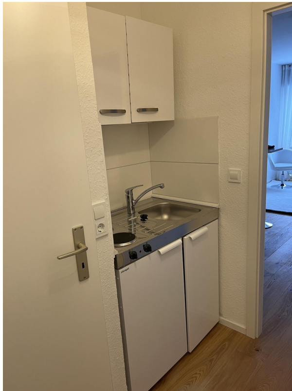
Eingang und Küche