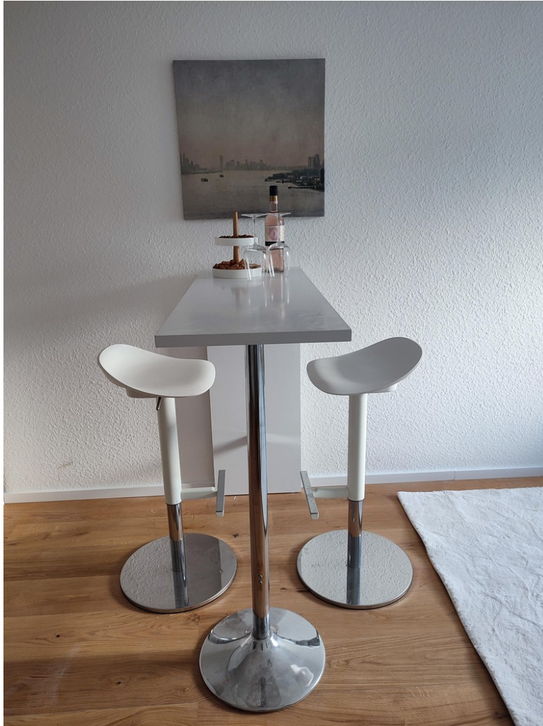
Tisch mit Hochstühlen