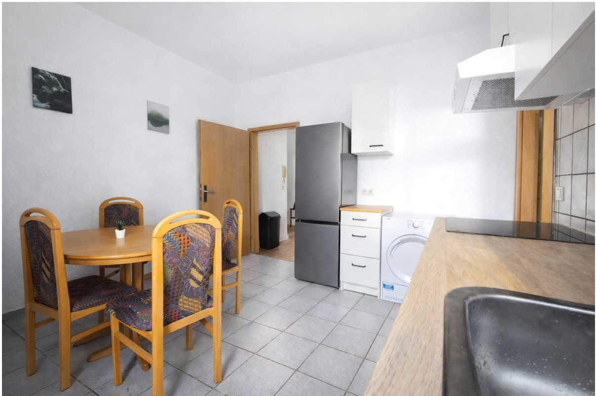
Küche mit Essecke