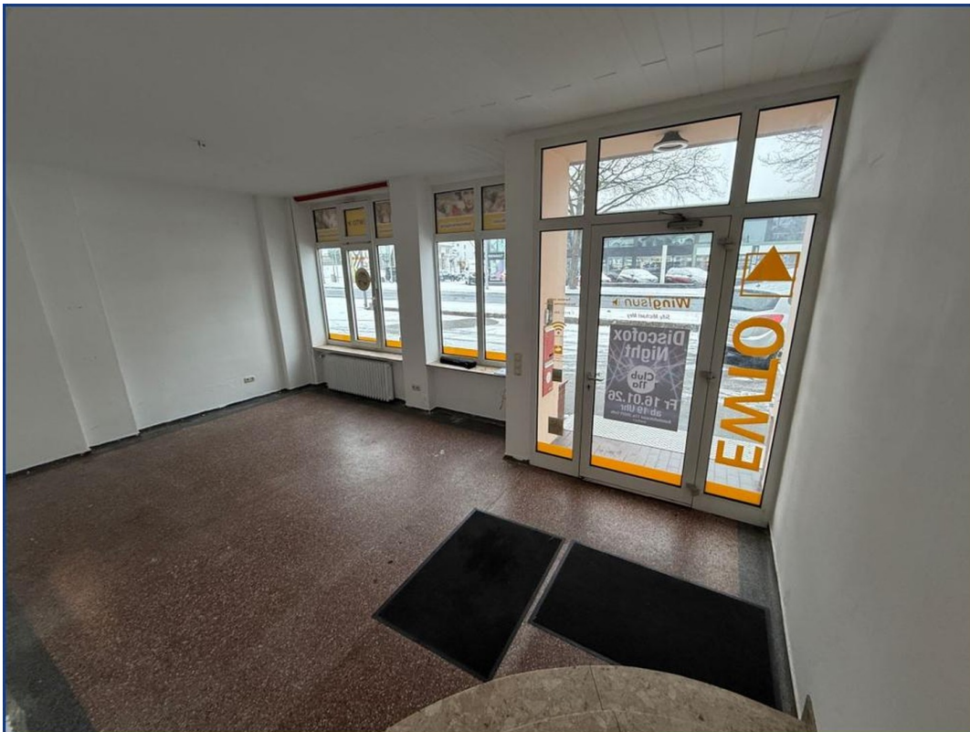
Empfangsbereich zweiter Blick