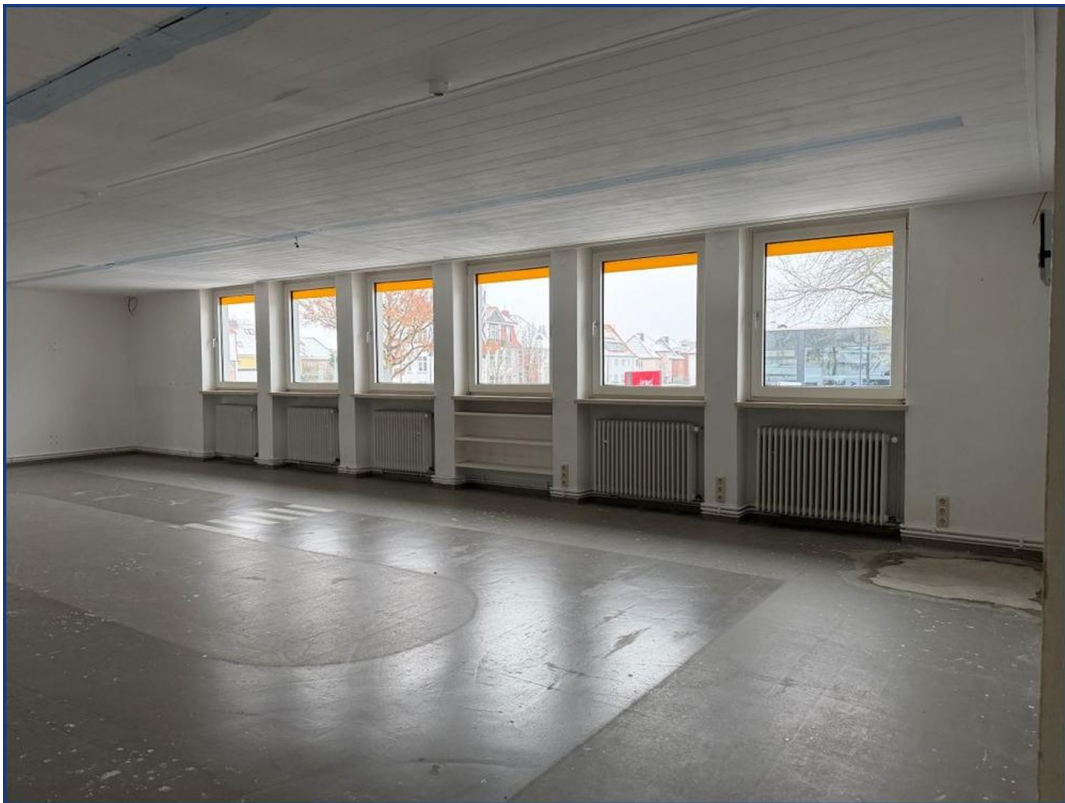
Raum mit Fensterfront