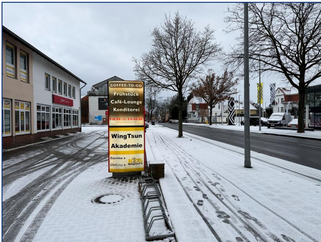
Werbepylon an der Straße