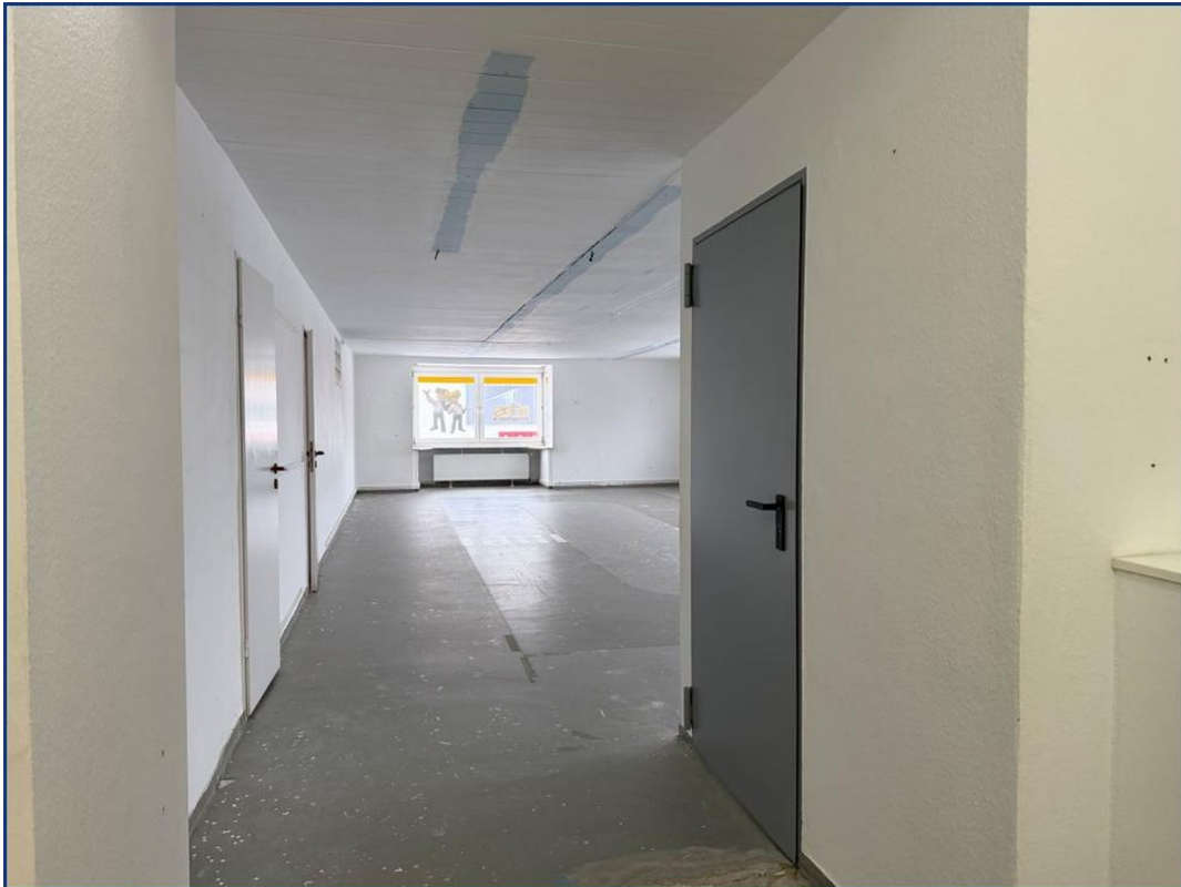
Blick in die Fläche