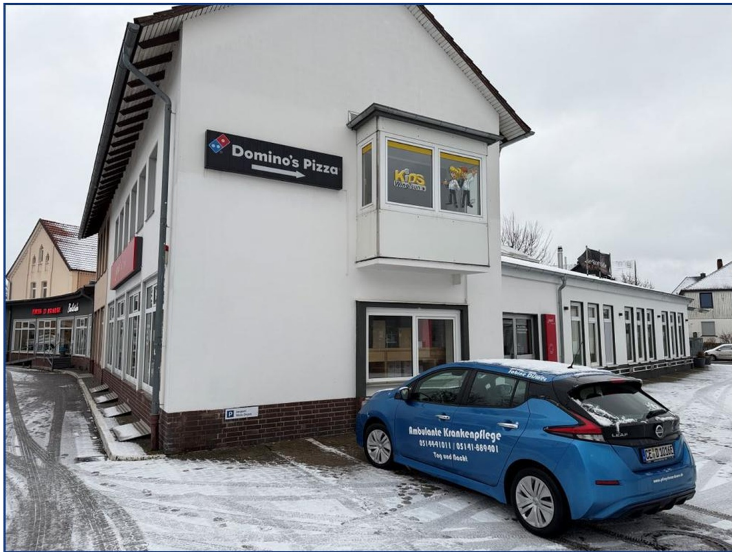
Seitenansicht mit Stellplätzen