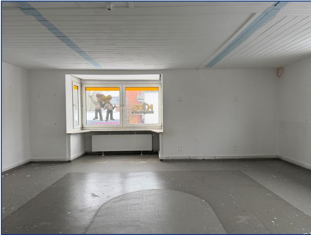
Großer Raum Obergeschoss