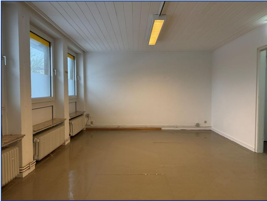
Separater Raum Obergeschoss