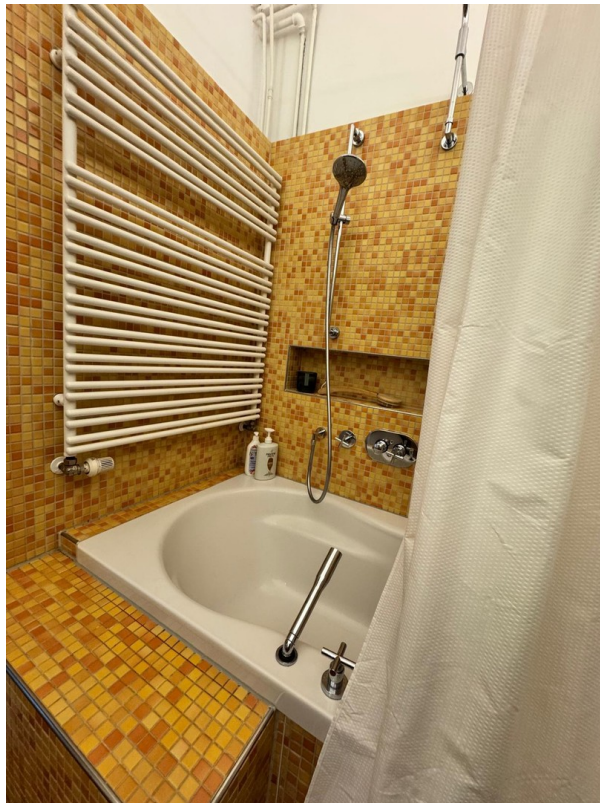
Badezimmer mit Sauna