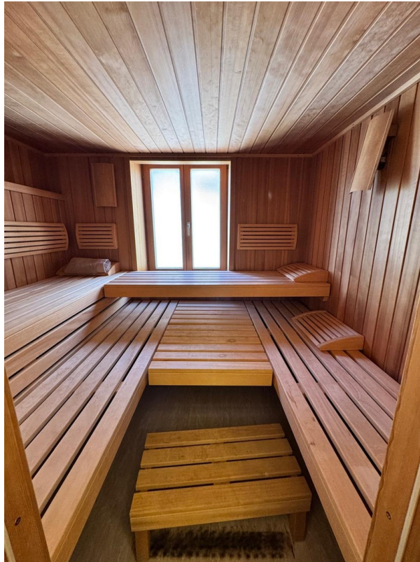
Badezimmer mit Sauna