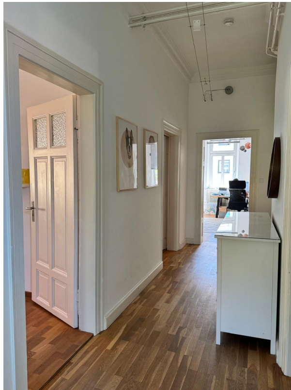
Flur 2. OG