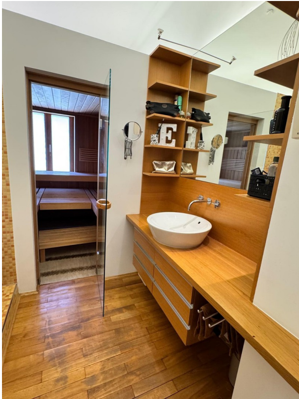
Badezimmer mit Sauna