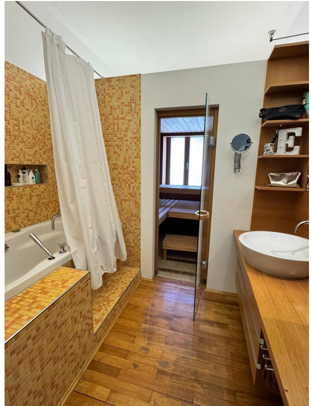
Badezimmer mit Sauna