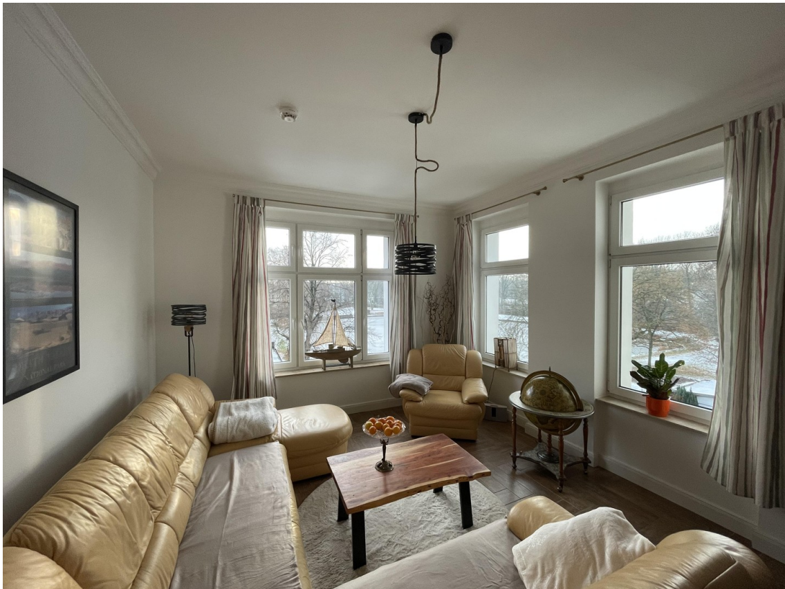
Mit Blick auf den See