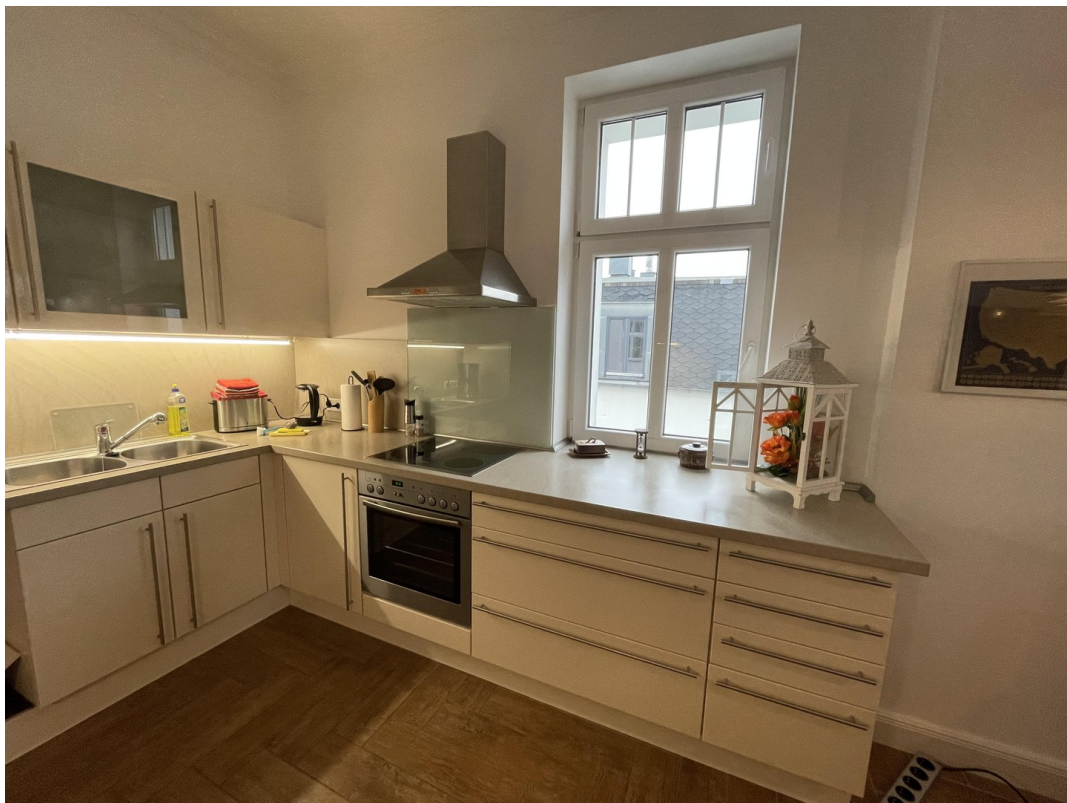
Große Küche 1 / kittchen 1