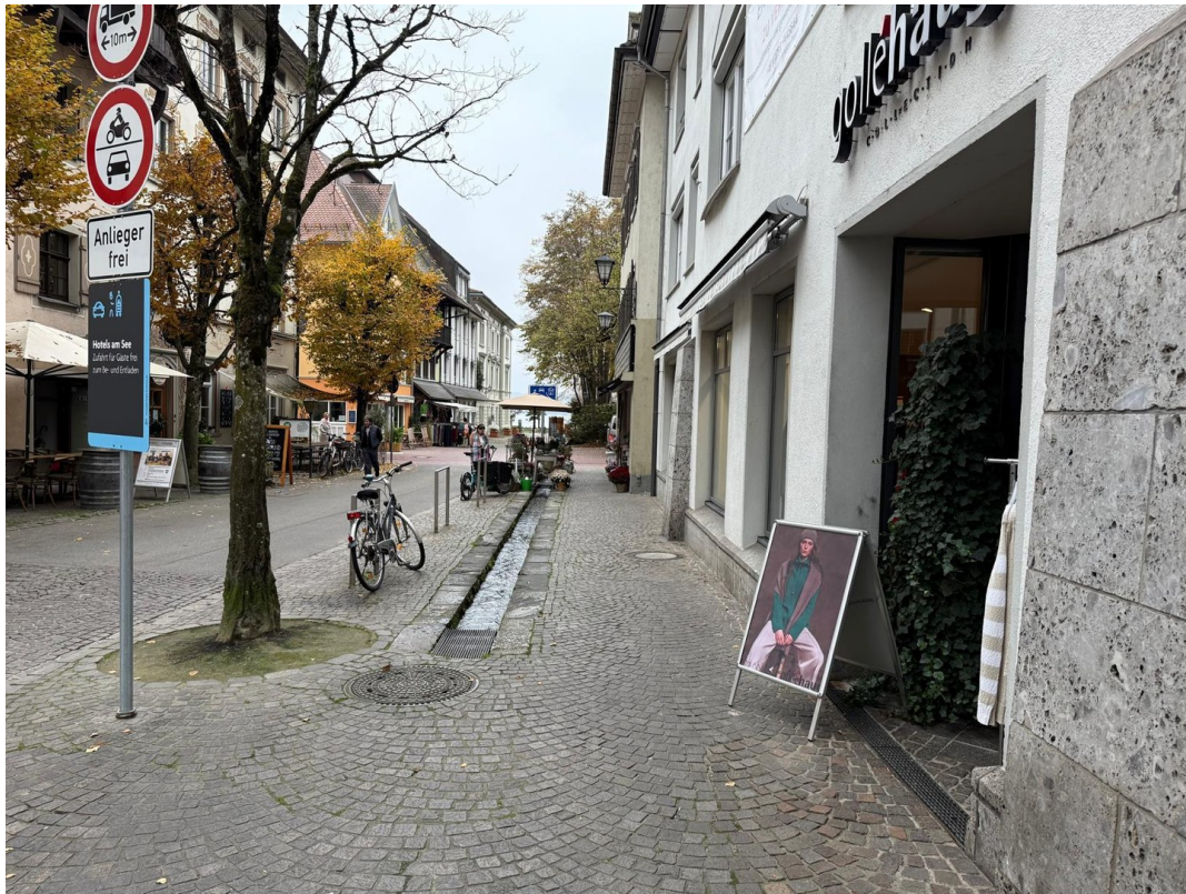
Weniger Meter bis zum See