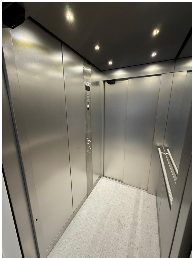
Aufzug bis vor die Haustüre