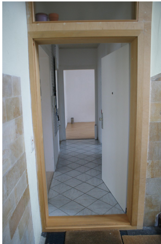
Eingang und Diele