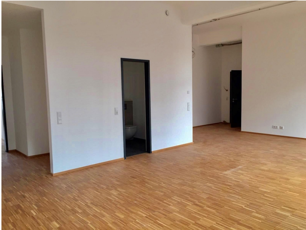
Gästebad und Eingang