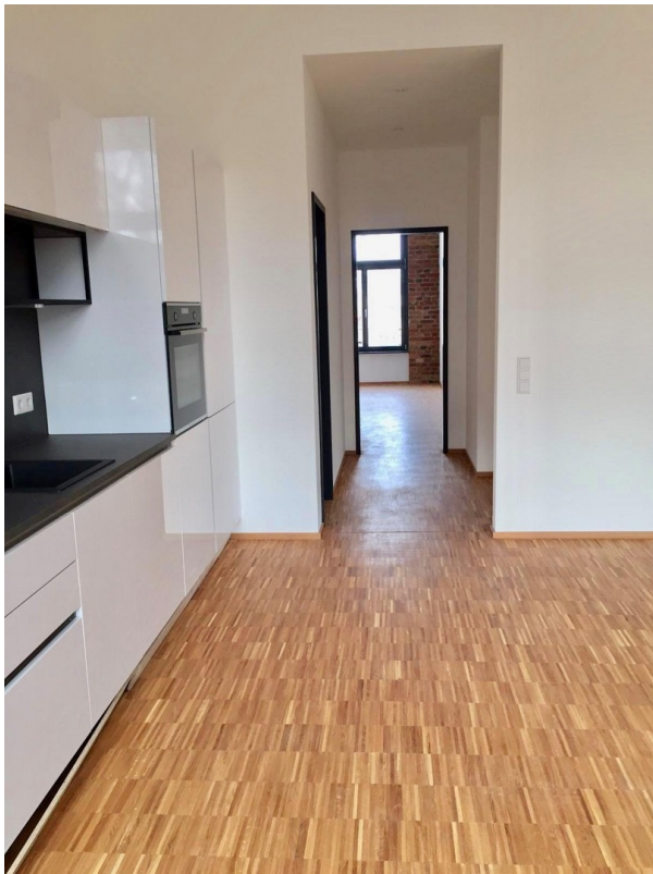
Küche Blick zum Schlafzimmer