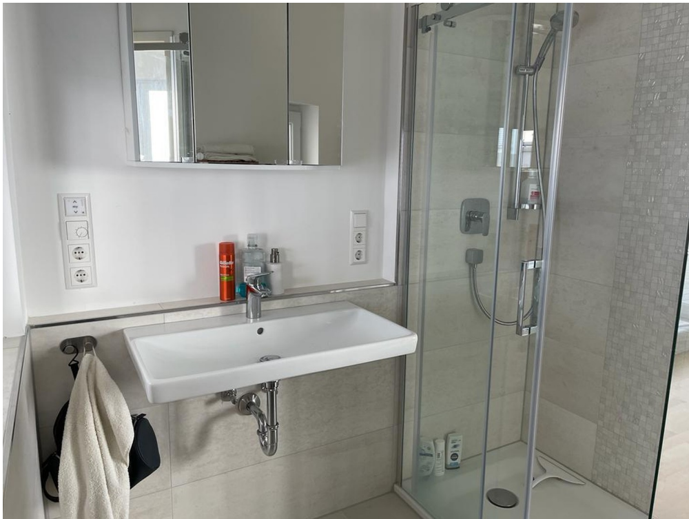
Duschbad DG 1