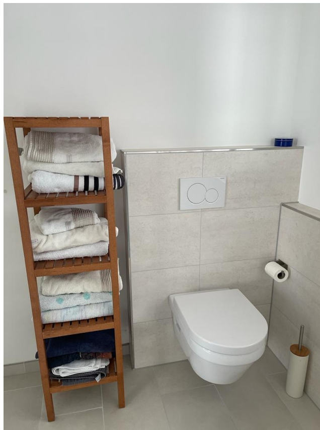
Duschbad DG 2