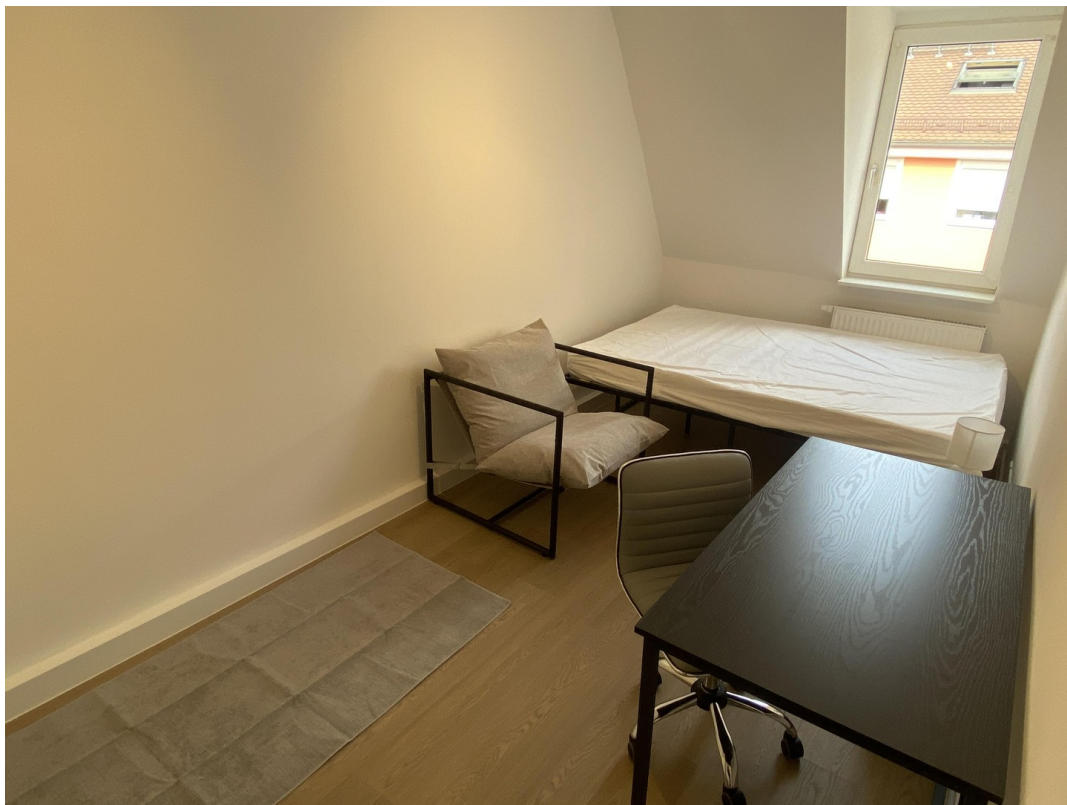
Ansicht WG - Zimmer 3