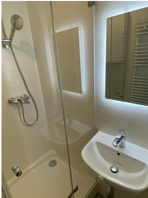
Ansicht 2 Badezimmer