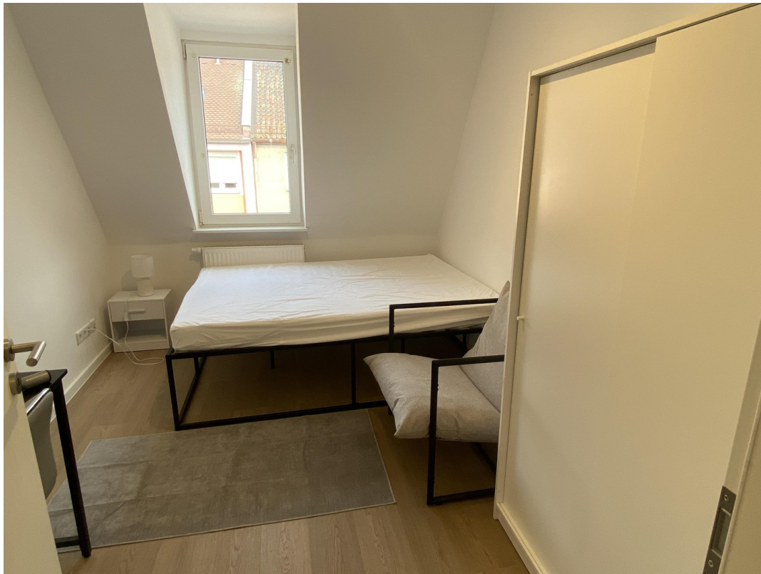
Ansicht WG - Zimmer 2