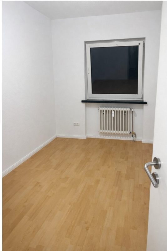
Zimmer 2 mit Laminat