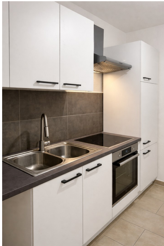
Kochzeile mit Backofen & Herd