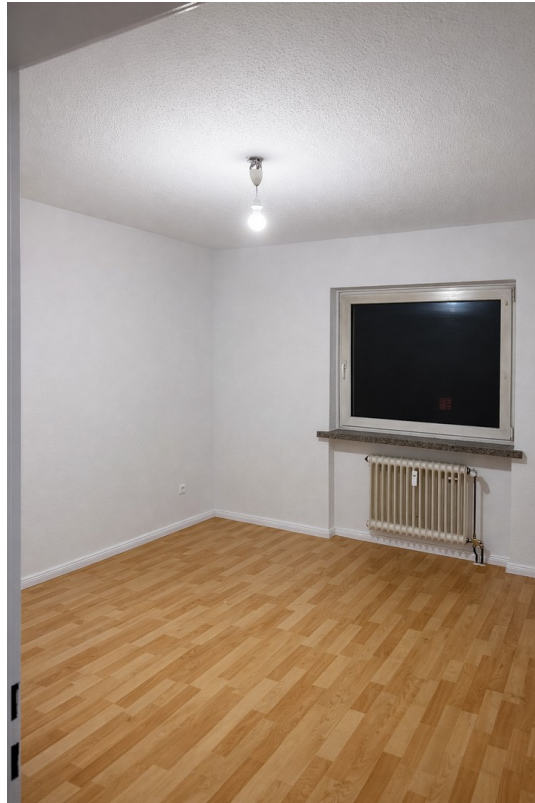
Schlafzimmer mit Laminatboden