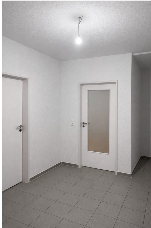
Flur mit Türen