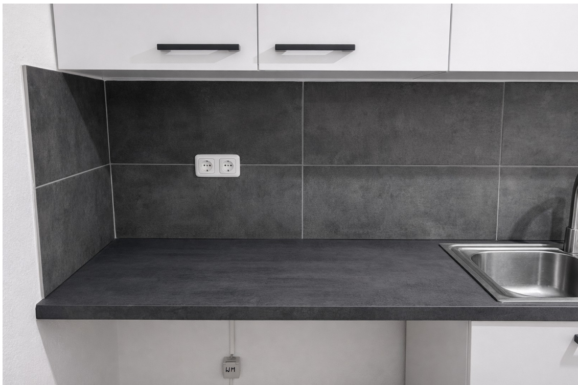
Platz für Wasch-Spülmaschine