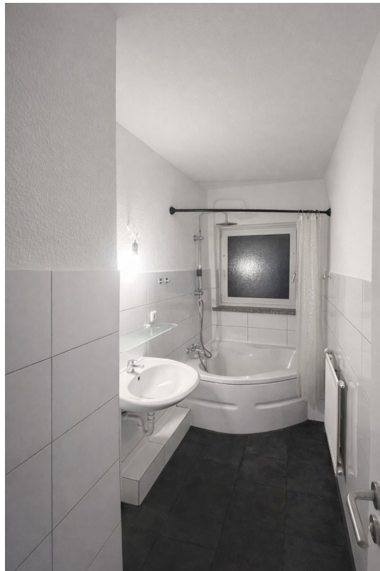
Tageslichtbad mit Badewanne