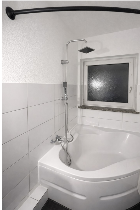
Badewanne mit Duschfunktion