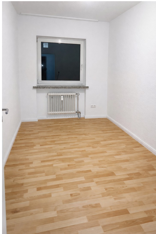
Zimmer 1 mit Laminat