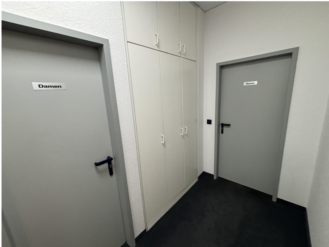
WC Anlagen 2