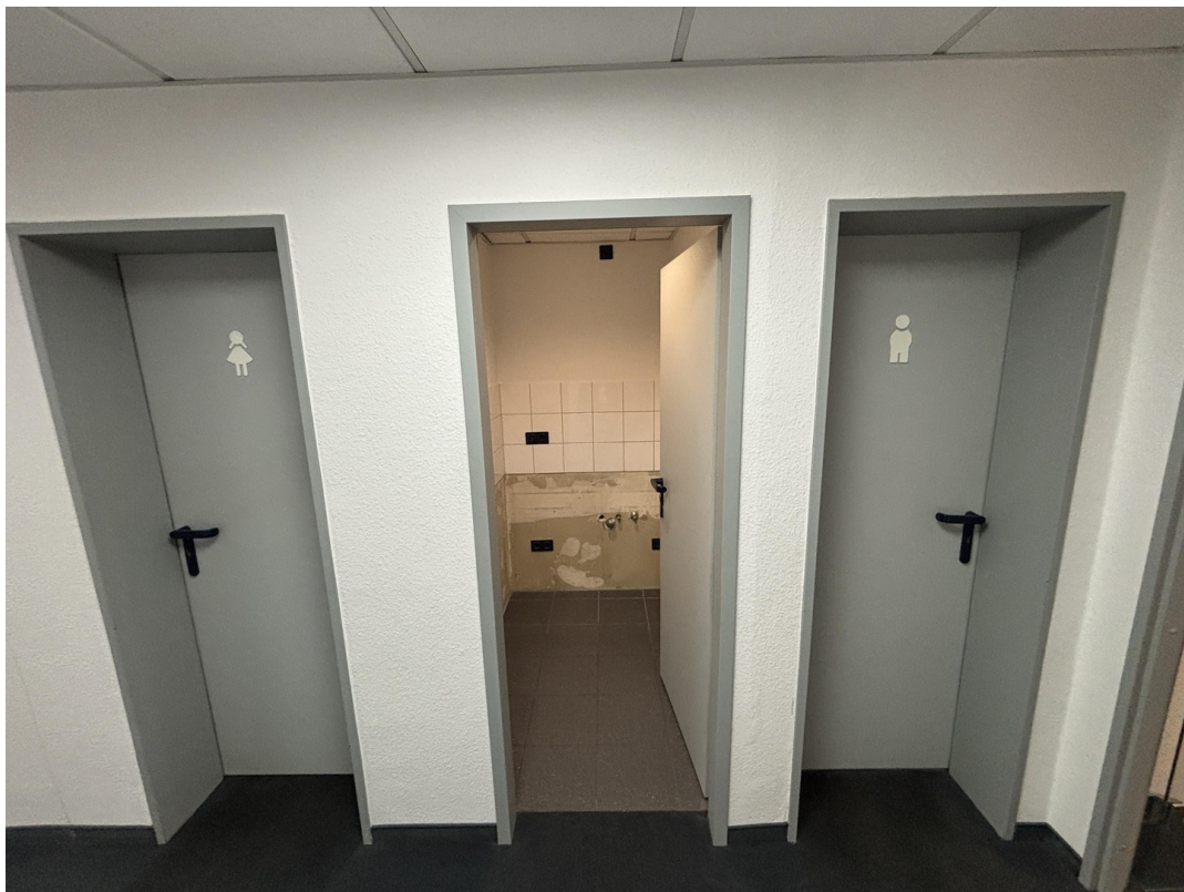
WC Anlagen 1 + Teeküche