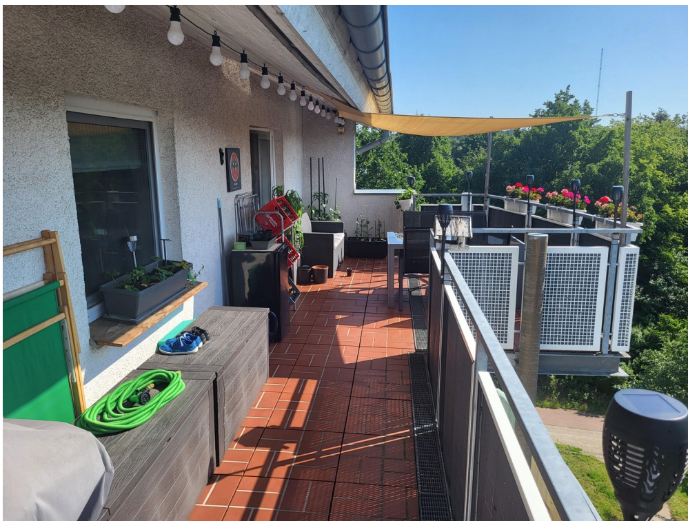
Terrasse mit altem Fußboden